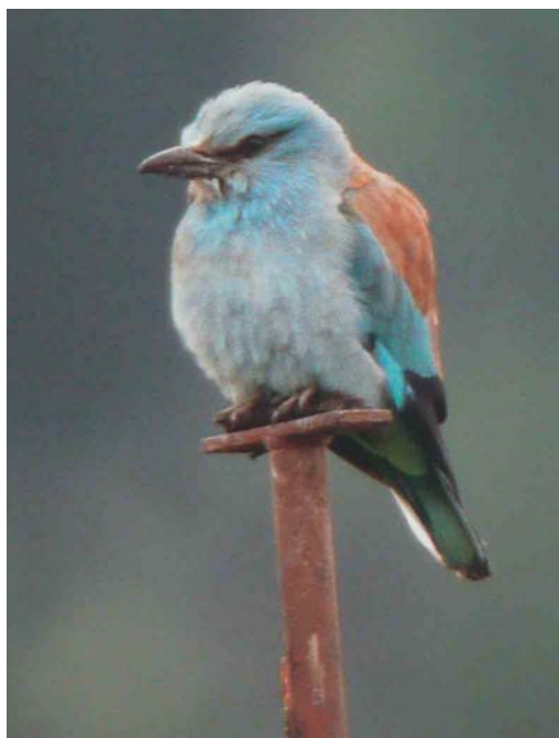
285 Lesser Grey Shrike / Kleine Klapekster Lanius minor , Kerzers, Fribourg, Switzerland, 14 May 2003 ( Adrian Jordi ) 286 European Roller / Scharrelaar Coracias garrulus , Wauwiler Moos, Luzern, Switzerland, 13 May 2003 ( Adrian Jordi ) 287 Caspian Stonechat / Kaspische Roodborsttapuit Saxicola maura variegata , Skagen, Denmark, 18 May 2003 ( Ole Krogh ) 288 Thick-billed Warbler / Diksnavelrietzanger Acrocephalus aedon , Fair Isle, Shetland, Scotland, 16 May 2003 ( Deryk Shaw )