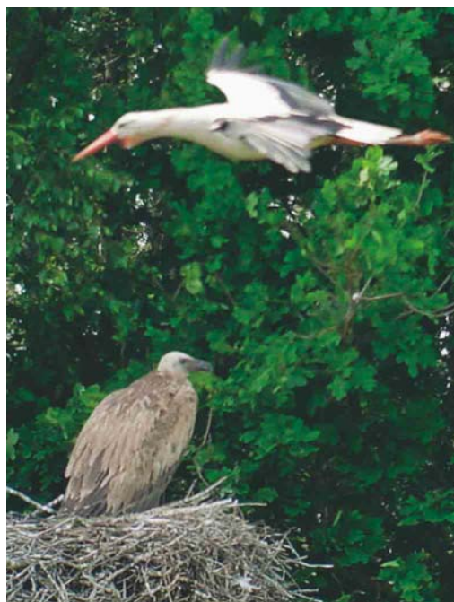
322 Vale Gier / Eurasian Griffon Vulture Gyps fulvus , onvolwassen, met Ooievaar / White Stork Ciconia ciconia , De Wijk, Drenthe, 4 juni 2003

Sinds de waarneming van een Vale Gier in april-mei 1993 nabij Durgerdam, Noord-Holland (de eerste twitchbare voor Nederland), is het aantal waarnemingen van deze soort in Nederland opmerkelijk toegenomen. Sinds 1997 is de soort jaarlijks vastgesteld, met zelfs groepen van zes, twee, 18 en 16 of meer in respectievelijk 1998, 2000, 2001 en 2002. Eén van de vogels in 2001 droeg een Spaanse ring. MARTEN VAN DIJL