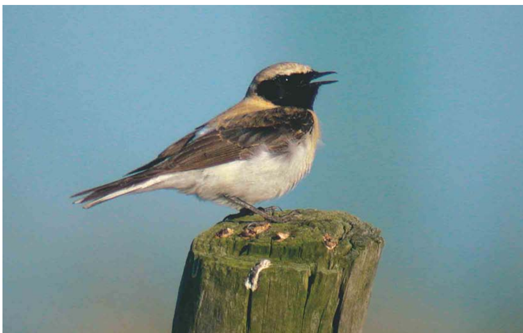
310 Oostelijke Blonde Tapuit / Eastern Black-eared Wheatear Oenanthe melanoleuca , eerste-zomer mannetje, Texel, Noord-Holland, 4 mei 2003 (Hans ter Haar)