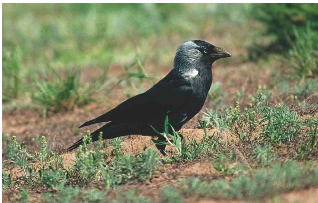
247 Russian Jackdaw / Russische Kauw Corvus monedula soemmerringii , Korgalzhyn, Tengiz, Kazakhstan, 25 May 2003 (Arnoud B van den Berg)

It seems that of the three subspecies, spermologus and the eastern and south-eastern populations of soemmerringii are most easy to identify. Voipio (1969) concluded that because of the overall darker plumage and the lack of a pale neck-patch and collar in spermologus , the difference between this subspecies and monedula is stronger than that between monedula and the western populations of soemmerringii . Voipio (1969) also considered the white neck-patch and collar to be the main basis for separation between monedula and western populations of soemmerringii . In the latter, however, these can be lacking in females and in first-winter plumage and obscured because of wear in breeding plumage. This leaves only adult males in fresh plumage identifiable by their neck-patch and collar;