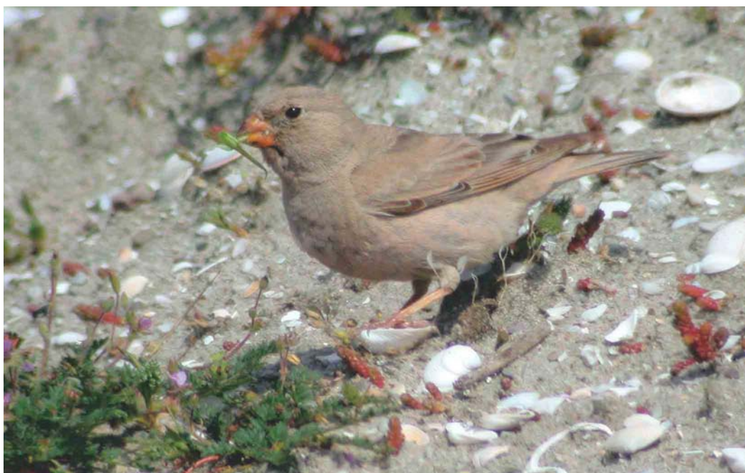
311 Woestijnvink / Trumpeter Finch Bucanetes githagineus , Maasvlakte, Zuid-Holland, 31 mei 2003