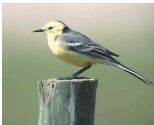
293 Magnificent Frigatebird / Amerikaanse Fregatvogel Fregata magnificens , Ilheu De Baluarte, Boavista, Cape Verde Islands, 6 April 2003 ( Nico Geiregat ) 294 Eurasian Crag Martin / Rotswaluw Hirundo rupestris , Lemland, Lågskär, Ahvenanmaa, Finland, 27 May 2003 ( Harry J Lehto ) 295 Booted Warbler / Kleine Spotvogel Acrocephalus caligatus , Ottenby, Öland, Sweden, 30 May 2003 ( Fredrik Hansson ) 296 Plain Martin / Vale Oeverzwaluw Riparia paludicola (left), with House Martin / Huiszwaluw Delichon urbica , Eilat, Israel, 1 July 2003 ( James P Smith ) 297 African Collared Dove / Izabeltortel Streptopelia roseogrisea , Bir Shalatein, Egypt, 14 May 2003 ( Tommy Frandsen/Cursorius ) 298 Citrine Wagtail / Citroenkwikstaart Motacilla citreola , male, Beijershamn, Öland, Sweden, 31 May 2003 ( Fredrik Hansson )