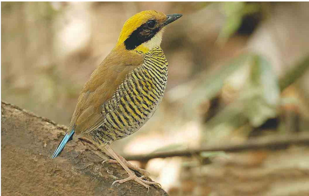
269 Gurney's Pitta / Gurneys Pitta Pitta gurneyi , female, Khao Nor Chuchi, Khao Pra-Bang Khram reserve, Thailand, 4 April 2003