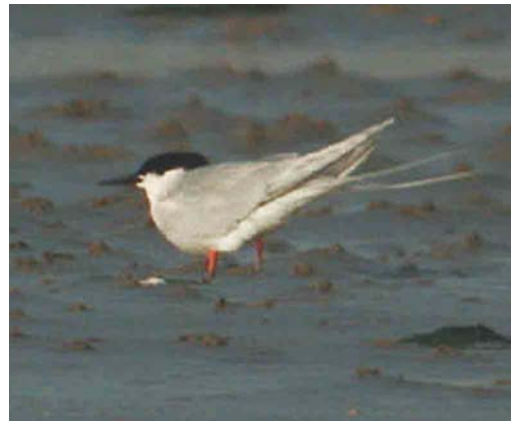
320 Dougalls Stern / Roseate Tern Sterna dougallii , Zeebrugge, West-Vlaanderen, 16 juni 2003

Falco vespertinus over Poederlee, Antwerpen; op 15 mei was kortstondig een vrouwtje aanwezig bij Verrebroek; op 5 juni werd er één opgemerkt te Kalmthout; op 6 juni waren er waarnemingen te Tielen, Antwerpen, en Rochefort, Luxembourg; en op 15 juni vloog er één laag over De Gavers. Een mogelijke Sakervalk F cherrug werd op 15 juni gefotografeerd bij Geraardsbergen, Oost-Vlaanderen.