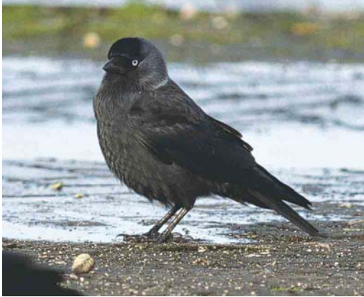
243 Probable Nordic Jackdaw / Noordse Kauw Corvus monedula monedula , Lauwersoog, Groningen, Netherlands, 29 November 2000. Uniformly coloured bird with faint silvery collar. Such birds could very well originate from the intergradation zone between Common Jackdaw C m spermologus and monedula , sometimes referred to as C m 'turrium' .

eastern Europe towards the west (Glutz von Blotzheim & Bauer 1991). Furthermore, there are individuals possessing no patch or collar or just a vague one. This is more often the case in monedula than in soemmerringii , and these are relatively often females (Voous 1960, Voipio 1969). In southern Finland, the average size of the white patch in the foreneck increases from south-west to north-east and, especially, east. The average size of this patch in the easternmost Finnish