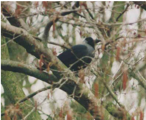
343 Huiskraai / House Crow Corvus splendens , adult, Schiermonnikoog, Friesland, Netherlands, March 2000 (Cees A van der Wal)

birders to submit records to the CDNA may be decreasing, also because House Crows are often not regarded as 'true' vagrants that deserve full documentation. Although most reports of House Crows can be considered reliable, mistakes have been made and are always possible, making a cautious approach necessary. Moreover, if the breeding population in Hoek van Holland continues to grow, House Crow is likely to be deleted from the list of species considered by the CDNA.