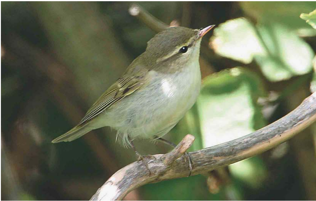
382 Greenish Warbler / Grauwe Fitis Phylloscopus trochiloides , Reculver, Kent, England, 30 August 2003