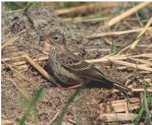
362 Meadow Pipit / Graspieper Anthus pratensis , Petten, Noord-Holland, Netherlands, July 1999

This juvenile Meadow Pipit was photographed