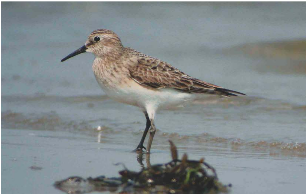
381 Baird's Sandpiper / Bairds Strandloper Calidris bairdii , adult, De Cocksdorp, Texel, Noord-Holland, Netherlands, 8 August 2003