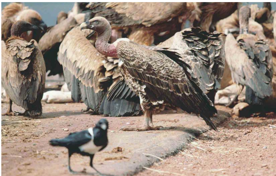
332 Rüppell's Griffon Vulture / Rüppells Gier Gyps rueppellii , subadult, with White-backed Vulture / Witruiggier G africanus and Eurasian Griffon Vultures / Vale Gieren G fulvus , between Diourbel and Kaolack, Senegal, 14 February 1999 (David Bigas). Wintering Eurasian Griffon Vultures share wintering grounds with Rüppell's Griffon Vultures.

(SEO/Birdlife et al 1999). In 1999, the numbers of Eurasian Griffons actually crossing increased to 2649 and, in 2000, there were 4816 confirmed to take off for the African side of the Straits (SEO/Birdlife et al 2001). The autumn migration of Eurasian Griffons lasts from October to November, mainly during the third and fourth weeks of October, and this passage is more obvious than the spring one (Finlayson 1992, SEO/Birdlife et al 1999). The northward movement of Eurasian Griffons across the Straits has been much less documented than the southward passage, in common with that of other soaring birds, because coordinated counts along the entire length of the Straits have largely been confined to the southward passage period. Nevertheless, observations from Gibraltar itself, which have been made every year since 1964 (in addition to numerous earlier records) have established the following (Ernest Garcia in litt): 1 Eurasian Griffons only appear at Gibraltar during westerly winds, a situation which applies to other soaring birds as well; 2 the principal passage is quite late, concentrated in May