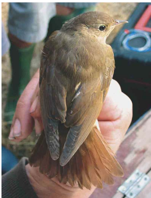
399 Noordse Nachtegaal / Thrush Nightingale Luscinia luscinia , Kinrooi, Limburg, 26 augustus 2003