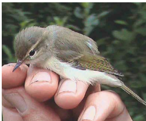
336 Grauwe Fitis / Greenish Warbler Phylloscopus trochiloides , juveniel, Groene Glop, Schiermonnikoog, Friesland, 29 juli 2003

vogels meer gezien of gehoord, ondanks dagelijkse wandelingen tot en met 2 augustus.