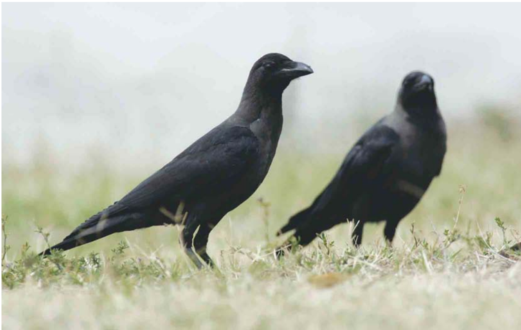
339 House Crows / Huis kraaien Corvus splendens , adult (right) and juvenile, Hoek van Holland, Zuid-Holland, Netherlands, 7 September 2003 (Marten van Dijk)