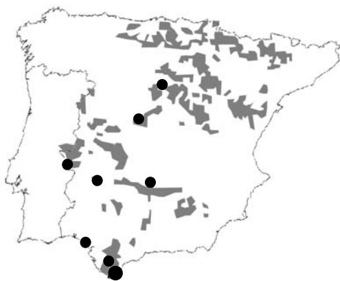
FIGURE 1 Locations of Rüppell's Griffon Vulture / Rüppell's Gieren Gyps rueppellii records in Spain (dots) and breeding distribution of Eurasian Griffon Vulture G fulvus in 1999 (after Del Moral & Martí 2001). Area of Cádiz-Straits of Gibraltar holds six of 12 records. Note that Rüppell's Griffon record locations are from breeding areas of Eurasian Griffon with the exception of the Doñana 1992 bird. North-eastern Spain has large Eurasian Griffon colonies but no Rüppell's Griffon records.

from the rarities committee's reports or, where possible, by studying the documentation. Locations were geo-referenced and plotted on a digital map. Movements of Eurasian Griffon Vultures were studied by: 1 analysis of ringing recoveries of Spanish birds in Africa that were geo-referenced and plotted on a map, and 2 analysis of data from migration counts at the Straits of Gibraltar. Maps were plotted using Miramon Geographical Information System. The status of both vultures in Africa was established by researching the relevant literature and by contacting active researchers (see Acknowledgements).