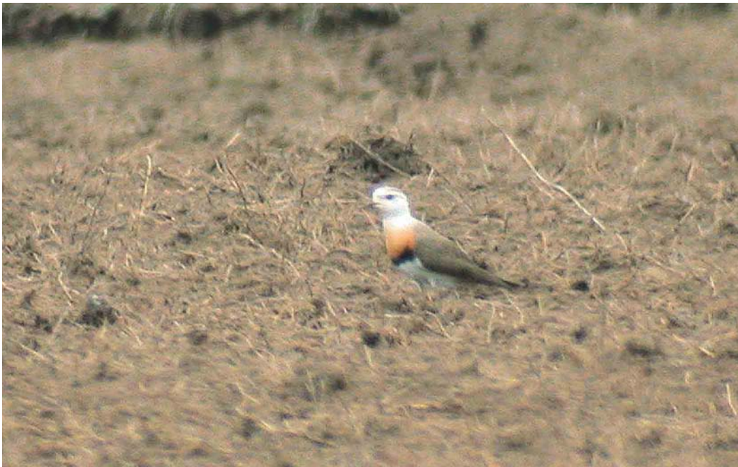
380 Oriental Plover / Steppeplevier Charadrius veredus , adult, Ilmajoki Kahrakuusentie, Finland, 25 May 2003 cf Dutch Birding 25: 263, 2003