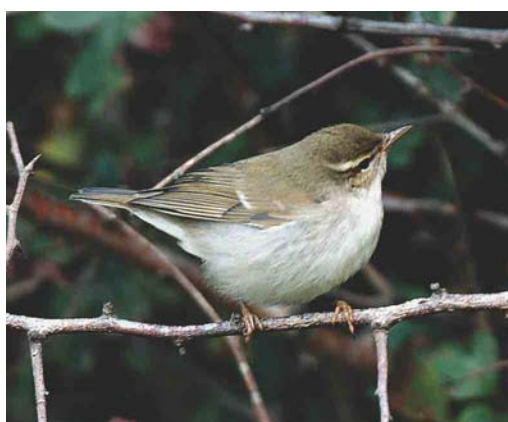
366-367 Wilson's Storm-petrel / Wilsons Stormvogeltje Oceanites oceanicus , off Donegal, Ireland, August 2003 (Anthony McGeehan) 368 Redhead / Amerikaanse Tafeleend Aythya americana , Cape Clear Island, Cork, Ireland, July 2003 (Paul Kelly) 369 Ring-necked Duck / Ringsnaveleend Aythya collaris , adult male eclipse, Gran Tarajal Lagoon, Fuerteventura, Canary Islands, August 2003 (Paul Kelly) 370 Great Spotted Cuckoo / Kuifkoekoek Clamator glandarius , juvenile, Spurn, East Yorkshire, England, July 2003 (Steve Young/Birdwatch) 371 Arctic Warbler / Noordse Boszanger Phylloscopus borealis , Spurn, Yorkshire, England, 31 August 2003 (Steve Young/Birdwatch)