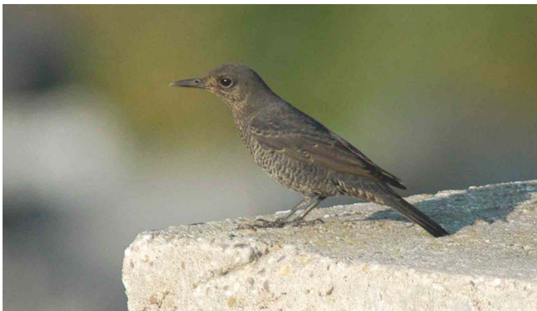
405 Blauwe Rotslijster / Blue Rock Thrush Monticola solitarius , Westkapelle, Zeeland, 20 september 2003 (Marten van Dijk)