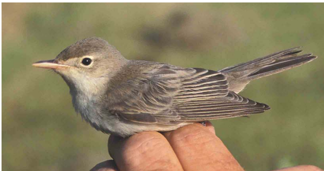
402 Spotvogel / Icterine Warbler Hippolais icterina , eerste-winter, Zandvoort, Noord-Holland, 17 augustus 2003

Spotvogel zonder groen en geel te Zandvoort Op 17 augustus 2003 ving Hans Vader in aanwezigheid van Lydekke van Citters, Marcel Schalkwijk en Piet Veel een bijzondere spotvogel Hippolais op de ringbaan van de Amsterdamse Waterleidingduinen te Zandvoort, Noord-Holland ( http://home.planet.nl/~schal443/Vinkenbaan/VinkenbaanAWduin.htm ). De platte, brede snavel (5.8 mm) en het postuur wezen op een spotvogel maar door het ontbreken van groen en geel in het kleed werden Spotvogel H ictarina en Orpheusspotvogel H polyglotta aanvankelijk buiten beschouwing gelaten. De vleugels hadden een (diverse keren nagemeten) lengte van 76 mm en daarop paste volgens de Identification guide to European passerines (Svensson 1992) verder alleen Grote Vale Spotvogel H languida . De overige biometri-