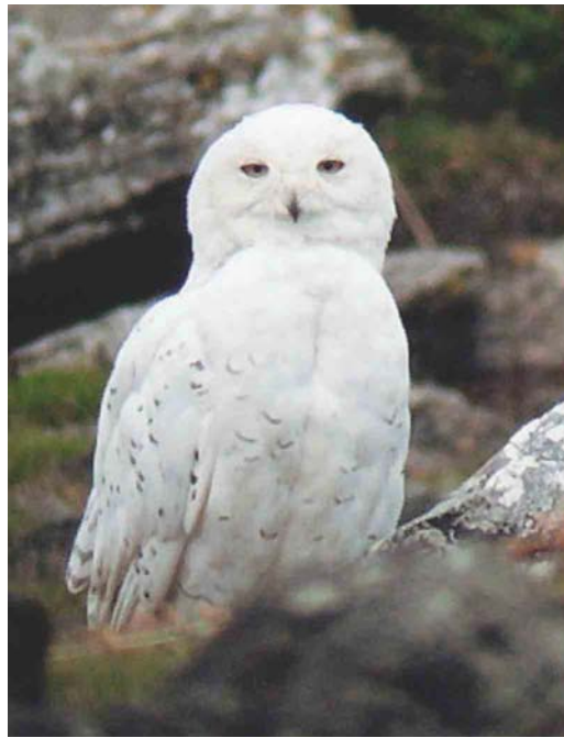
363 Masked Booby / Maskergent Sula dactylatra , Bay of Biscay, Spain, 3 September 2003 364 Snowy Owl / Sneeuwuil Nyctea scandiaca , male, North Uist, Western Isles, Scotland, 16 August 2003 365 Elegant Tern / Sierlijke Stern Sterna elegans , subadult, Pointe de l'Imperlay, Corsept, Loire-Atlantique, France, 31 August 2003