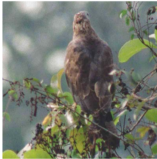
Mystery photograph X (March)

at Petten, Noord-Holland, the Netherlands, in July 1999. Plate 362 shows another photograph of the same bird. This mystery bird was correctly identified by 30% of the entrants. The most frequently mentioned incorrect answers included Tree Pipit (10%), Rock Pipit (4%), Greater Short-toed Lark (9%) and Oriental Skylark (9%).