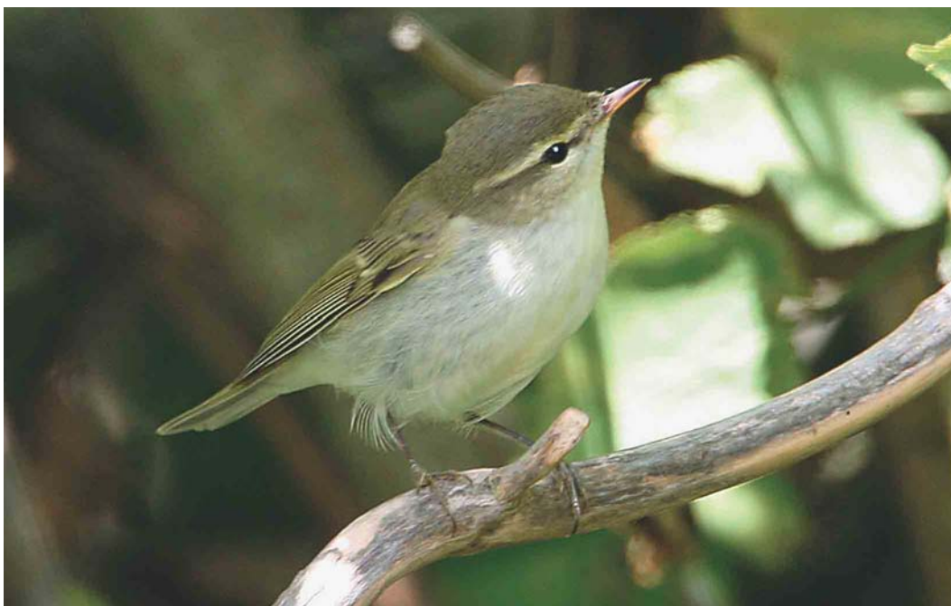
382 Greenish Warbler / Grauwe Fitis Phylloscopus trochiloides , Reculver, Kent, England, 30 August 2003