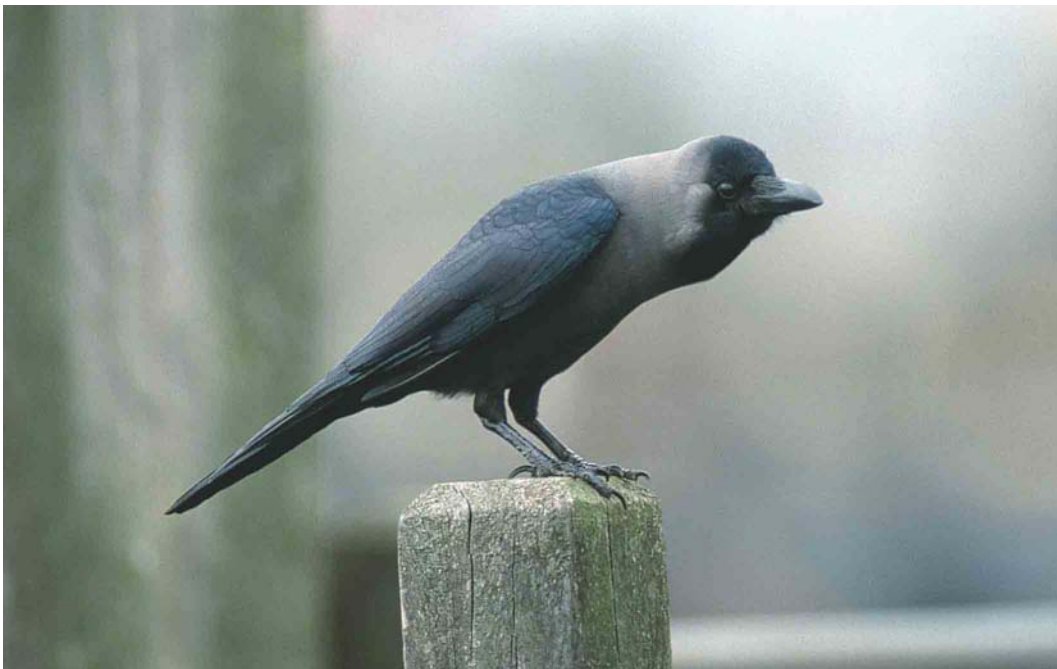
340 House Crow / Huis kraai Corvus splendens , adult, Hoek van Holland, Zuid-Holland, Netherlands, 9 April 2002 (Marten van Dijk)