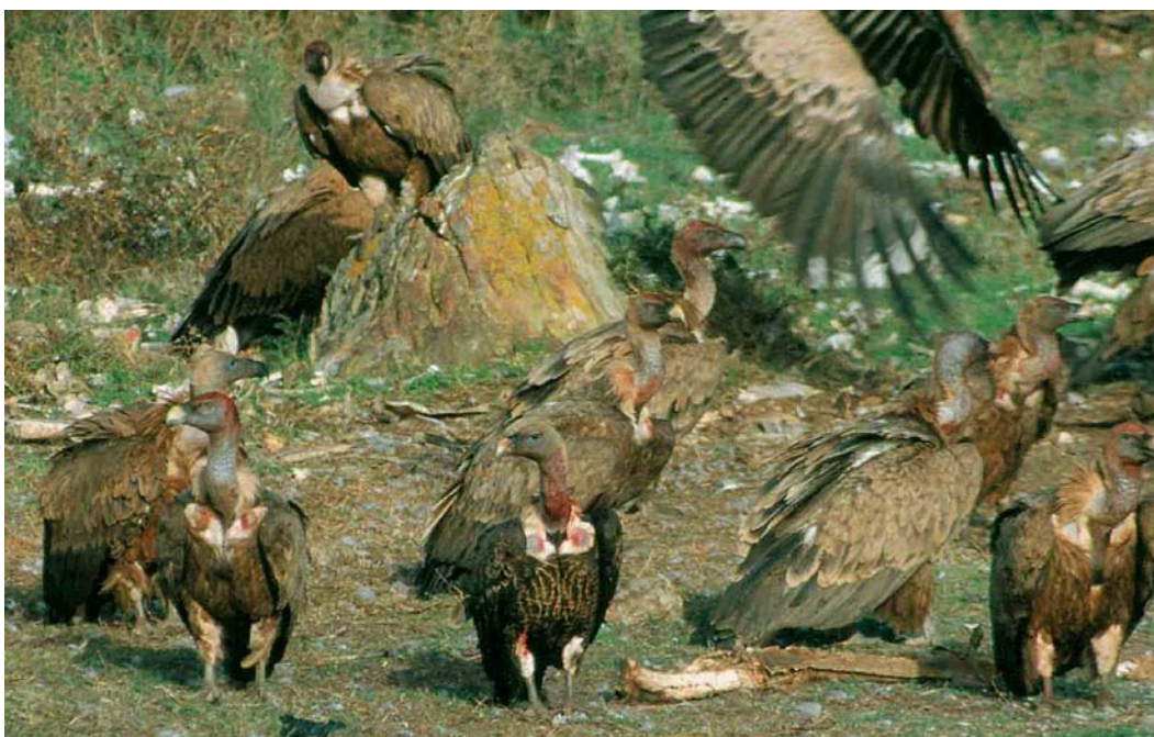
327 Rüppell's Griffon Vulture / Rüppells Gier Gyps rueppellii , immature (front centre), with Eurasian Griffon Vultures / Vale Gieren G fulvus , Tarifa, Cádiz, Spain, 4 October 2001 (Javier E Navarro)

its bad condition and brought to the Jerez Zoo on 28 May. It showed no signs of having been in captivity. It was marked with a radio-transmitter and PVC ring (plate 329) and released into the wild on 10 July 2003; it remained in the Cádiz area at least until early September 2003. This is the first proven case of a Rüppells Vulture apparently coming from Africa in a direct flight in an otherwise well covered area by local ornitholo-