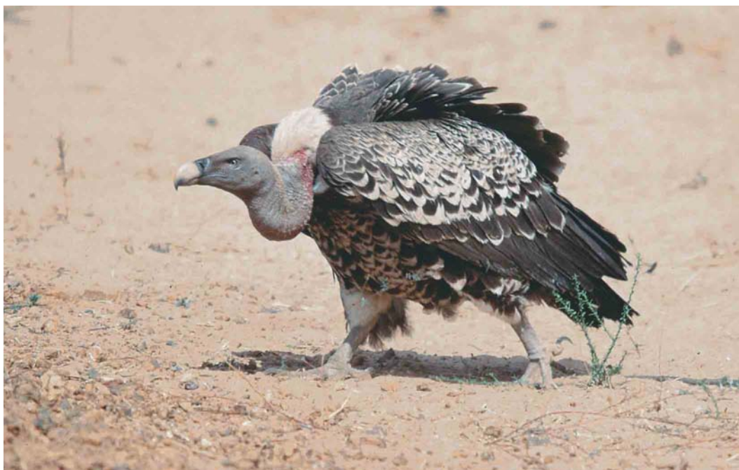
334 Rüppell's Griffon Vulture / Rüppells Gier Gyps rueppellii , adult, between Diourbel and Kaolack, Senegal, 14 February 1999 (David Bigas). The edges of the coverts are not as white as in birds from East Africa.