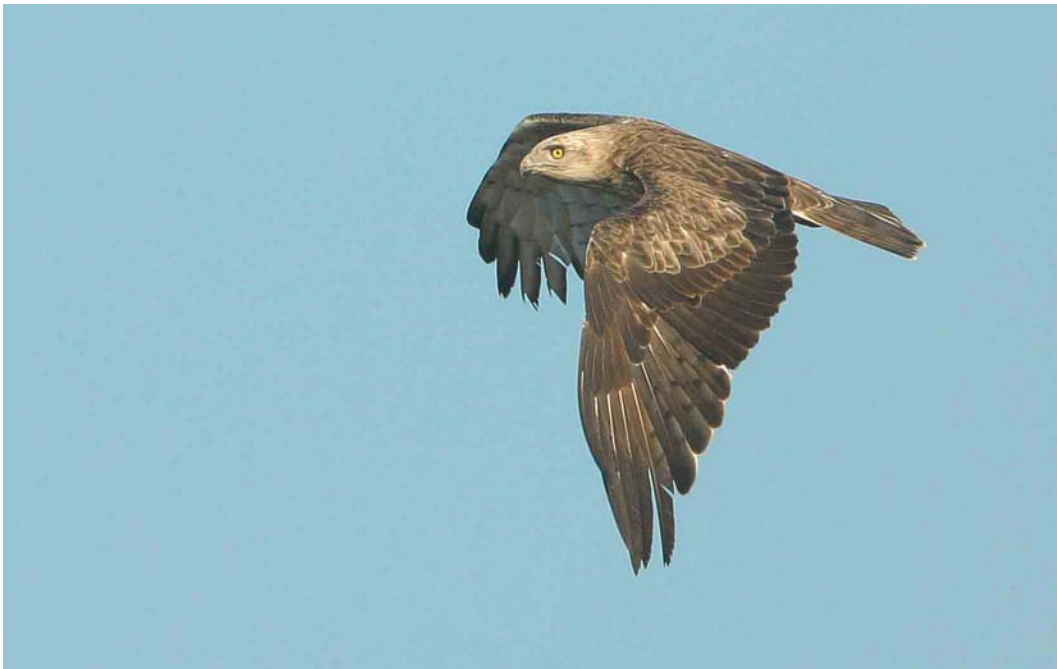
384-385 Slangenarend / Short-toed Eagle Circaetus gallicus , De Hamert, Limburg, 10 augustus 2003 (Ran Schols)