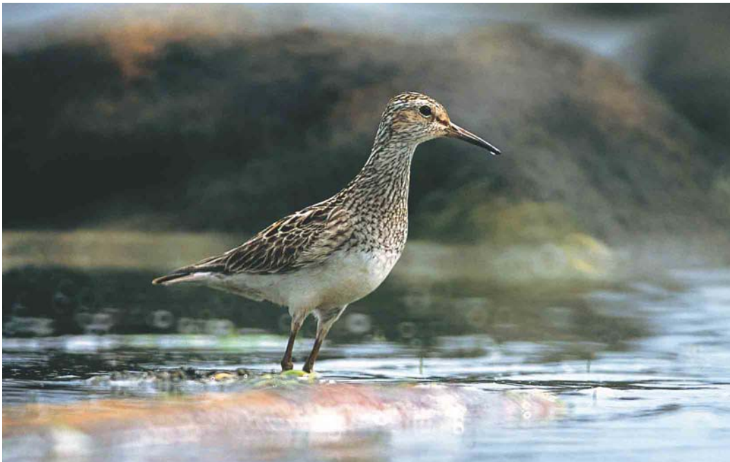
378 Pectoral Sandpiper / Gestreepte Strandloper Calidris melanotos , Tory Island, Donegal, Ireland, 12 July 2003