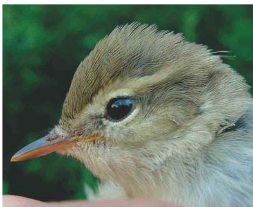
335 Grauwe Fitis / Greenish Warbler Phylloscopus trochiloides , juveniel, Groene Glop, Schiermonnikoog, Friesland, 29 juli 2003