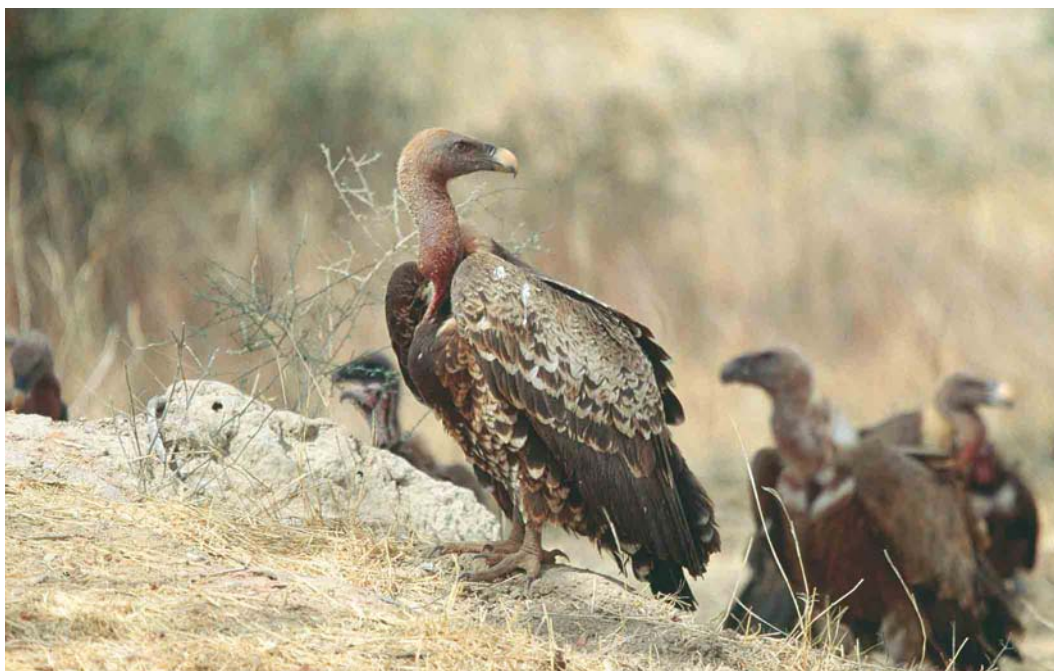
333 Rüppell's Griffon Vulture / Rüppells Gier Gyps rueppellii , subadult, with White-backed Vultures / Witruiggieren G. africanus , between Diourbel and Kaolack, Senegal, 14 February 1999. Compare shape and colour of upperwing-coverts edges with those of Spanish birds and Rüppells Griffon Vultures from Kenya in plate 331.

1933; a bird in a mixed flock of Eurasian Griffon Vultures and Lappet-faced Vultures Torgos tracheliotos at Suez on 29 March 1962; one on 15 April 1965 at Ain Sukhna; and one on 27 March 1983 at Gebel Elba. There are a few additional unconfirmed observations from southern Sinai before 1974 and in 1980 (Goodman & Meininger 1989, Meininger 1995). Besides, there is a specimen collected by Parzudaky in Egypt in the collection of KBIN, Brussels, Belgium, since 21 April 1859, with collection number KBIN 2162-5915 (Gunter De Smet in litt).