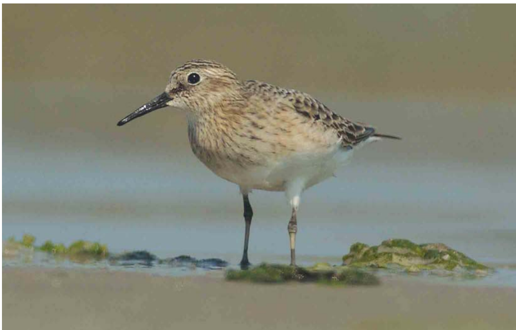
389 Bairds Strandloper / Baird's Sandpiper Calidris bairdii , adult, De Cocksdorp, Texel, Noord-Holland, 8 augustus 2003