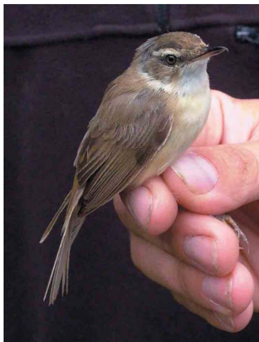
400 Veldrietzanger / Paddyfield Warbler Acrocephalus agricola , Bellem, Oost-Vlaanderen, 9 augustus 2003

UILEN TOT GORZEN De claim van een roepende Dwergooruil Otus scops bij Frahan-Poupehan, Luxembourg, op 27 juli kon door middel van een geluidsopname bevestigd worden. De Bijeneters Merops apiaster van Wachtebeke, Oost-Vlaanderen, produceerden dit jaar twee jongen; op 26 juli verlieten ze het nest. Tussen 24 en 31 augustus werden Draaihalzen Jynx torquilla waargenomen of geringd in de Gentse Kanaalzone, Oost-Vlaanderen; te Heist, West-Vlaanderen; op de Kalmthoutse Heide, Antwerpen; te Lier; en bij Oostmalle, Antwerpen. Waarnemingen van Duinpiepers Anthus campestris kwamen van het Groot Schietveld te Brecht (3 augustus); Heist (27 augustus); Nieuwpoort (24 augustus); Oostmalle (21 augustus); de bezinkingsputten van Tienen, Vlaams-Brabant (16 augustus); en de Uitkerkse Polders, West-Vlaanderen (twee op 24 augustus). Een Noordse Nachtegaal Luscinia luscinia werd op 18 augustus geringd te Hamme-Mille, Brabant-Wallon. Op 24 juli zong er een nieuwe Graszanger Cisticola juncidis bij Bredene, West-Vlaanderen. Langs de westkust bij Veurne, West-Vlaanderen, werden weer 10-tallen Waterrietzangers Acrocephalus paludicola geringd, vooral in augustus. De eerste Veldrietzanger A agricola