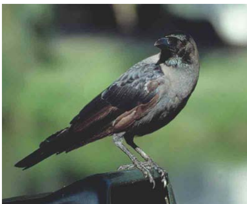
341 House Crow / Huiskraai Crow Corvus splendens , first-summer, Muiden, Noord-Holland, Netherlands, August 1999