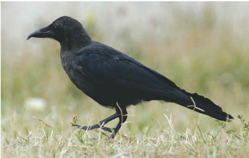
338 House Crow / Huis kraai Corvus splendens , juvenile, Hoek van Holland, Zuid-Holland, Netherlands, 7 September 2003