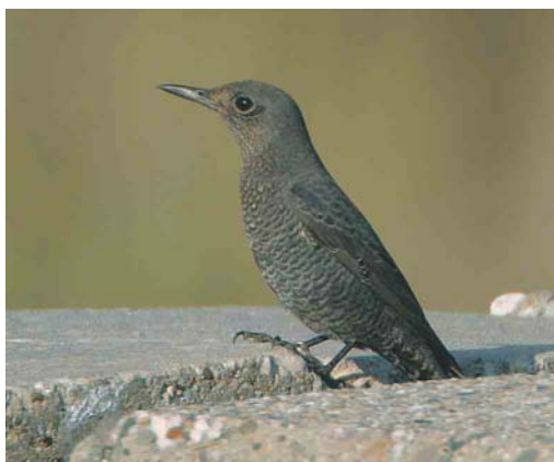
406 Blauwe Rotslijster / Blue Rock Thrush Monticola solitarius , Westkapelle, Zeeland, 20 september 2003

BLUE ROCK THRUSH A Blue Rock Thrush Monticola solitarius stayed at Westkapelle, Zeeland, the Netherlands, on 20 September 2003. The bird was found at c 13:00 and could be observed until dark (c 20:00) by over 200 observers. If accepted, it is the first record. The species is a vagrant in western Europe, with records in Belgium (1), Britain (5), Finland (2), Germany (2+) and Sweden (1).