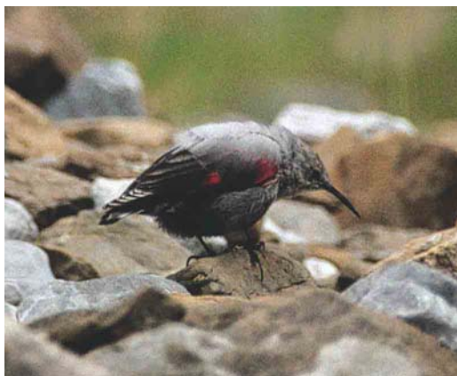
344-345 Wallcreeper / Rotskruiper Tichodroma muraria , first-winter, Cirque de Gavarnie, Gavarnie, Hautes-Pyrénées, France, 7 September 1995 ( Arnoud B van den Berg )

Wallcreeper's conspicuously crimson-coloured wings makes one wondering why the colour needs to be so radiant in such a poor environment as limestone-dolomite rock faces, where a dull or cryptically coloured bird might be expected. Another mystery is why a bird on a bare and steep rock face should draw attention to itself by its shimmering, continuously flicking wings; prominent restlessness is an unusual survival tactic,