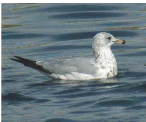
372 Grey-tailed Tattler / Grijsze Ruiter Heteroscelus brevipes, Sebybadet, Öland, Sweden, 12 July 2003 373 Hudsonian Godwit / Rode Grutto Limosa haemastica, Väsby fjärd, Öland, Sweden, 19 June 2003 cf Dutch Birding 25: 263, 2003 374-375 Oriental Plover / Steppesplevier Charadrius veredus, adult, Ilmajoki Kahrakuusentie, Finland, 25 May 2003 cf Dutch Birding 25: 263, 2003 376 Great Snipe / Poelsnip Gallinago media, Kolansko blato, Pag island, Croatia, 1 May 2003 377 Ring-billed Gull / Ringsnavelmeeuw Larus delawarensis, Calais, Pas-de-Calais, France, 27 July 2003