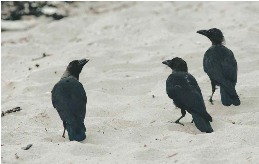
337 House Crows / Huis kraaien Corvus splendens , adult (left) with juveniles, Hoek van Holland, Zuid-Holland, Netherlands, 7 September 2003