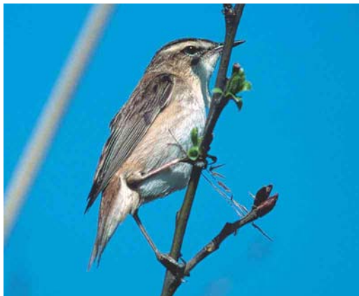
361 Sedge Warbler / Rietzanger Acrocephalus schoenobaenus , Rottemeren, Zuid-Holland, Netherlands, April 2003

VIII The answers received for mystery photograph VIII could be roughly divided into three different groups. The majority of the entrants opted for one of the pipits Anthus (44%). Second in popularity were the larks Alaudidae (42%). Another 14% of the entrants thought the mystery bird to be a finch or bunting. Indeed, the slightly forked tail and the raised crown-feathers shown by the mystery bird, seem to indicate the latter. In addition, some buntings like Cirl Bunting E cirillus and Corn Bunting E calandra , which were among the answers, show distinctly streaked mantle-feathers. On the other hand, the mystery bird clearly shows a very short primary projection. The tertials are very long and cover the primaries almost completely. This feature easily excludes all species of finches and buntings and also many species of larks. Only Greater Short-