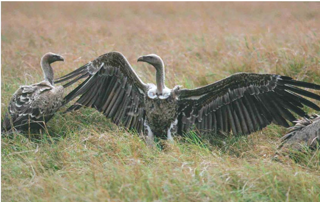
330-331 Rüppell's Griffon Vultures / Rüppells Gieren Gyps rueppellii , Kenya, August 1987 (Xavier Parellada). Note paler and more defined edges of wing-coverts in adults in comparison with similar-aged birds from Senegal (and Spain).