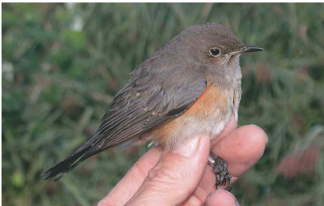
403 Perzische Roodborst / White-throated Robin Irania gutturalis , eerstejaars, bij Budel-Dorplein, Limburg, 30 augustus 2003

WHITE-THROATED ROBIN On 30 August 2003, a first-year White-throated Robin Irania gutturalis was trapped and ringed at Budel-Dorplein, an inland ringing site on the border of Noord-Brabant and Limburg, the Netherlands. If accepted, this is the third record after an adult male in November 1986 and a first-summer female in June 1995.