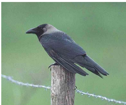
342 House Crow / Huiskraai Crow Corvus splendens , adult, Renesse, Zeeland, Netherlands, May 2001 (Marten van Dijl)