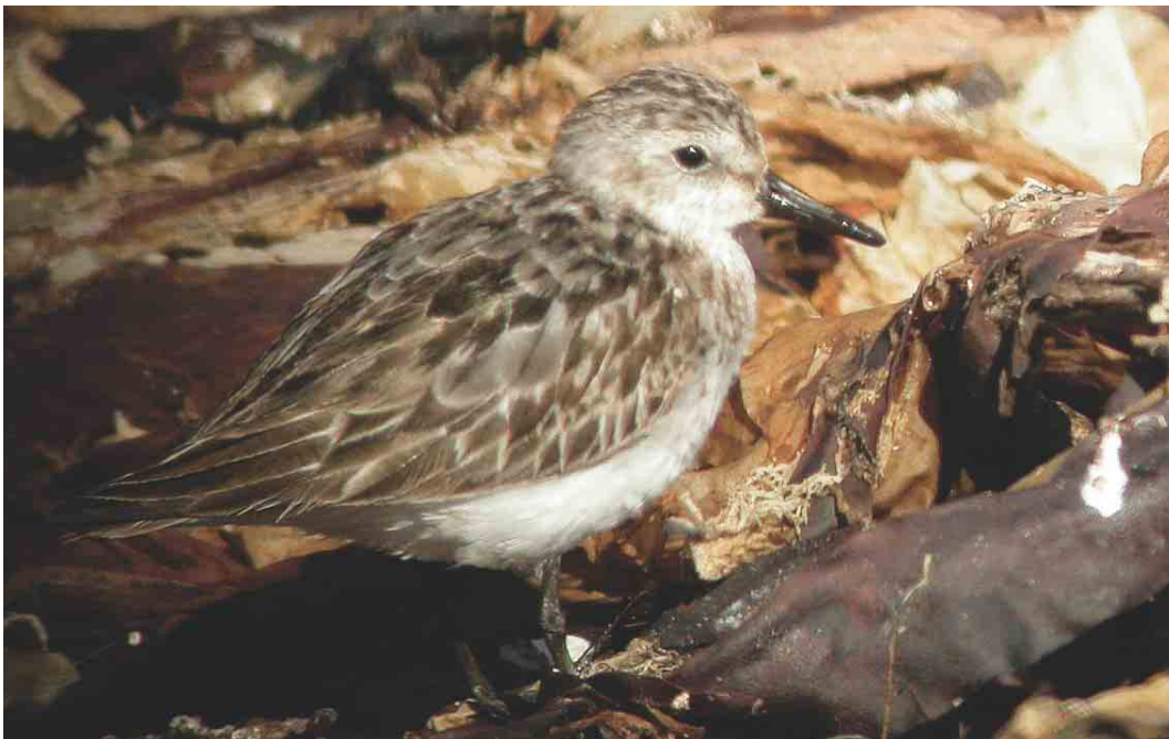
379 Semipalmated Sandpiper / Grijze Strandloper Calidris pusilla , adult, Fair Isle, Shetland, Scotland, August 2003