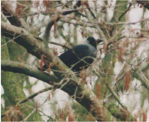
343 Huiskraai / House Crow Corvus splendens , adult, Schiermonnikoog, Friesland, Netherlands, March 2000 (Cees A van der Wal)

birders to submit records to the CDNA may be decreasing, also because House Crows are often not regarded as 'true' vagrants that deserve full documentation. Although most reports of House Crows can be considered reliable, mistakes have been made and are always possible, making a cautious approach necessary. Moreover, if the breeding population in Hoek van Holland continues to grow, House Crow is likely to be deleted from the list of species considered by the CDNA.