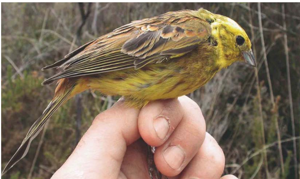
358 Yellowhammer / Geelgors Emberiza citrinella , adult male, Lussac-les-Châteaux, Vienne, France, 2 May 2003 (Frédéric Jiguet). Most males captured on this site showed a more or less obvious rufous malar stripe and an obvious olive band on the upper chest but no bird other than the hybrid in plate 347-349 displayed any rufous on the forehead or along the sub-moustachial stripes as well as a complete and extensive rufous chest band.

nent border to the ear-coverts. Most of these criteria fit the bird captured at Lussac-les-Châteaux very well. In pale-morph hybrids, such as those reported in Aye & Schweizer (2003), the sub-moustachial area is rufous to a varying degree, the throat is white or rufous and the ground colour of the head is usually pure white but may be pale yellow (Byers et al 1995). Our bird was quite similar to such birds but with a pale yellow head and deep yellow lower breast. Maybe more interestingly, its prolonged presence late in the spring and its physiological reproductive state (protruding cloaca) suggest that this hybrid was perhaps part of the local breeding population, in central western France, a few 1000s km away from populations where hybrids are known to breed (Panov et al 2003). Could this bird have emigrated from the secondary contact zone of Yellowhammer and Pine Bunting to France, or did any Pine Bunting ever breed in France, leaving some genes in this population at least? Perhaps this bird (or one of its parents or ancestors) found its way to central western France after having wintered in the Camargue, France,