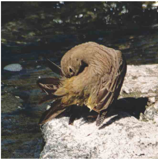
Mystery photograph IX (May)