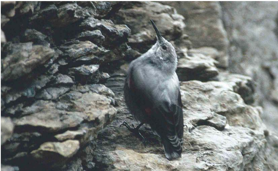
346 Wallcreeper / Rotskruiper Tichodroma muraria , first-winter, Port de Boucharo, Gavarnie, Hautes-Pyrénées, France, 4 September 1995

prominence by developing a special visual display of wings and tail. To extract more 'value' from the shining crimson colouration of its wings, birds characteristically 'flick' them rapidly, even when not creeping.