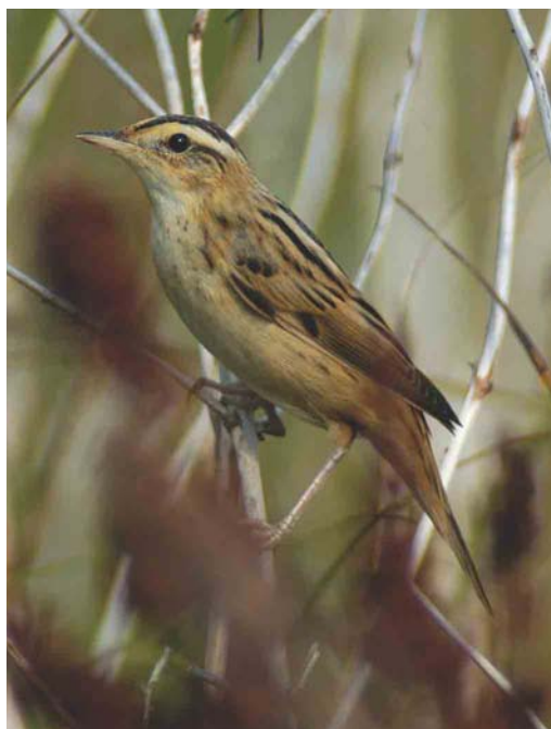
390 Ralreiger / Squacco Heron Ardeola ralloides , Oud-Alblas, Zuid-Holland, 9 juli 2003 ( Willem van Rijswijk ) 391 Waterrietzanger / Aquatic Warbler Acrocephalus paludicola , Bakkersdam, Noord-Holland, 12 augustus 2003 ( Marten van Dijk ) 392 Lachstern / Gull-billed Tern Gelocheidon nilotica , eerstejaars (links), met Kokmeeuw / Black-headed Gull Larus ridibundus en Kieviten / Northern Lapwings Vanellus vanellus , Burgervlotbrug, Noord-Holland, 12 augustus 2003 ( Marten van Dijk )