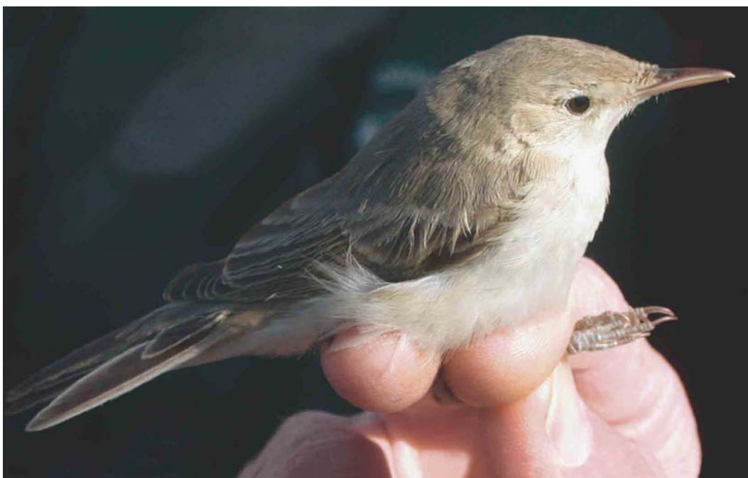
383 Eastern Olivaceous Warbler / Oostelijke Vale Spotvogel Acrocephalus pallidus elaeicus , Portland, Dorset, Engeland, 31 August 2003