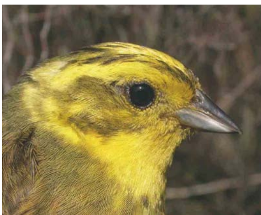
348-349 Hybrid Yellowhammer x Pine Bunting / hybride Geelgors x Witkopgors Emberiza citrinella x leucocephalos , adult male, Lussac-les-Châteaux, Vienne, France, 27 May 2002. The presence of rufous on the forehead and along the sub-moustachial stripe, and the pale yellowish head indicate the hybrid origin of this bird. Note also the very extensive rufous band on upper and lower chest, the pale yellowish central crown-stripe, the darkness of the lateral crown-stripe and the extent of the olive neck-patch. 350-352 Yellowhammers / Geelgorzen Emberiza citrinella , adult males, Lussac-les-Châteaux, Vienne, France, 2 May 2003. Three different males, trapped at the same site in the year following the capture of the hybrid.