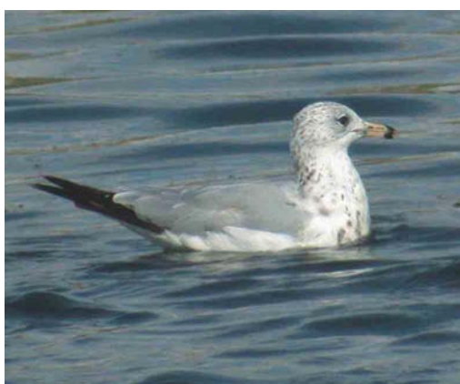
372 Grey-tailed Tattler / Grijze Ruiter Heteroscelus brevipes, Sebybadet, Öland, Sweden, 12 July 2003 373 Hudsonian Godwit / Rode Grutto Limosa haemastica, Väsby fjärd, Öland, Sweden, 19 June 2003 cf Dutch Birding 25: 263, 2003 374-375 Oriental Plover / Steppesplevier Charadrius veredus, adult, Ilmajoki Kahrakuusentie, Finland, 25 May 2003 cf Dutch Birding 25: 263, 2003 376 Great Snipe / Poelsnip Gallinago media, Kolansko blato, Pag island, Croatia, 1 May 2003 377 Ring-billed Gull / Ringsnavelmeeuw Larus delawarensis, Calais, Pas-de-Calais, France, 27 July 2003