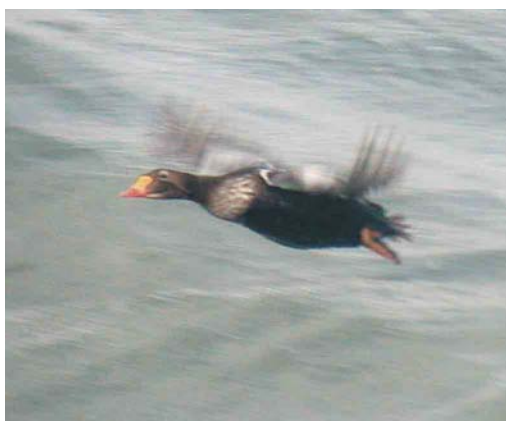
393-394 Steppenvorkstaartplevier / Black-winged Pratincole Glareola nordmanni , Burgervlotbrug, Noord-Holland, 12 augustus 2003 395 Forsters Stern / Forster's Tern Sterna forsteri , eerste-zomer, met Visdief / Common Tern S. hirundo , Colijnsplaat, Zeeland, 18 juli 2003 396 Koningseider / King Eider Somateria spectabilis , mannetje eclips, Scheveningen, Zuid-Holland, 31 augustus 2003

vogel die in mei-juni bij Zeebrugge, West-Vlaanderen, België, werd gezien. Witwangsterns Chlidonias hybrida werden waargenomen op 19 juli (twee) in de Oostvaardersplassen, op 24 en 25 juli in de Ezuma-keeg, op 27 juli in de Eemshaven, op 7 augustus langs Westhoek en op 17 augustus in de Makkumer-zuidwaard. Slechts een 15-tal Witvleugelsterns C. leucopterus werd gemeld, voornamelijk in het IJsselmeer-gebied.