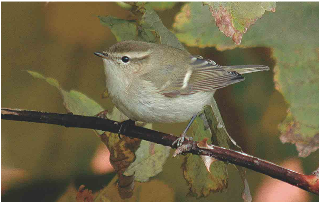
489 Hume's Leaf Warbler / Humes Bladkoning Phylloscopus humei , Gibraltar Point, Lincolnshire, England, 26 October 2003 ( Graham Catley )