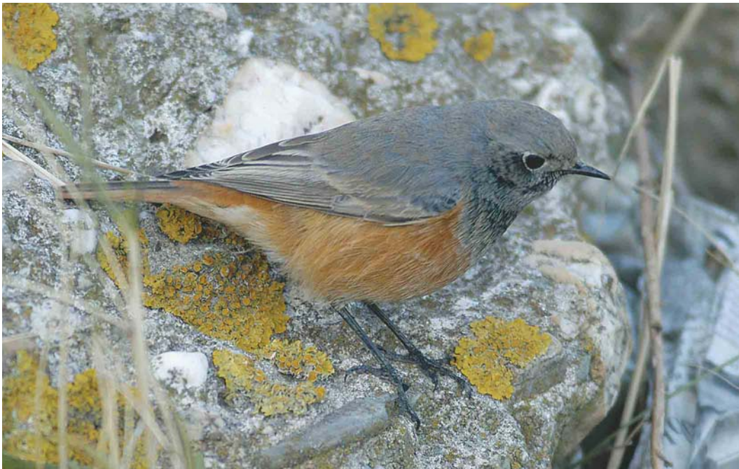
488 Eastern Black Redstart / Oosterse Zwarte Roodstaart Phoenicurus ochruros phoenicuroides , first-year male, IJmuiden, Noord-Holland, Netherlands, 23 October 2003