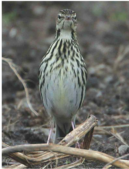
462 Alder Flycatcher / Elzenfeetiran Empidonax alnorum , Kverkin, Eyjafjöll, Iceland, 10 October 2003 463-464 Pechora Pipit / Petsjorapieper Anthus gustavi , Fair Isle, Shetland, Scotland, October 2003