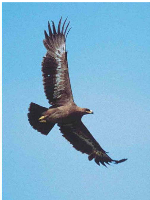
411 Steppe Eagle / Stepparend Aquila nipalensis , immature, Verdeek, Noord-Holland, 31 May 1998

This juvenile was only the third to be twitchable after the long-staying individuals in 1978-79 and 1980-81.