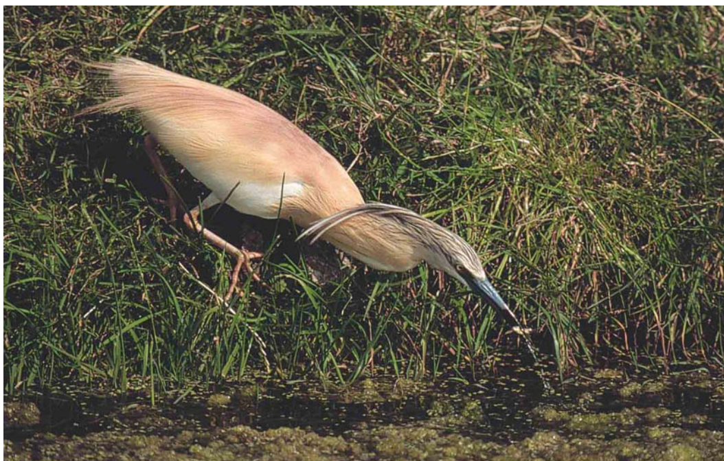
408 Squacco Heron / Ralreiger Ardeola ralloides , adult, Zuid-Schermer, Noord-Holland, 24 June 2002 (Harm Niesen)