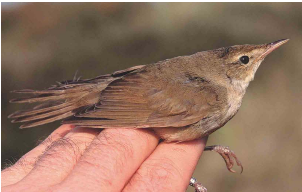
514 Struikrietzanger / Blyth's Reed Warbler Acrocephalus dumetorum , Castricum, Noord-Holland, 30 september 2003 (Arnold Wijker) 515 Roodoogvireo / Red-eyed Vireo Vireo olivaceus , Castricum, Noord-Holland, 22 oktober 2003 (Arnold Wijker) 516 Woudaap / Little Bittern Ixobrychus minutus , juveniel, Gullegem, West-Vlaanderen, augustus 2003 (Yves Baptiste) cf Dutch Birding 25: 351, 2003