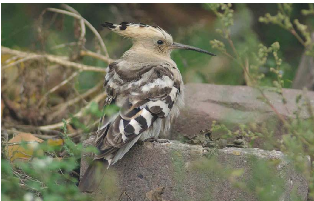
510 Hop / Eurasian Hoopoe Upupa epops , De Cocksdorp, Texel, Noord-Holland, 28 september 2003