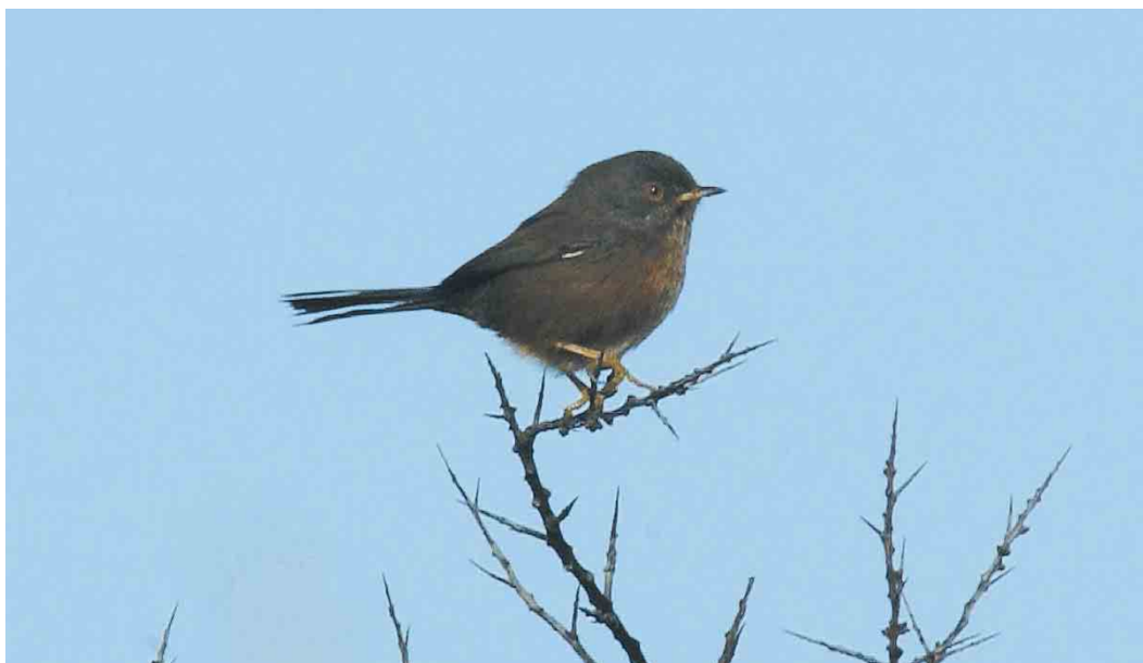
520 Provençaalse Grasmus / Dartford Warbler Sylvia undata , Texel, Noord-Holland, 13 oktober 2003

gesneld. In totaal c 50 vogelaars hebben de vogel tot in de middag kunnen bekijken, met als bonus een roepende Bladkoning Phylloscopus inornatus over de duinen waar de grasmus verbleef en twee Pallas' Boszangers P proregulus in de bosjes langs het wandelpad. De grasmus verbleef na de ontdekking meestal in enkele lage bosjes in de duinen maar liet zich later in de middag steeds minder frequent zien en uiteindelijk bleek een zoekactie zelfs negatief. Enkele dagen later, op 17 oktober, werd echter door Kees Roselaar wederom een Provençaalse Grasmus gezien in de Tuintjes, waarbij aangenomen mag worden dat dit hetzelfde exemplaar betrof. Het stiekeme gedrag van deze soort maakt het voorstelbaar dat een exemplaar dagenlang zoek is, zelfs op een door vogelaars veel bezochte locatie.