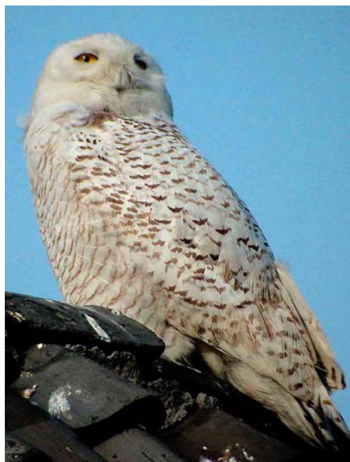
422-423 Snowy Owl / Sneeuwuil Nyctea scandiaca , first-winter male, Hippolytushoef, Noord-Holland, 19 April 2002