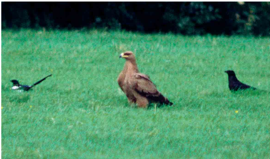
412 Steppe Eagle / Stepparend Aquila nipalensis , immature, with Eurasian Magpie / Ekster Pica pica and Carrion Crow / Zwarte Kraai Corvus corone , Verdeek, Noord-Holland, 31 May 1998