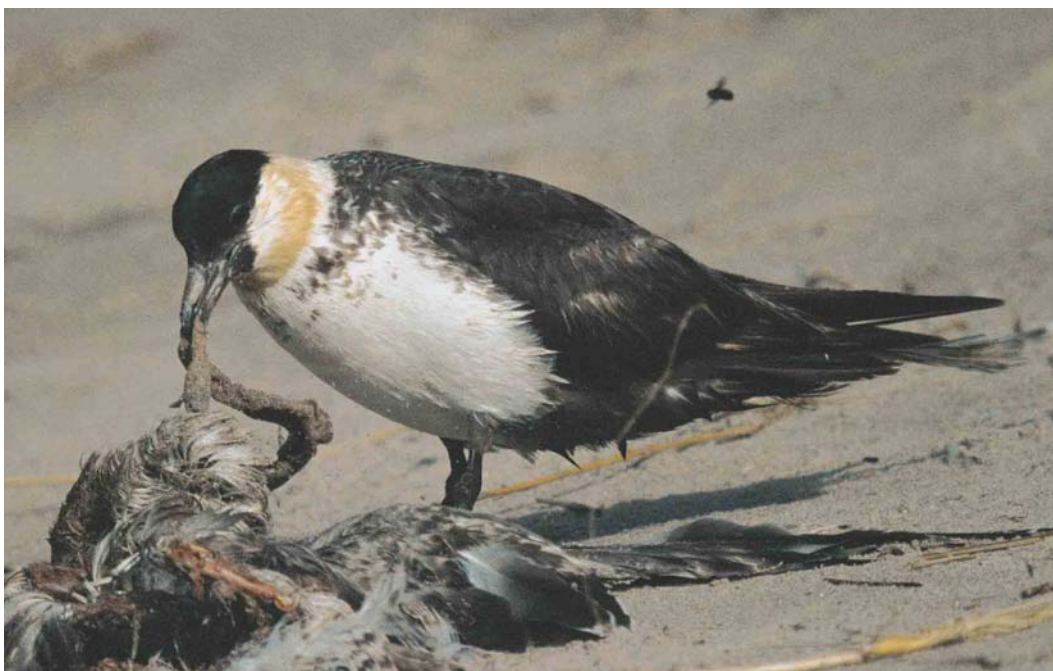
493 Middelste Jager / Pomarine Jaeger Stercorarius pomarinus , Brouwersdam, Zeeland, 10 oktober 2003 ( Vincent van der Spek )