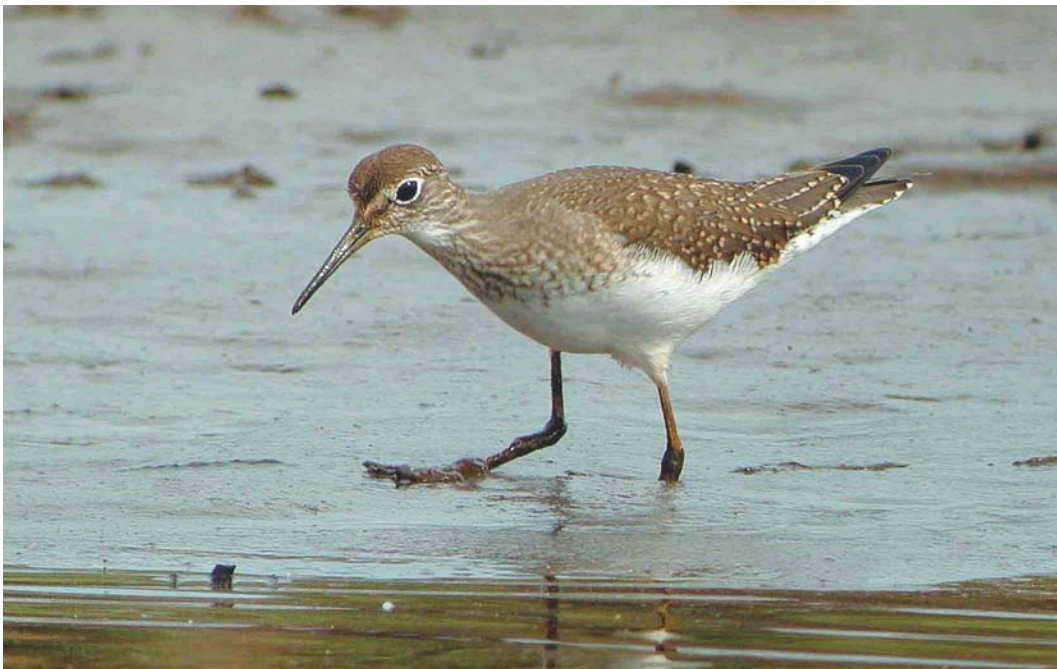
444 Solitary Sandpiper / Amerikaanse Bosruiter Tringa solitaria , Ouessant, Finistère, France, September 2003 (Aurélien Audevard)