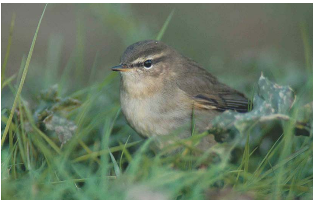
500 Bruine Boszanger / Dusky Warbler Phylloscopus fuscatus , Maasvlakte, Zuid-Holland, 24 oktober 2003