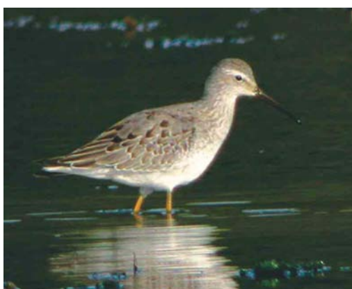
448 American Wigeon / Amerikaanse Smient Mareca americana , female or first-winter, Sete Cidades, Lagoa Azul, São Miguel, Azores, 31 October 2003 ( Kris De Rouck ) 449 Greenland White-fronted Goose / Groenlandse Kolgans Anser albifrons flavirostris , Ouessant, Finistère, France, 12 October 2003 ( Kris de Rouck ) 450 Cory's Shearwater / Kuhls Pijlstormvogel Calonectris borealis , Gdansk, Poland, 20 August 2003 ( P Zielinski ) 451 Crab Plovers / Krabplevieren Dromas ardeola , Hamata mangroves, Egypt, 17 September 2003 ( Kris De Rouck ) 452 Wilson's Phalarope / Grote Franjepoot Phalaropus tricolor , Kilcoole, Wicklow, Ireland, 3 October 2003 ( Paul Kelly ) 453 Stilt Sandpiper / Steltstrandloper Micropalama himantopus , Burnham Wood Lagoon, Dingle, Kerry, Ireland, 17 September 2003 ( Michael O'Keefe )