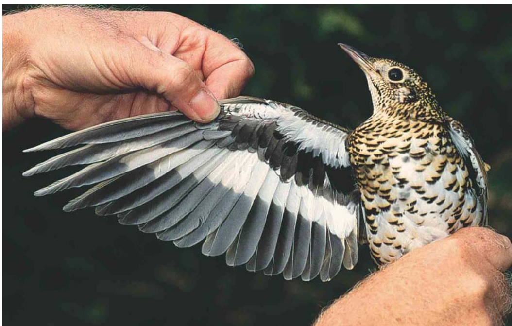
497 Goudlijster / White's Thrush Zosterorhiza aurea , Korverskooi, Texel, Noord-Holland, 10 oktober 2003 (Arend Wassink)