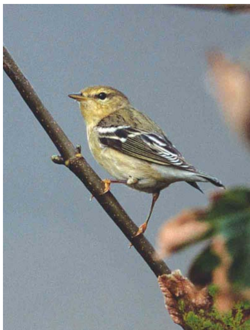
478 Black-throated Blue Warbler / Blauwe Zwartkeelzanger Dendroica caerulescens , adult female, Heimaey, Vestmannaeyjar, Iceland, 17 October 2003 ( Daniél Bergmann ) 479 Blackpoll Warbler / Zwartkopzanger Dendroica striata , Ouessant, Finistère, France, 14 October 2003 ( Arie Ouwerkerk ) 480 Black-throated Blue Warbler / Blauwe Zwartkeelzanger Dendroica caerulescens , adult female, Heimaey, Vestmannaeyjar, Iceland, 17 October 2003 ( Daniél Bergmann )