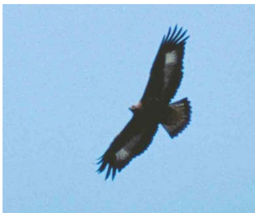
410 Golden Eagle / Steenarend Aquila chrysaetos , juvenile, Norg, Drenthe, 11 March 2002 (Marten van Dijk)

Fochteloërveen, Drenthe/Friesland, and Hoge Veluwe, Gelderland, prove to be very attractive sites for this species. At Hoge Veluwe, there were records in 1996 (two) and 1997 (one), involving at least two birds, while at Fochteloërveen the species was recorded in 2001 (two)