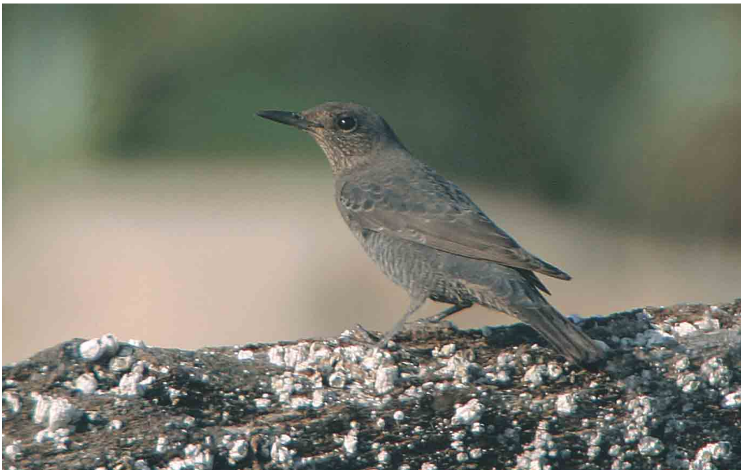
496 Blauwe Rotslijster / Blue Rock Thrush Monticola solitarius , Westkapelle, Zeeland, 20 september 2003 (Bas van den Boogaard)