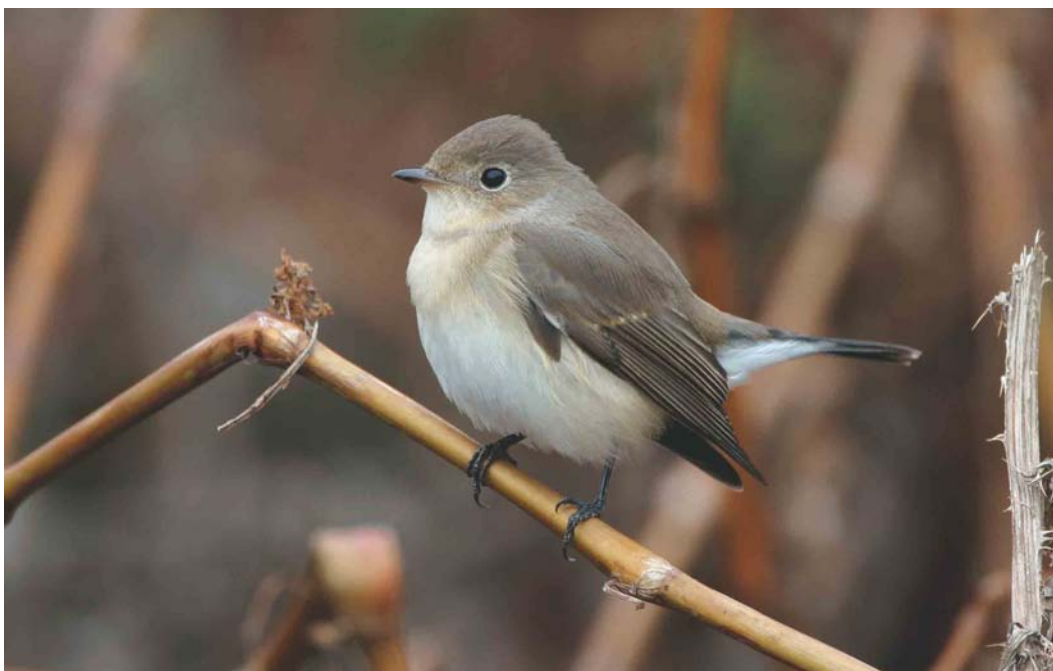
509 Kleine Vliegenvanger / Red-breasted Flycatcher Ficedula parva , eerstejaars, Maasvlakte, Zuid-Holland, 1 oktober 2003