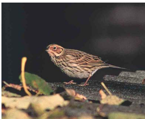
503 Struikrietzanger / Blyth's Reed Warbler Acrocephalus dumetorum , Stortemelk, Vlieland, Friesland, 30 september 2003 504 Provençaalse Grasmus / Dartford Warbler Sylvia undata , Texel, Noord-Holland, 13 oktober 2003 505 Veldrietzanger / Paddyfield Warbler Acrocephalus paludicola , Groene Glop, Schiermonnikoog, Friesland, 6 september 2003 506 Humes Bladkoning / Hume's Leaf Warbler Phylloscopus humei , Kroonspolders, Vlieland, Friesland, 22 oktober 2003 507 Groenlandse Witstuitbarmsijs / Hornemann's Redpoll Carduelis hornemanni hornemanni , Huisduinen, Noord-Holland, 15 oktober 2003 508 Dwerggors / Little Bunting Emberiza pusilla , Groningen, Groningen, 26 oktober 2003