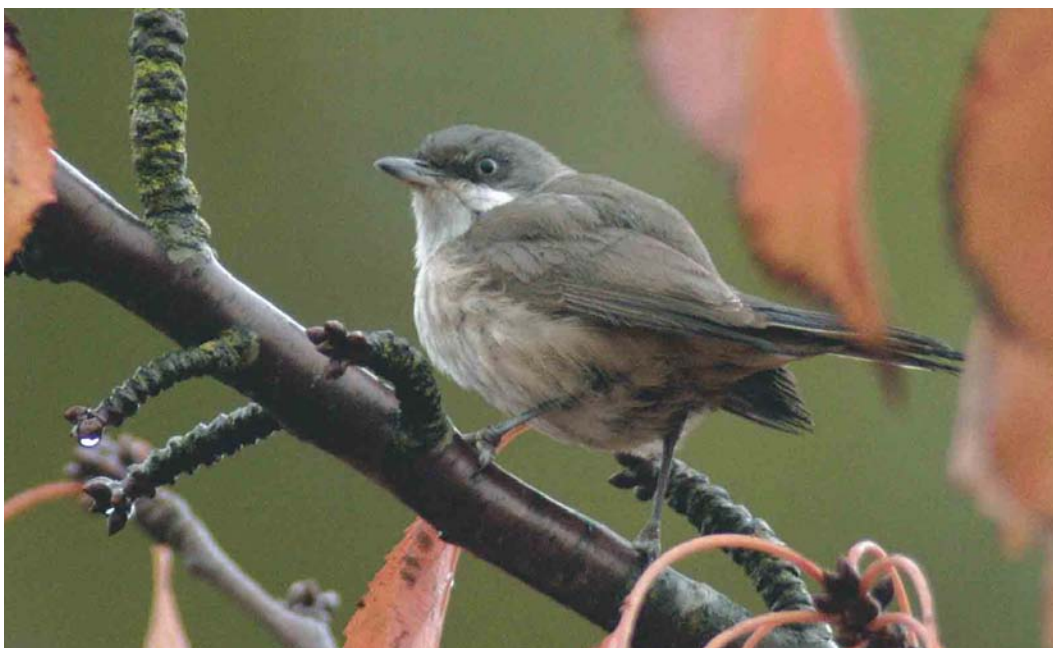
522 Vermoedelijke Westelijke Orpheusgrasmus / presumed Western Orphean Warbler Sylvia hortensis , Middelburg, Zeeland, 30 oktober 2003

mannetje gevangen. Dit exemplaar overleefde nog drie weken in een kooi, waarna het werd opgezet. Op basis van de in 1913 gepubliceerde foto lijkt het om een Westelijke Orpheusgrasmus te gaan. In Brittannië zijn zes gevallen bekend: één in mei, één in juli en vier tussen 20 september en 22 oktober, waarvan slechts één twitchbaar (op Scilly, Engeland, in oktober 1981). In Duitsland werd op 1 september 1964 een adult vrouwtje gevangen op Helgoland, Schleswig-Holstein, en werden opmerkelijk genoeg van 19 juli tot 13 augustus 2003 twee zingende mannetjes Westelijke Orpheusgrasmus waargenomen in Baden-Württemberg (Dutch Birding 25: 343, 2003).