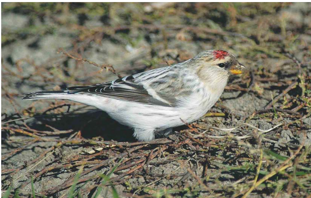
519 Groenlandse Witstuitbarmsijs / Hornemann's Redpoll Carduelis hornemanni hornemanni , Huisduinen, Noord-Holland, 15 oktober 2003