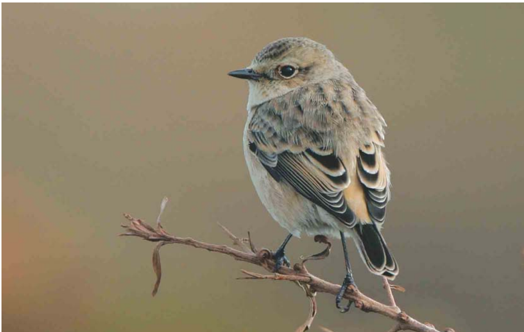
469 Siberian Stonechat / Aziatische Roodborstapuit Saxicola maura , Helgoland, Schleswig-Holstein, Germany, 17 October 2003 ( Bas van den Boogaard )