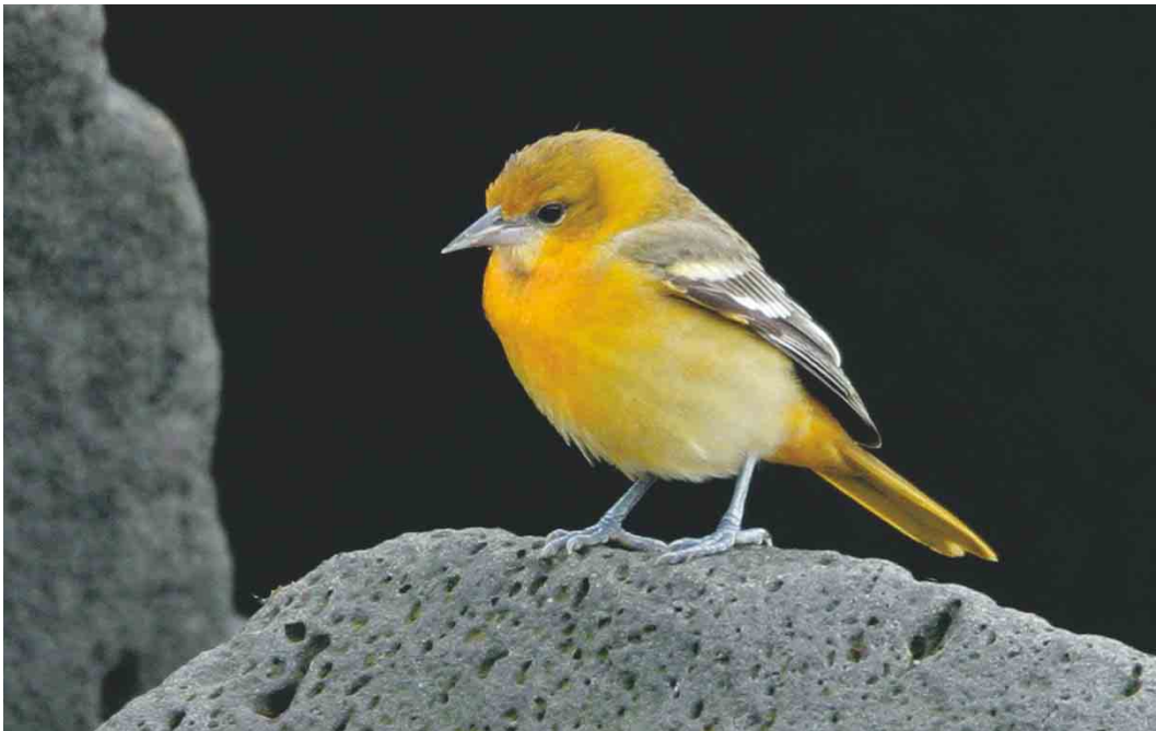
483 Baltimore Oriole / Baltimoretroepiaal Icterus galbula , first-year male, Eyrarbakki, Iceland, 8 October 2003