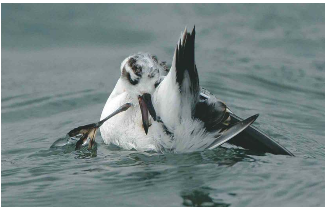
494 Rosse Franjepoot / Red Phalarope Phalaropus fulicarius , Brouwersdam, Zeeland, 11 oktober 2003