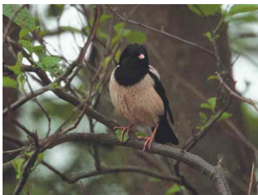
437 Roze Spreeuw / Rose-coloured Starling Sturnus roseus , adult, Lies, Terschelling, Friesland, 3 juni 2002

plaatsing in noordwestelijke richting die vaak pas aan kusten stopte. In dat licht bezien is de eerste waarneming van een Roze Spreeuw voor Zuid-Korea, een juveniele op het eiland Eocheong op 1 september 2002, opmerkelijk (Moores 2002) en een aanwijzing dat dispersie in meerdere richtingen plaats kan vinden.