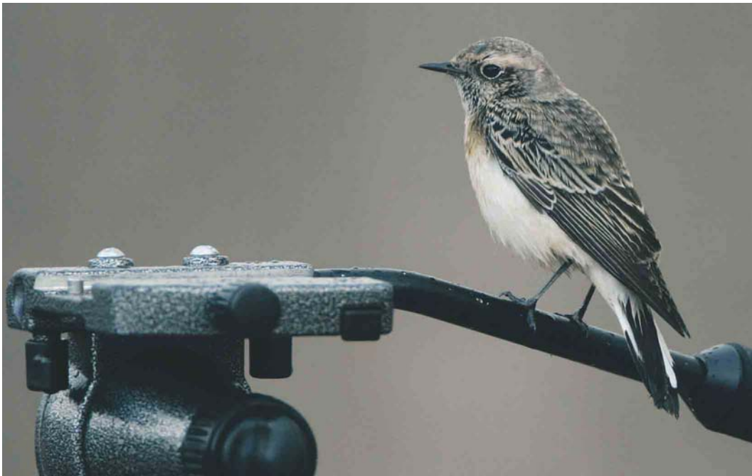
468 Pied Wheatear / Bonte Tapuit Oenanthe pleschanka , Helgoland, Schleswig-Holstein, Germany, 19 October 2003