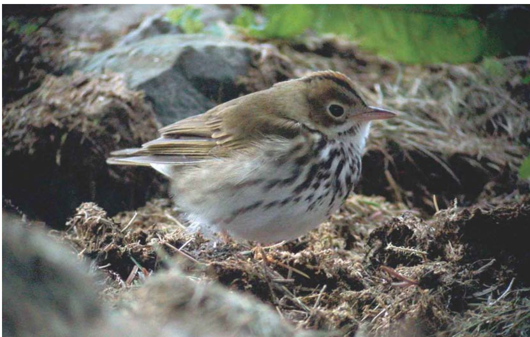
481 Ovenbird / Ovenvogel Seiurus auricapilla , Beiningen, Karmøy, Rogaland, Norway, 26 October 2003 (Andreas Gullberg)