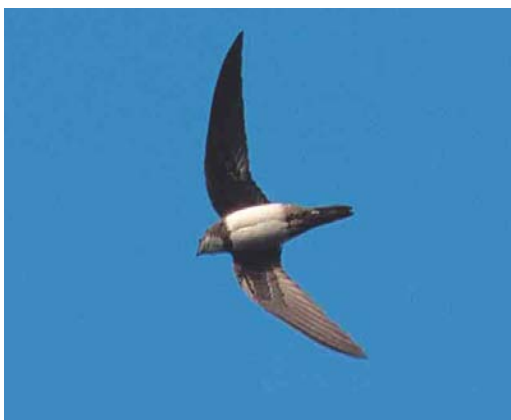
424 Alpine Swift / Alpengierzwaluw Apus melba , first-winter, Wageningen, Gelderland, 17 November 2002 (Bas van den Boogaard)

The autumn bird was released near Zürich in Switzerland in June 2003. It was only the second ever staying longer than a few hours. The first 'long-staying' bird was on 28-29 October 1987. A report on 7 September at Ooltgensplaat, Zeeland, is still in circulation, while a report on 20 September on Terschelling, Friesland, has not (yet) been submitted (cf van Dongen et al 2002).