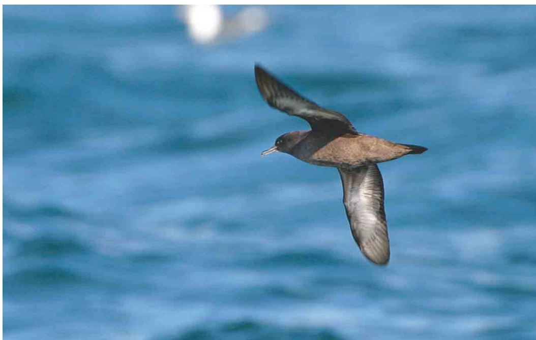
492 Grauwe Pijlstormvogel / Sooty Shearwater Puffinus griseus , Noordzee ten noorden van Ameland, Continentaal Plat, 21 september 2003 ( Bas van den Boogaard )