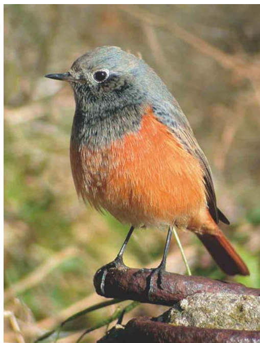
511 Roze Spreeuw / Rose-coloured Starling Sturnus roseus , juveniel, met Spreeuwen / Common Starlings S vulgaris , IJmuiden, Noord-Holland, 17 september 2003 512 Oosterse Zwarte Roodstaart / Eastern Black Redstart Phoenicurus ochruros phoenicuroides , eerstejaars mannetje, IJmuiden, Noord-Holland, 23 oktober 2003 513 Roze Spreeuw / Rose-coloured Starling Sturnus roseus , juveniel, 't Horntje, Texel, Noord-Holland, 16 oktober 2003