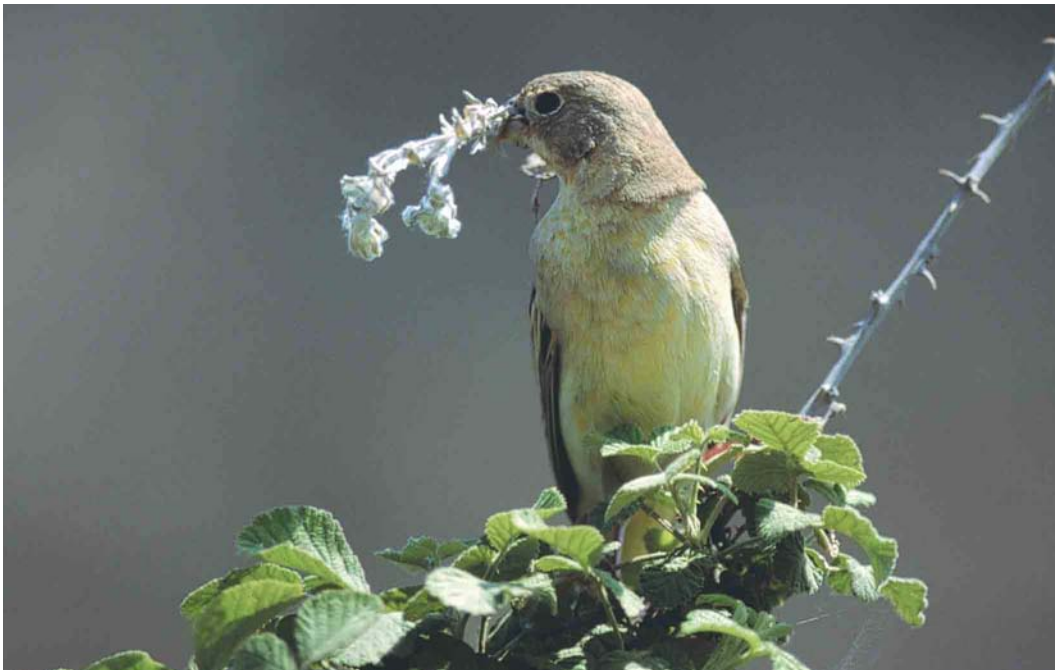
440 Black-headed Bunting / Zwartkopgors Emberiza melanocephala , female, Lesvos, Greece, April 2001

Red-headed these are more buffish. The feathers of the mystery bird are a few months old and most are buffish, but note that the median coverts show almost white fringes, which is again in favour for Black-headed. In all plumages, there is a slight difference between both species in primary projection. In Red-headed, this is c 60%, with four to five visible primary tips. In Black-headed, the primary projection is c 70%, with five to six visible primary tips. Although it is hard to judge from the mystery photograph, there are five and maybe even six visible primary tips, indicating Black-headed. The absence of white in the tail supports the identification as Black-headed, which probably never shows white in the tail, while Red-headed may show some white, albeit rarely.