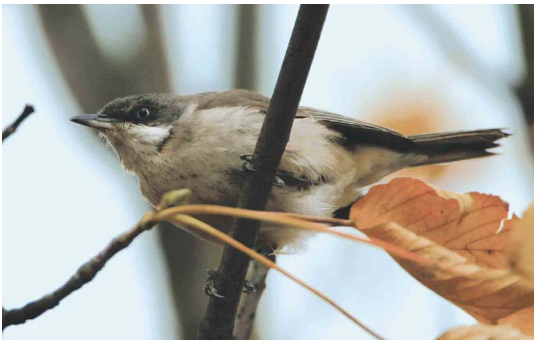
490 Presumed Western Orphean Warbler / vermoedelijke Westelijke Orpheusgrasmus Sylvia hortensis , Middelburg, Zeeland, Netherlands, 30 October 2003 (Bas van den Boogaard)