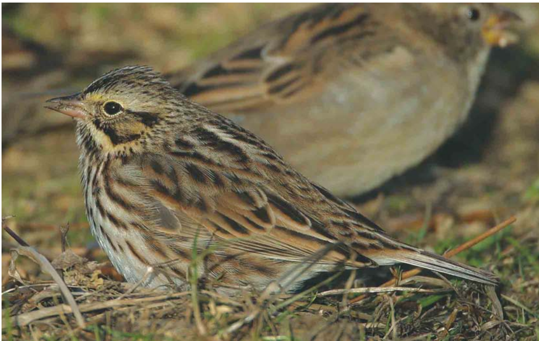
484 Savannah Sparrow / Savannahgors Passerculus sandwichensis , Fair Isle, Shetland, Scotland, October 2003