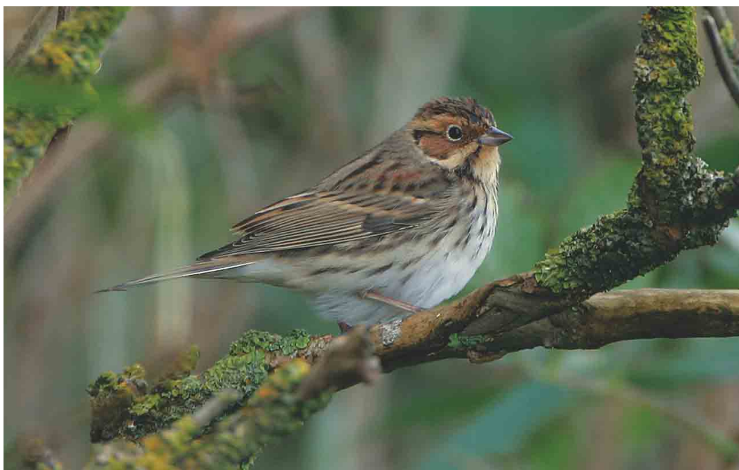
502 Dwerggors / Little Bunting Emberiza pusilla , Texel, Noord-Holland, 5 oktober 2003 (Bas van den Boogaard)