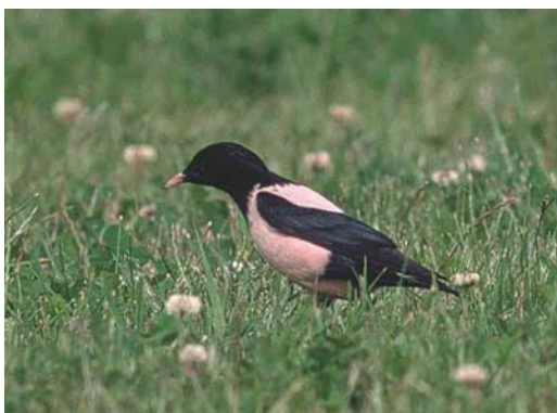
436 Roze Spreeuw / Rose-coloured Starling Sturnus roseus , adult, Eemshaven, Groningen, 14 juni 2002 (Eric Koops)