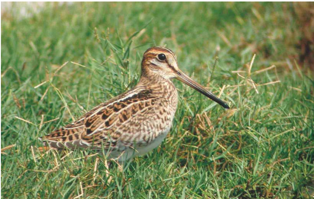
447 Probable Pintail Snipe / waarschijnlijke Stekelstaartsnip Gallinago stenura , Kfar Ruppim, Israel, September 2003