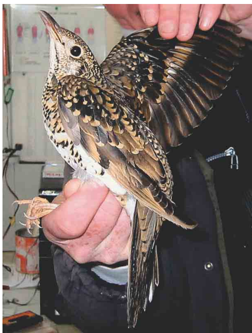
465 Taiga Flycatcher / Taigavliegenvanger Ficedula albicilla , first-year, Dales Lea, Shetland, Scotland, October 2003 466 White's Thrush / Goudlijster Zoothera aurea , Korverskooi, Texel, Noord-Holland, Netherlands, 10 October 2003 467 Grey-cheeked Thrush / Grijswangdwerglijster Catharus minimus (right), with Song Thrush / Zanglijster Turdus philomelos , Tresco, Scilly, England, October 2003