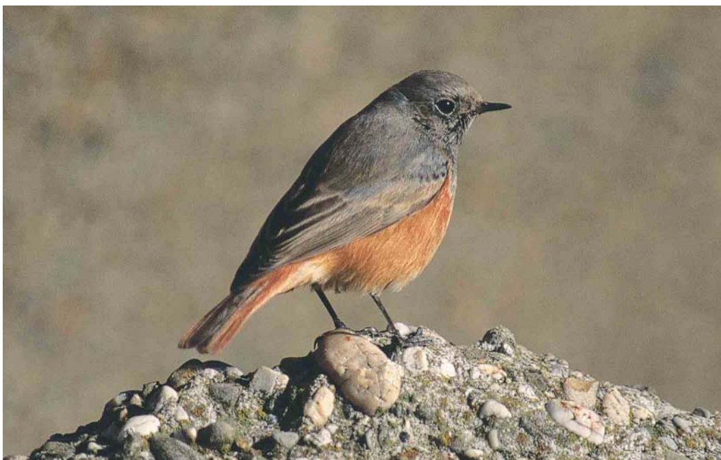
521 Oosterse Zwarte Roodstaart / Eastern Black Redstart Phoenicurus ochruros phoenicuroides , eerstejaars mannetje, IJmuiden, Noord-Holland, 23 oktober 2003 (Harm Niesen)