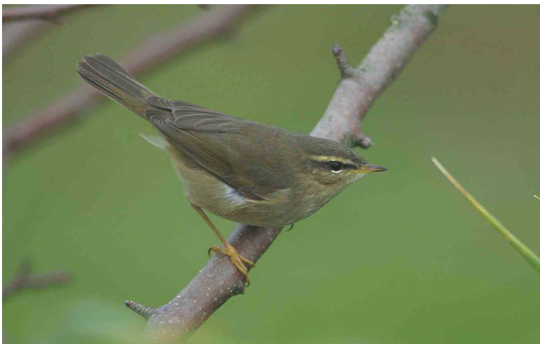
499 Bruine Boszanger / Dusky Warbler Phylloscopus fuscatus , Driel, Gelderland, 26 oktober 2003