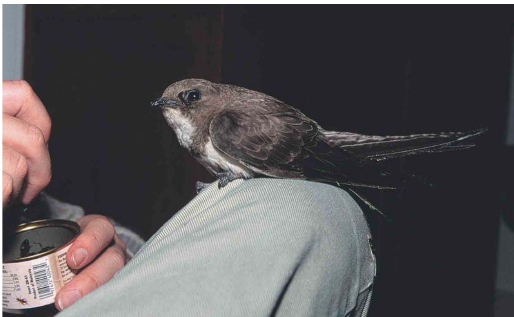
425 Alpine Swift / Alpengierzwaluw Apus melba , first-winter (taken into care at Wageningen, Gelderland, on 4 December 2002), Bennekom, Gelderland, 5 January 2003 (Marten van Dijl)