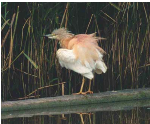
409 Squacco Heron / Ralreiger Ardeola ralloides , adult, Piershil, Zuid-Holland, 23 July 2002