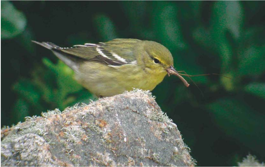
476 Blackpoll Warbler / Zwartkopzanger Dendroica striata , Ouessant, Finistère, France, October 2003