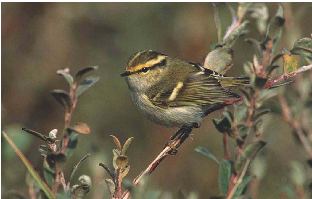
501 Pallas' Boszanger / Pallas's Leaf Warbler Phylloscopus proregulus , De Cocksdorp, Texel, Noord-Holland, 13 oktober 2003