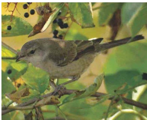
518 Sperwergrasmus / Barred Warbler Sylvia nisoria , Heist, West-Vlaanderen, 16 september 2003 (Koen Verbanck)

7 september over Kortrijk, West-Vlaanderen; op 11 september werden er drie waargenomen in Tienen, Vlaams-Brabant, op 22 september één in Gentbrugge, Oost-Vlaanderen, en op 25 september acht in Turnhout, Antwerpen. De laatste Zwarte Ooievaars Ciconia nigra werden gezien in Lier op 6 september (juвениel); in Torgny, Luxembourg, op 7 september; in Chaumont-Gistoux, Brabant-Wallon, zes op 13 september; en in Knokke op 13 september. Op 20 oktober pleisterde een groep van 18 Ooievaars C. ciconia in Berendrecht, Antwerpen.