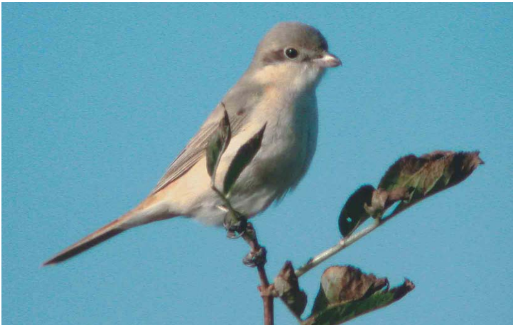
495 Daurische Klauwier / Daurian Shrike Lanius isabellinus , Texel, Noord-Holland, 25 september 2003