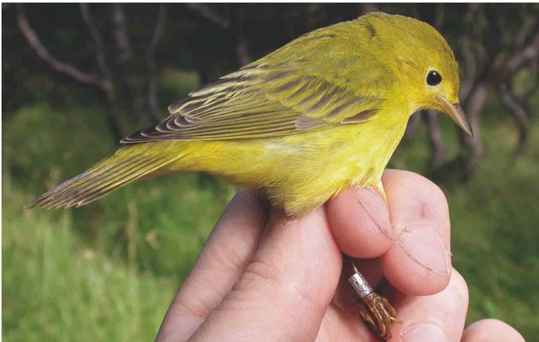
477 Yellow Warbler / Gele Zanger Dendroica petechia , Thorbjörn, Grindavík, Iceland, 12 September 2003