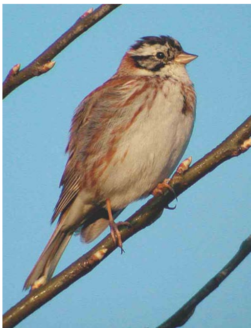
432 Rustic Bunting / Bosgors Emberiza rustica , male, De Kennemerduinen, Noord-Holland, April 2002 (Leo J R Boon/Cursorius)

ed, videoed (H Groot, A B van den Berg, R Slaterus et al; Birding World 15: 151, 2002, Dutch Birding 24: 185, plate 166, 186, plate 167, 2002). 1994 21 October, IJmuiden, Velsen , Noord-Holland (L B Steijn).