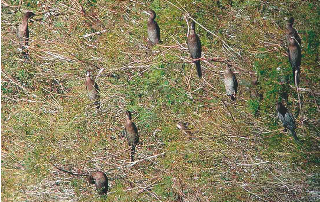
445 Pygmy Cormorants / Dwergaalscholvers Microcarbo pygmeus , Po delta, Italy, 29 September 2003

ber and 30 October, respectively. Between 15 August and 11 October, five Cory's Shearwaters Calonectris borealis were seen off southern Sweden. The first for Estonia was at Rista on 18 August. The third for Poland stayed for two hours at c 75 m distance at the Wisla river mouth, Bay of Gdansk, on 20 August. On 7-11 October, there were six sightings off north-western Germany. On 8 October, one was seen off Texel, Noord-Holland, the Netherlands. The first Sooty Shearwater Puffinus griseus for Switzerland was flying over Bodensee at Triboltingen on 8 October and was mostly seen on the German side of the lake. A record 1400 Pygmy Cormorants Microcarbo pygmeus were counted at a single nocturnal roost in the Po delta in the northern inner lagoons south of Venice, Italy, on 25 September (there are also one or two roosts north of Venice). The first successful breeding of Sacred Ibis Threskiornis aethiopicus for the Netherlands occurred in Utrecht this summer (semi-wild populations have been established in France since 1991). Three individuals of a group of 10 juvenile Eurasian Spoonbills Platalea leucorodia on Corvo, Azores, from 8 October had been colour-ringed in the Netherlands in 2003 on 18 May (female) and 7 June (male) on Schiermonnikoog, Friesland, and on 13 June (female) at Markiezaat, Noord-Brabant; on 10 October, the flock had moved to Flores where five were found dead on 20 October (including the colour-ringed male).