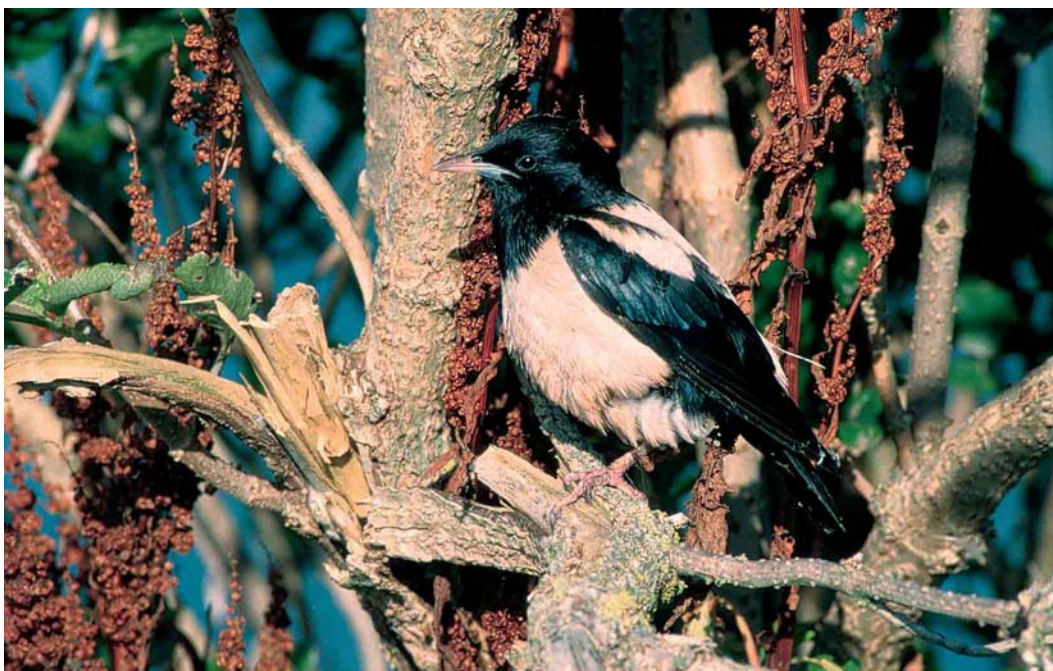
435 Roze Spreeuw / Rose-coloured Starling Sturnus roseus , adult, Koarnwertersân, Friesland, augustus 2002 (Roef Mulder)