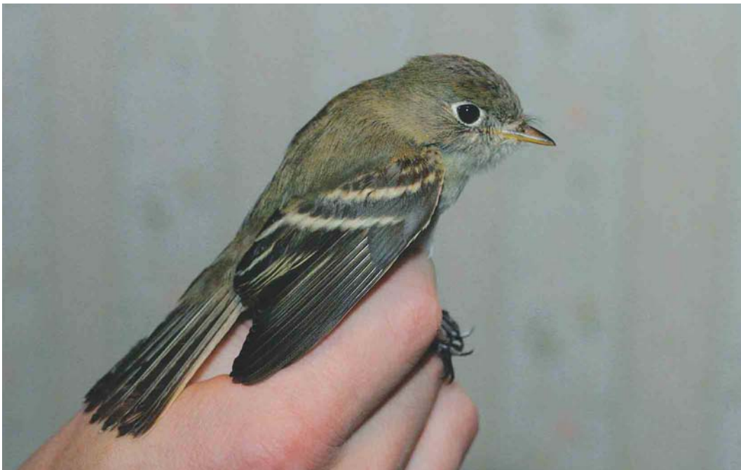
461 Least Flycatcher / Kleine Feetiran Empidonax minimus , Stokkseyri, Iceland, 6 October 2003 (Jóhann Óli Hilmarsson)