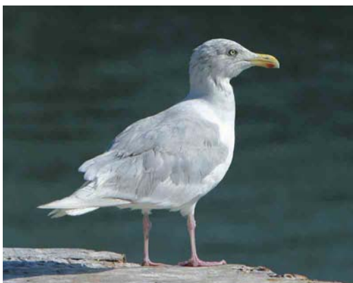
517 Grote Burgemeester / Glaucous Gull Larus hyperboreus , Oostende, West-Vlaanderen, 18 september 2003 (Roland François)