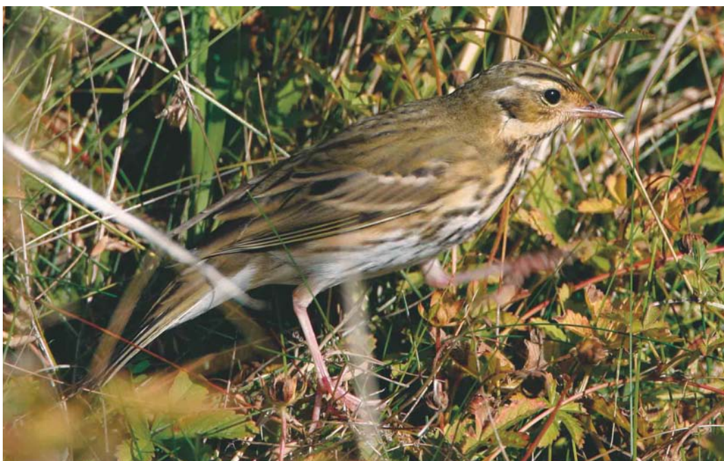
482 Olive-backed Pipit / Siberische Boompieper Anthus hodgsoni , Helgoland, Schleswig-Holstein, Germany, 17 October 2003 (Bas van den Boogaard)