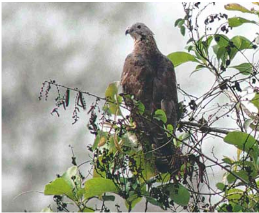
441 Crested Honey Buzzard / Aziatische Wespandief Pernis ptilorhyncus , adult male, Goa, India, March 2002

dered by a dark line, can be seen. Sometimes, as in this bird, a central throat-line is present, too. A feature that supports the sexing as a male is the grey head with a dark eye (females show a pale iris). The blue cere supports the ageing as an adult.