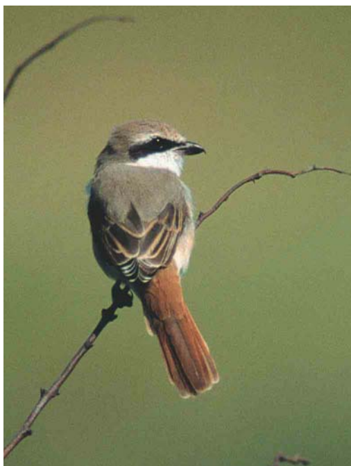
428 Roodkopklauwier / Woodchat Shrike Lanius senator , Katwijk, Zuid-Holland, 16 May 2002 429 Turkestan Shrike / Turkestaanse Klauwier Lanius phoenicuroides , adult male, Bleekersvallei, Texel, Noord-Holland, 23 August 2002 430 Turkestan Shrike / Turkestaanse Klauwier Lanius phoeni- curoides , adult male, Bleekersvallei, Texel, Noord-Holland, 14 August 2002