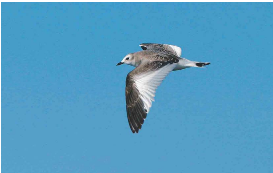
491 Vorkstaartmeeuw / Sabine's Gull Larus sabini , juveniel, Noordzee ten noorden van Ameland, Continentaal Plat, 21 september 2003