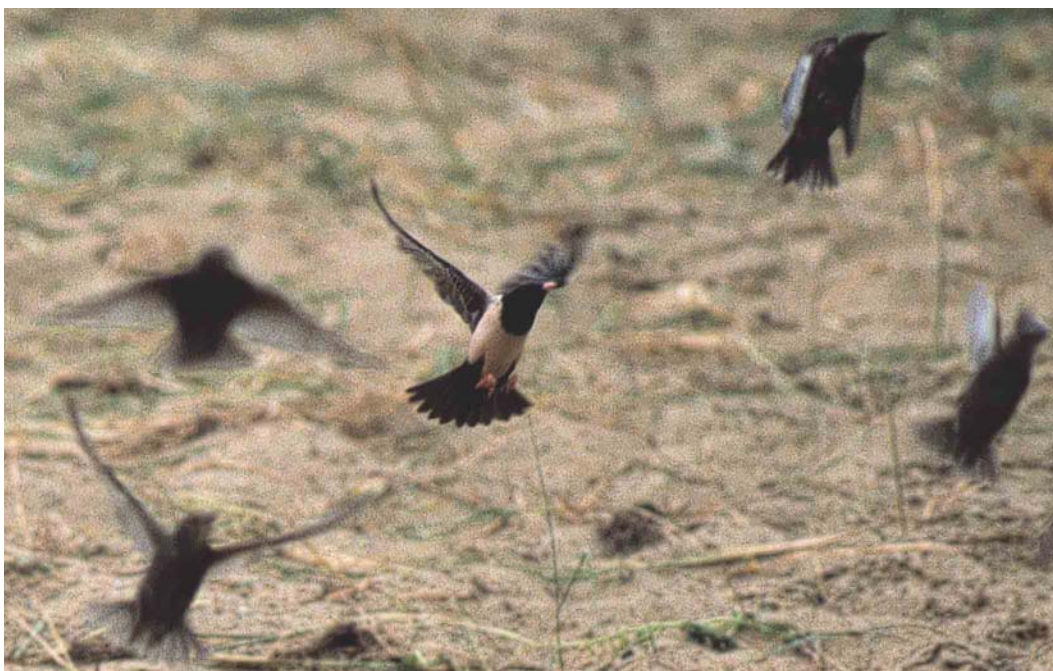
434 Roze Spreeuw / Rose-coloured Starling Sturnus roseus , adult, met Spreeuwen / Common Starlings S vulgaris , Katwijk aan Zee, Zuid-Holland, 5 juni 2002 (René van Rossum)