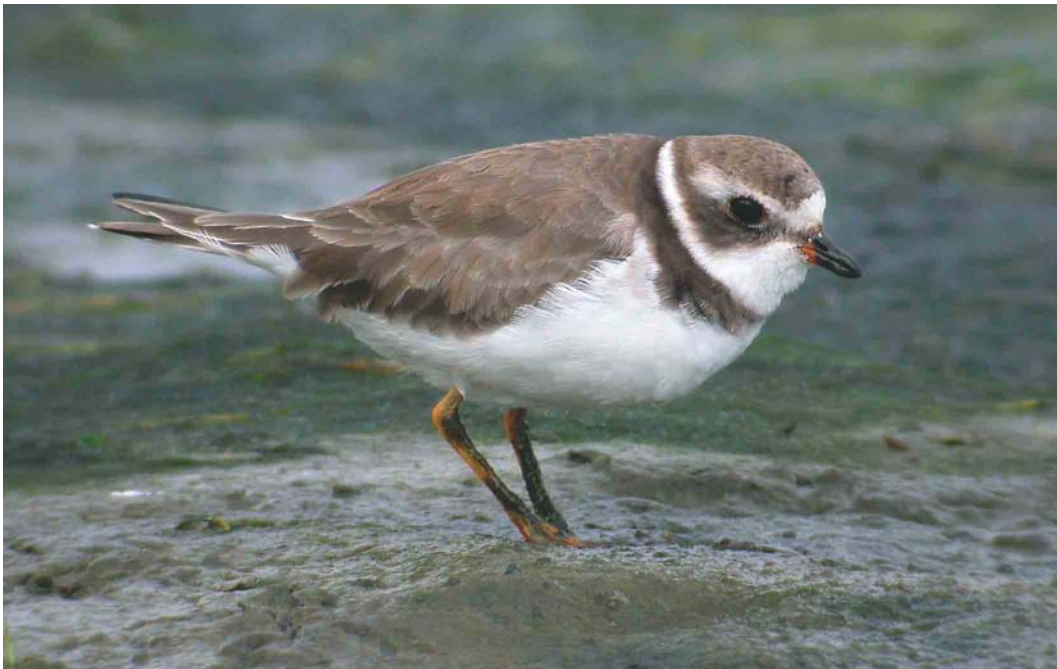
443 Semipalmated Plover / Amerikaanse Bontbekplevier Charadrius semipalmatus , Terceira, Azores, 27 October 2003 (Kris De Rouck)