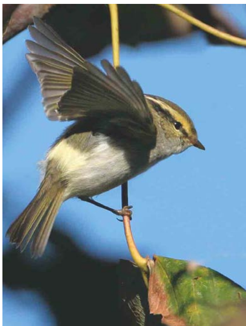
485 Booted Warbler / Kleine Spotvogel Acrocephalus caligatus , Quendale, Shetland, Scotland, September 2003 (Hugh Harrop/Shetland Wildlife) 486 Pallas's Leaf Warbler / Pallas' Boszanger Phylloscopus proregulus , Southwold, Suffolk, England, 25 October 2003 (Bill Baston) 487 Lanceolated Warbler / Kleine Sprinkhaanzanger Locustella lanceolata , Fair Isle, Shetland, Scotland, September 2003 (Hugh Harrop/Shetland Wildlife)