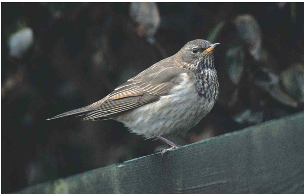
426 Black-throated Thrush / Zwartkeellijster Turdus ruficollis atrogularis , first-winter male, Harlingen, Friesland, 24 December 2002 (Marten van Dijl)