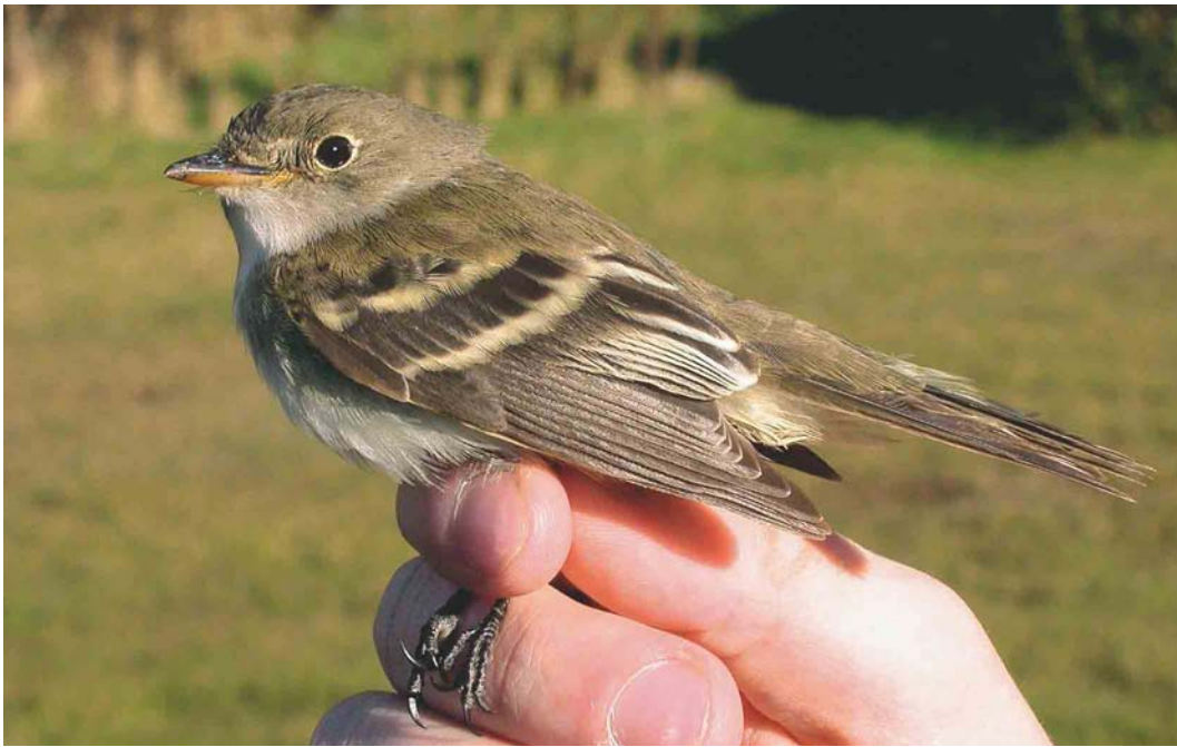
460 Alder Flycatcher / Elzenfeetiran Empidonax alnorum , Kverkin, Eyjafjöll, Iceland, 10 October 2003 (Daniél Bergmann)