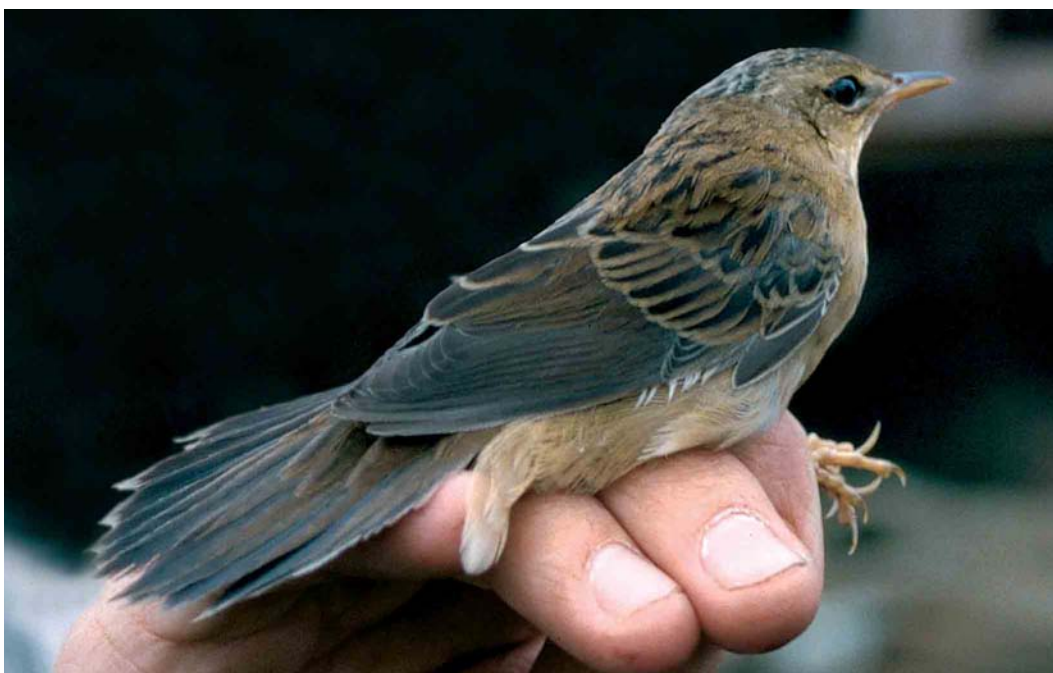
427 Pallas's Grasshopper Warbler / Siberische Sprinkhaanzanger Locustella certhiola , first-winter, Castricum, Noord-Holland, 21 September 2002