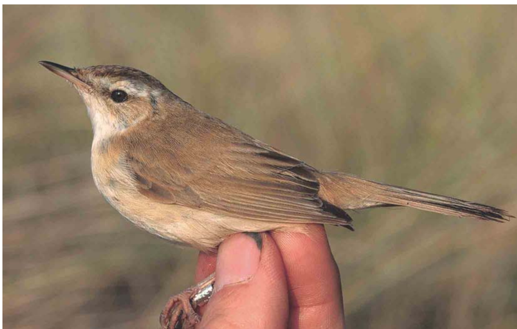
498 Veldrietzanger / Paddyfield Warbler Acrocephalus paludicola , adult, Castricum, Noord-Holland, 2 oktober 2003 (Arnold Wijker)