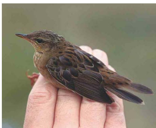
454 White-headed Duck / Witkopeend Oxyura leucocephala , first-winter, Rieselfelder Münster, Nordrhein-Westfalen, Germany, 24 September 2003 455 Steppe Eagle / Steppearend Aquila nipalensis , Falsterbo, Skåne, Sweden, 13 October 2003 456 American Golden Plover / Amerikaanse Goudplevier Pluvialis dominica , Swords Estuary, Dublin, Ireland, 19 September 2003 457 American Golden Plover / Amerikaanse Goudplevier Pluvialis dominica , Sandwick, Shetland, Scotland, September 2003 458 Short-billed Dowitcher / Kleine Grijsze Snip Limnodromus griseus , Terceira, Azores, 26 October 2003 459 Pallas's Grasshopper Warbler / Siberische Sprinkhaanzanger Locustella certhiola , Castricum, Noord-Holland, Netherlands, 12 September 2003