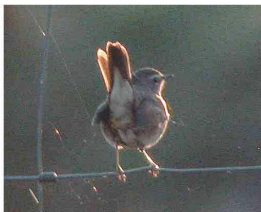
470 Booted Warbler / Kleine Spotvogel Acrocephalus caligatus , Tory Island, Donegal, Ireland, 27 September 2003 (Paul Kelly) 471 Steppe Grey Shrike / Steppeklapekster Lanius pallidirostris , Kfar Ruppim, Israel, 3 October 2003 (James P Smith) 472 Cedar Waxwing / Cederpestvogel Bombycilla cedrorum , Heimaey island, Vestmannaeyjar, Iceland, 8 October 2003 (Yann Kolbeinsson) 473 Common Yellowthroat / Maskerzanger Geothlypis trichas , Loop Head, Clare, Ireland, 4 October 2003 (Paul Kelly) 474 Siberian Rubythroat / Roodkeelnachtegaal Luscinia calliope , Fair Isle, Shetland, Scotland, October 2003 (Hugh Harrop/Shetland Wildlife) 475 Siberian Rubythroat / Roodkeelnachtegaal Luscinia calliope , Fair Isle, Shetland, Scotland, 17 October 2003 (Chris Batty)