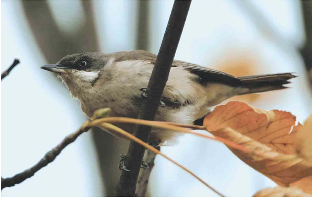
490 Presumed Western Orphean Warbler / vermoedelijke Westelijke Orpheusgrasmus Sylvia hortensis , Middelburg, Zeeland, Netherlands, 30 October 2003 (Bas van den Boogaard)