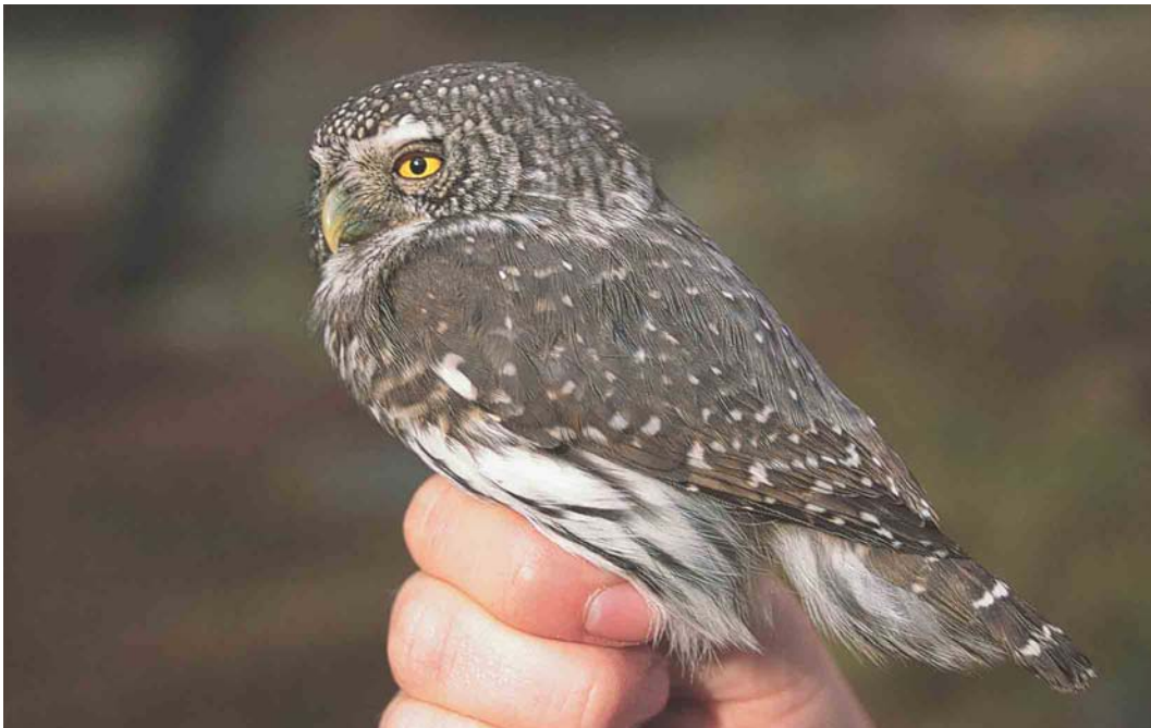
446 Eurasian Pygmy Owl / Dwerguil Glaucidium passerinum , Sūkajoki, Finland, 1 October 2003