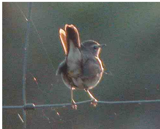
470 Booted Warbler / Kleine Spotvogel Acrocephalus caligatus , Tory Island, Donegal, Ireland, 27 September 2003 (Paul Kelly) 471 Steppe Grey Shrike / Steppeklapekster Lanius pallidirostris , Kfar Ruppim, Israel, 3 October 2003 (James P Smith) 472 Cedar Waxwing / Cederpestvogel Bombycilla cedrorum , Heimaey island, Vestmannaeyjar, Iceland, 8 October 2003 (Yann Kolbeinsson) 473 Common Yellowthroat / Maskerzanger Geothlypis trichas , Loop Head, Clare, Ireland, 4 October 2003 (Paul Kelly) 474 Siberian Rubythroat / Roodkeelnachtegaal Luscinia calliope , Fair Isle, Shetland, Scotland, October 2003 (Hugh Harrop/Shetland Wildlife) 475 Siberian Rubythroat / Roodkeelnachtegaal Luscinia calliope , Fair Isle, Shetland, Scotland, 17 October 2003 (Chris Batty)