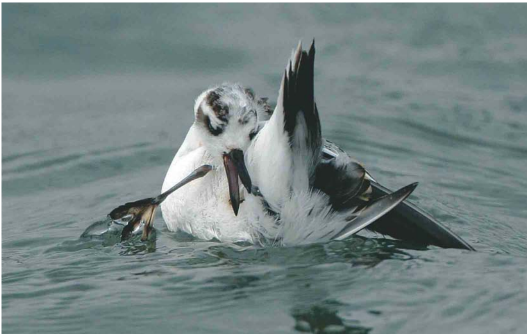
494 Rosse Franjepoot / Red Phalarope Phalaropus fulicarius , Brouwersdam, Zeeland, 11 oktober 2003 ( Bas van den Boogaard )