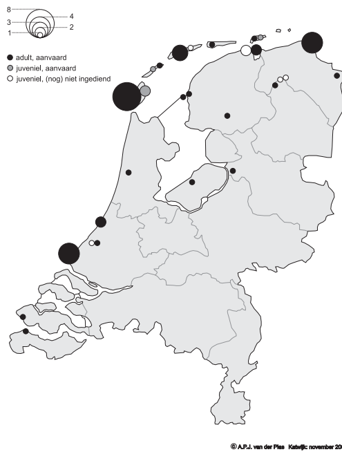
FIGUUR 1 Verspreiding van Roze Spreeuwen Sturnus roseus in Nederland in 2002 / Distribution of Rose-coloured Starlings in the Netherlands in 2002

schieters' vanuit de wintergebieden, zowel adulte als eerste-zomer vogels; 2 in juli en augustus vindt dispersie plaats vanuit de (Oost-Europese) broedgebieden; hierbij gaat het om adulte en juveniele vogels; 3 van eind augustus tot en met september (soms oktober) trekken de vogels naar de overwinteringsgebieden; waarnemingen in West-Europa hebben dan meestal betrekking op juveniele vogels. Deze dispersie en trek vinden overigens gescheiden per leeftijdsgroep plaats, waarbij de adulte beduidend eerder wegtrekken dan de juveniele (Feare & Craig 1999). Figuur 2 geeft het verloop van de invasie in de periode juni-oktober 2002 per decade weer. Hieruit blijkt dat het patroon voor een belangrijk deel overeenkomt met bovengenoemde fasen, al lag de nadruk in 2002 duidelijk op de eerste decade van juni. Vier waarnemingen hadden betrekking op meer dan één adult(-type) vogel: drie keer werden twee adulte of eerste-zomers samen waargenomen, alle in de eerste dagen van de invasie: twee in de Eemshaven, Groningen, op 3 juni, twee op Texel, Noord-Holland, op 3 juni en twee op de Maasvlakte, Zuid-Holland, op 8 juni. Daarnaast werden van 9 tot 11 september in Lauwersoog, Groningen, twee adult-type en twee juveniele