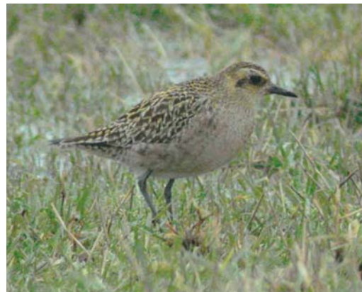
208 Vermoedelijke Toendraslechtsvalk / presumed Tundra Peregrine Falcon Falco peregrinus calidus , eerstejaars, Veerse Meer, Zeeland, 15 januari 2004 (Pim A Wolf) 209 Humes Bladkoning / Hume's Leaf Warbler Phylloscopus humei , Grou, Friesland, 4 januari 2004 (Bas van den Boogaard) 210 Amerikaanse Goudplevier / American Golden Plover Pluvialis dominica , Grijskerke, Zeeland, 12 januari 2004 (Pim A Wolf) 211 Aziatische Goudplevier / Pacific Golden Plover Pluvialis fulva , Grijskerke, Zeeland, 31 januari 2004 (Pim A Wolf)

KRAANVOGEL TOT ALKEN Eind februari werden weer twee Kraanvogels Grus grus gezien in de omgeving van het Fochteloërveen, Drenthe/Friesland. Eén exemplaar was op 21 februari aanwezig ten zuiden van de Lepelaarsplassen, Flevoland. Een Amerikaanse Goudplevier Pluvialis dominica die op 12 januari werd ontdekt bij Grijskerke, Zeeland, werd daar onregelmatig gezien tot 12 februari. Op dezelfde plek werd op 14 januari aan de hand van video-opnames een Aziatische Goudplevier P. fulva ontmaskerd, die eveneens onregelmatig werd gezien tot 21 februari; slechts een enkele keer werden beide dwaalgasten tegelijkertijd waargenomen in de grote groep Goudplevieren P. apricaria . De eerste-winter Grote Grijsze Snip Limnodromus scolopaceus van het Veerse Meer bleef daar tot in maart. Een Regenwulp Numenius phaeopus werd op 22 februari opgemerkt bij Yerseke. Rosse Franjepoten Phalaropus