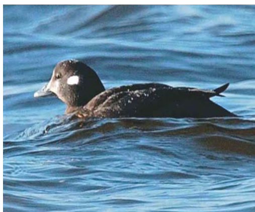
192 Siberian Rubythroat / Roodkeelnachtegaal Luscinia calliope , first-winter female, Rabat, Malta, 25 January 2004 (Charles Gauci) 193 Cape Verde Buzzard / Kaapverdische Buizerd Buteo (buteo) bannermanni , São Jorge dos Orgãos, Santiago, Cape Verde Islands, 11 March 2004 (Arnoud B van den Berg) 194 American Coot / Amerikaanse Meerkoet Fulica americana (left) with Eurasian Coot / Meerkoet F atra , Lagoa das Furnas, São Miguel, Azores, 14 February 2004 (Peter Alfrey) 195 Harlequin Duck / Harlekijneend Histrionicus histrionicus , female, Lewis, Western Isles, Scotland, 20 February 2004 (Mike Malpass)

at nearby Choggia, Veneto). In Nord, France, an adult Ross's Gull Rhodostethia rosea was sighted for 20 min at Jetée du Clipon, Dunkerque, on 8 February. In Ireland, Forster's Terns Sterna forsteri occurred at Nimmo's Pier, Galway, from 26 November 2003 into March and at Rosslare, Wexford, (again) from 8 February. In Northern Ireland, an adult stayed at Strangford Lough, Down, Northern Ireland, from 8 February. The first Brown Noddy Anous stolidus in winter for the UAE was at Ra's Dibba on 23 February.