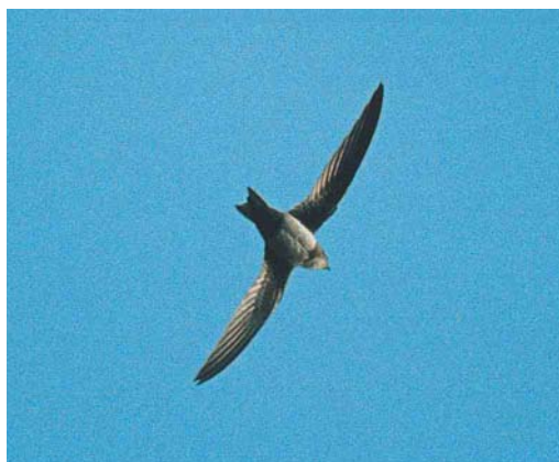
156-157 Alpengierzwaluw / Alpine Swift Apus melba , eerste-winter, Wageningen, Gelderland, november 2002

BOVENDELEN Kop, mantel en rug middelbruin, stuit en bovenstaartdekveren iets lichter grijsbruin. Veren met lichte zoom; schacht en subterminale rand donkerder bruin (ankerpatroon vormend).