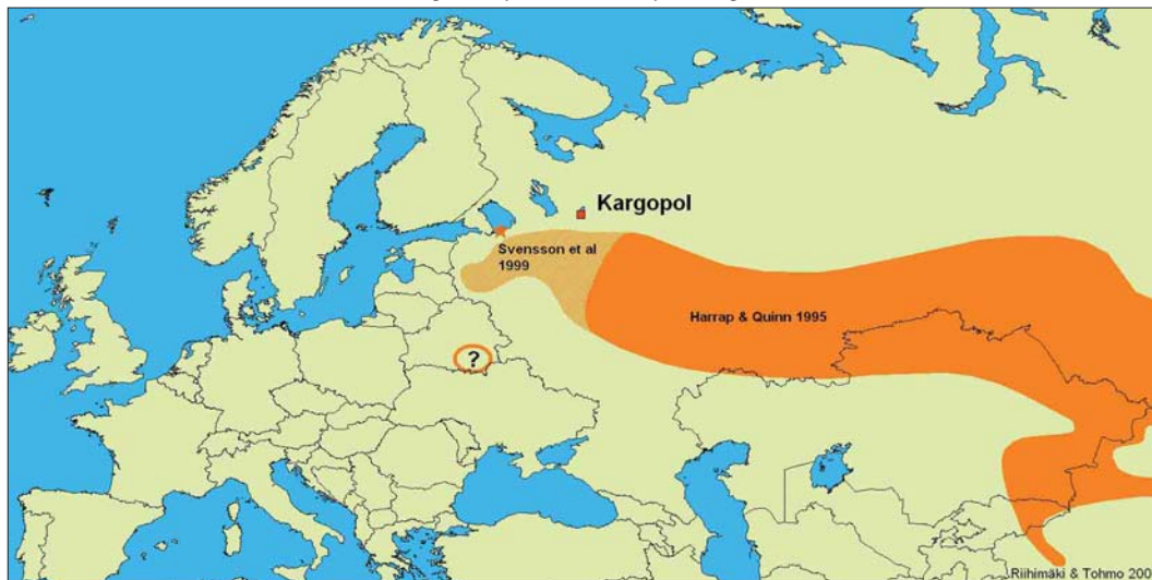
FIGURE 1 Breeding range of Azure Tit / Azuurmees Parus cyanus , after Harrap & Quinn (1995a) and Svensson et al (1999). The breeding attempt on the Novaja Ladoga is marked with *.

The total number of bird species recorded during the Kargopol expedition in 2003 was 168 (106 in 2002). Of these, 37 are included on the Annex of the European Union's Bird Directive. Almost all of the species recorded occur in Scandinavia and central Europe as well but their occurrence and numbers differ. Species common in Finland, such as Great Spotted Woodpecker D. major , Goldcrest Regulus regulus , Crested Tit P. cristatus , Willow Tit P. montanus and Coal Tit P. ater were very uncommon. Species uncommon or rare in other European countries were recorded at many sites: Great Snipe Gallinago media , Terek Sandpiper Xenus cinereus , White-backed Woodpecker D. leucotos and Citrine Wagtail Motacilla citreola . The team found out that for many species even the most recent distribution maps were inaccurate. At least the following species either breed or occur regularly in the Kargopol area and this should be taken into account when new distribution maps are made: Gadwall Anas strepera , Great Bittern Botaurus stellaris , Grey Heron Ardea cinerea , Pallid Harrier Circus macrourus , Montagu's Harrier C. pygargus , Common Quail Coturnix coturnix (which is nowadays rather