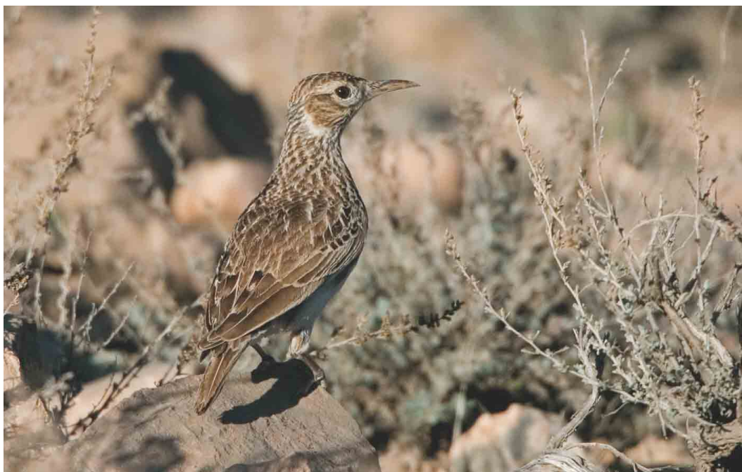
175 Dupont's Lark / Duponts Leeuwerik Chersophilus duponti , Tizi-n-Taghatine, Morocco, 29 January 2004 (Ran Schols)