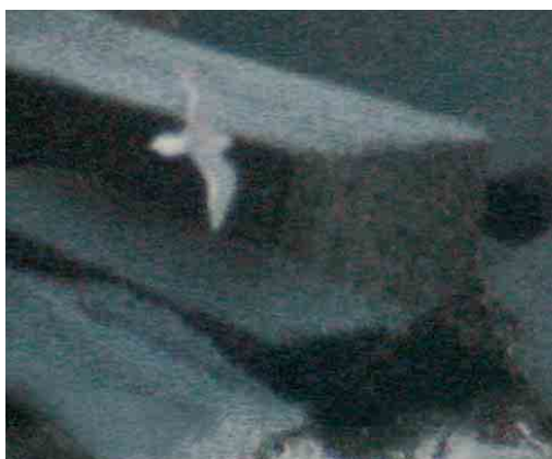
188 Ring-billed Gull / Ringsnavelmeeuw Larus delawarensis , adult, Venezia, Veneto, Italy, 22 February 2004 189 Pallas's Gull / Reuzenzwartkopmeeuw Larus ichthyaetus , adult, Mietkow reservoir, Wrocław, Silesia, Poland, 26 February 2004 190-191 Ross's Gull / Ross' Meeuw Rhodostethia rosea , adult, Jetée du Clipon, Dunkerque, Nord, France, 8 February 2004

reported in late February. On at least 13-21 January, a Slender-billed Gull L. genei was present at Castro Marim, Algarve, Portugal, where this species is still a rarity. The fifth Iceland Gull L. glaucoides for Morocco was a third-winter at Aghroud, north of Agadir, on 11 January. In the Azores, a first-winter was present at the landfill site on Terceira on 18 February. If accepted, an adult Thayer's Gull L. thayeri at Sandgerði on 10 March will be the first for Iceland. After the first at Nimmo's Pier, Galway, Ireland, on 24 January (Dutch Birding 26: 35, plate 86, 2004), the number of reports of American Herring Gulls L. smithsonianus increased, as is usual for February-March in recent years. These included a total of up to 11 for the Azores (up to three on São Miguel on 11-13 February) and up to eight on Terceira on 14-18 February). If accepted, a third-winter at the Reykjanes peninsula from 7 March will be the fifth for Iceland; this individual was followed by three first-winters