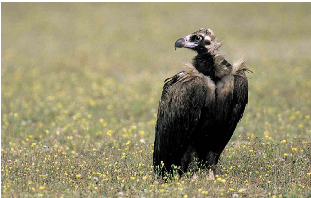
154 Monniksgier / Eurasian Black Vulture Aegypius monachus , onvolwassen, Maasvlakte, Zuid-Holland, 15 augustus 2000