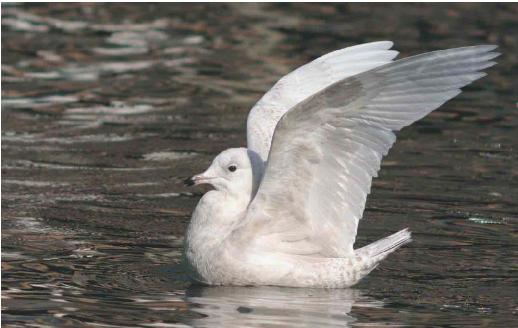
214 Kleine Burgemeester / Iceland Gull Larus glaucooides , eerste-winter, Rotterdam, Zuid-Holland, 1 maart 2004 (Chris van Rijswijk)