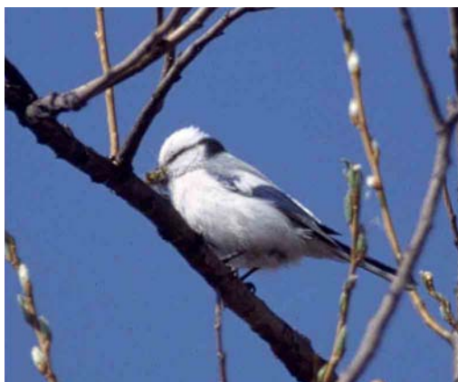
177 Azure Tit / Azuurmees Parus cyanus , adult carrying nesting material, Svid river, Kargopol, Russia, May 2003 (Jouni Riihimäki)

of governmental subsidies and fields are gradually becoming overgrown with bushes and losing their function as pasture for geese. However, these fields still possess a high ecological value because of their diversity.