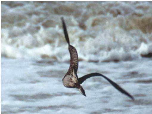
Mystery photograph III (October)