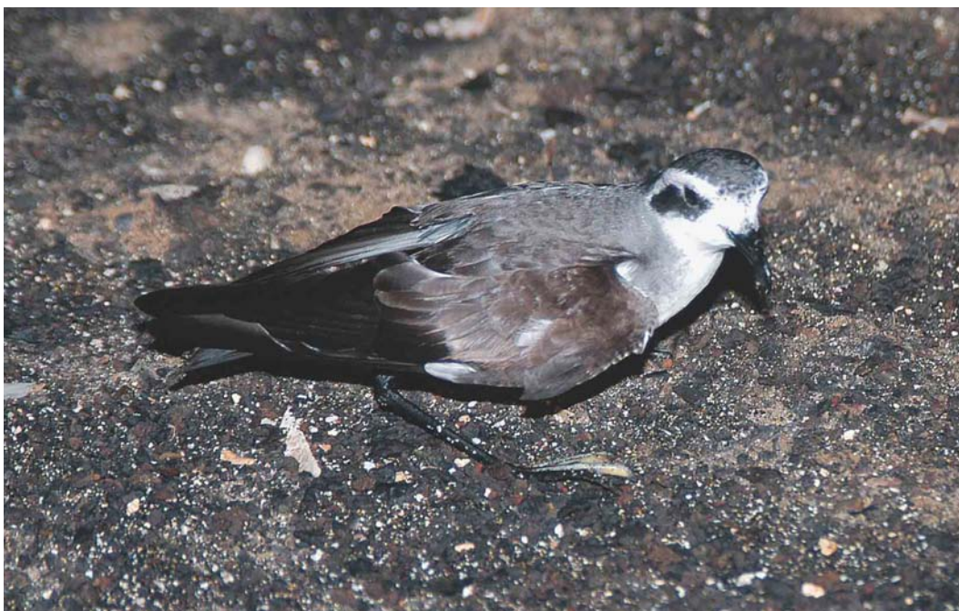
182 White-faced Storm-petrel / Bont Stormvogeltje Pelagodroma marina , Branco, Cape Verde Islands, 14 February 2004 (Arnoud B van den Berg)