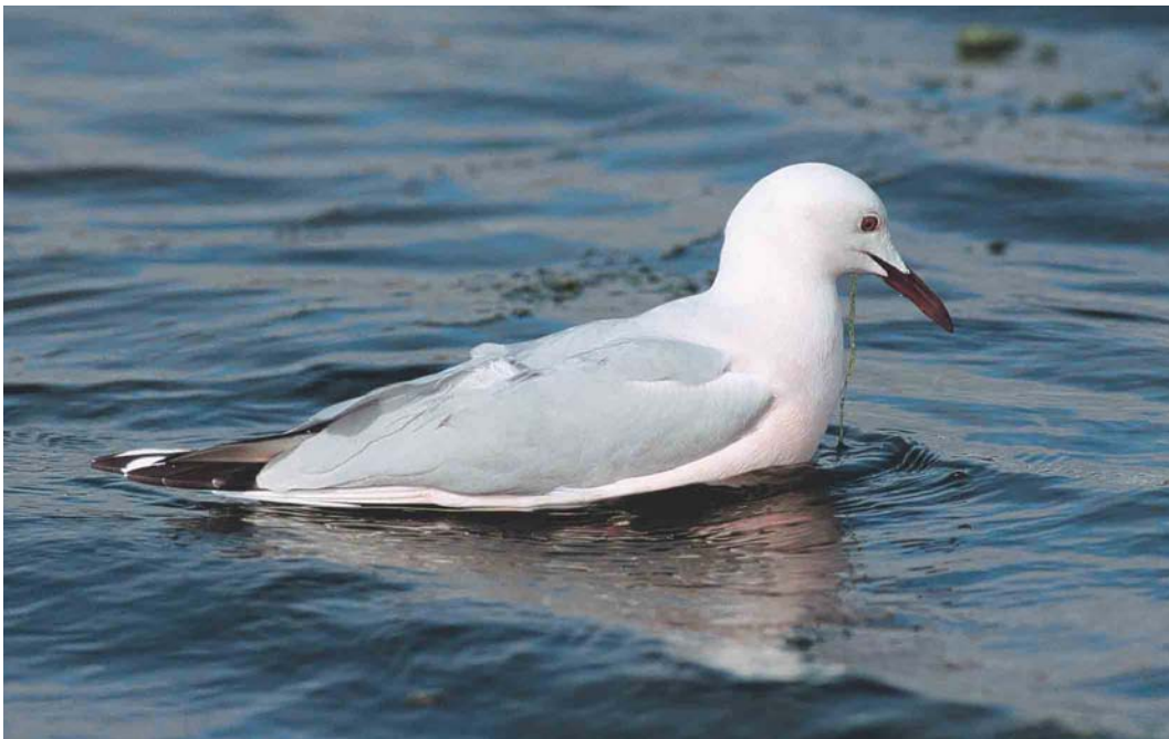
185 Slender-billed Gull / Dunbekmeeuw Larus genei , Castro Marim NR, Algarve, Portugal, 13 January 2004 (Ray Tipper)