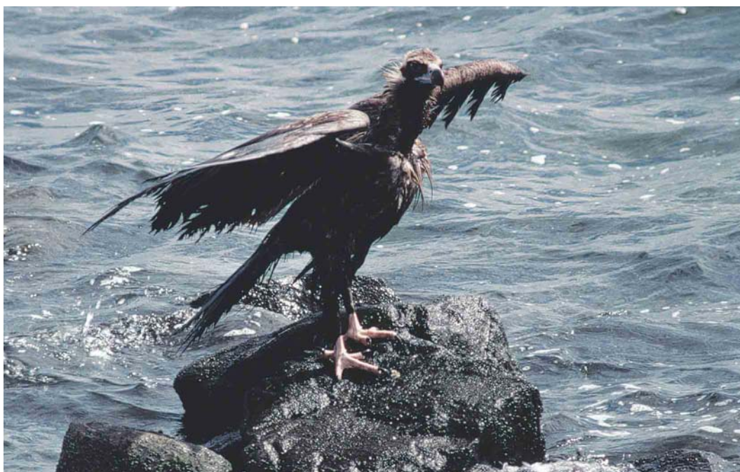
155 Monniksgier / Eurasian Black Vulture Aegypius monachus , onvolwassen, Maasvlakte, Zuid-Holland, 16 augustus 2000