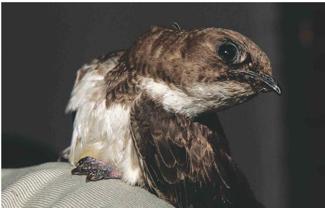
158 Alpengierzwaluw / Alpine Swift Apus melba , eerste-winter (ter verzorging gevangen te / taken into care at Wageningen, Gelderland, op 4 december 2002), Bennekom, Gelderland, 5 januari 2003 (Marten van Dijk)

dus nog niet losgelaten worden. Het leek de Stichting Gierzwaluwenwerkgroep Nederland bovendien het beste om hem los te laten in Zwitserland en niet in Nederland. De vogel zou dan een hernieuwde start kunnen maken tussen soortgenoten en plaatselijk deskundige begeleiding krijgen alvorens te worden losgelaten. Op 20 mei 2003 kreeg de Stichting schriftelijke toestemming van het Ministerie van Landbouw, Natuur en Voedselkwaliteit (LNV) om de vogel naar Zwitserland te brengen. Op Hemelvaartsdag (29 mei) 2003 was het eindelijk zover dat de inmiddels 'Melba' gedoopte vogel naar Baden nabij Zürich, Zwitserland, kon worden vervoerd. Het verenkleed verkeerde echter in een dusdanig slechte staat dat hij nog niet in staat was normaal uit te vliegen. Vooral de staart die gedurende een half jaar veelvuldig in aanraking was gekomen met de ondergrond van het aquarium waarin de vogel werd gehouden vertoonde ernstige slijtage. In Zwitserland werd besloten de vogel nieuwe staartpennen te geven door middel van een staartpentransplantatie. Hierbij worden de gesletten staartpennen afgeknipt en niet gesletten pennen van een dode Alpengierzwaluw van een