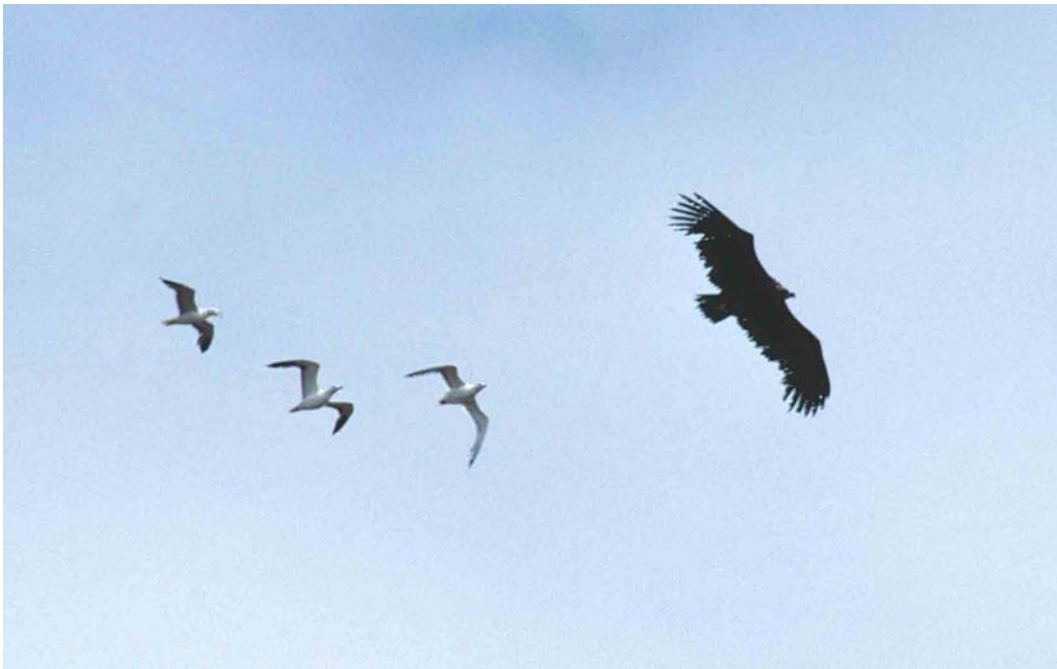
152-153 Monniksgier / Eurasian Black Vulture Aegypius monachus , onvolwassen, Maasvlakte, Zuid-Holland, 16 augustus 2000