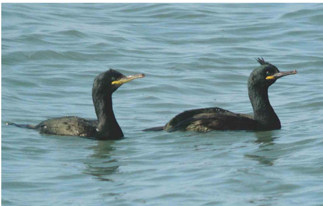
201 Kuifaalscholvers / European Shag Phalacrocorax aristotelis , adult (rechts) en tweede-zomer, Neeltje Jans, Zeeland, 1 maart 2004