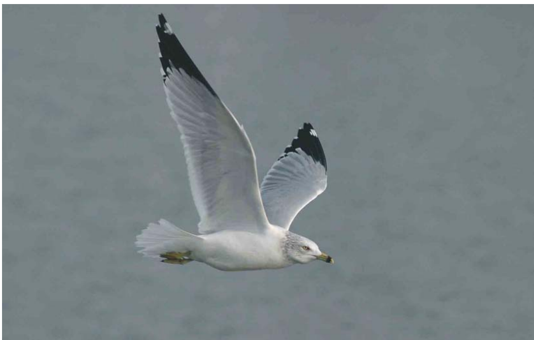
212 Ringsnavelmeeuw / Ring-billed Gull Larus delawarensis , adult, Tiel, Gelderland, 27 januari 2004