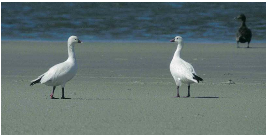
166 Ross' Ganzen / Ross's Geese Anser rossii , Rottumeroog, Groningen, 15 juni 1994. Deze twee vogels worden als ontsnapt beschouwd / these birds are considered escapes.

the Netherlands, after the first in November-December 1985. After two blank years, two Ross's Geese were seen at various sites from late 1998 until at least early 2004; both birds were seen together only once, in January 2000. These birds have been accepted as the fourth and fifth for the Netherlands. In addition, several reports have not been submitted or have been rejected because of known or suspected captive origin. Birds have mostly been associating with Barnacle Geese Branta leucopsis . This paper gives a detailed overview of all Dutch records (see table 1) and discusses the identification and status. Although the likelihood of escapes is considerable, the Dutch rarities committee (CDNA) considers Ross's Goose a possible vagrant and therefore regards records of unringed birds not showing unusual behaviour or other indications of captive origin acceptable.