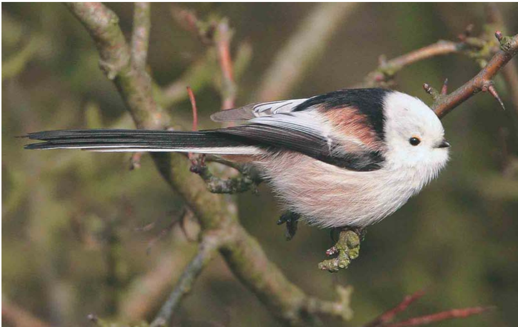
198 White-headed Long-tailed Tit / Witkopstaartmees Aegithalos caudatus caudatus , Westleton Heath, Suffolk, England, 22 February 2004