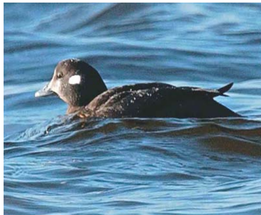
192 Siberian Rubythroat / Roodkeelnachtegaal Luscinia calliope , first-winter female, Rabat, Malta, 25 January 2004 193 Cape Verde Buzzard / Kaapverdische Buizerd Buteo (buteo) bannermanni , São Jorge dos Orgãos, Santiago, Cape Verde Islands, 11 March 2004 194 American Coot / Amerikaanse Meerkoet Fulica americana (left) with Eurasian Coot / Meerkoet F atra , Lagoa das Furnas, São Miguel, Azores, 14 February 2004 195 Harlequin Duck / Harlekijneend Histrionicus histrionicus , female, Lewis, Western Isles, Scotland, 20 February 2004

at nearby Choggia, Veneto). In Nord, France, an adult Ross's Gull Rhodostethia rosea was sighted for 20 min at Jetée du Clipon, Dunkerque, on 8 February. In Ireland, Forster's Terns Sterna forsteri occurred at Nimmo's Pier, Galway, from 26 November 2003 into March and at Rosslare, Wexford, (again) from 8 February. In Northern Ireland, an adult stayed at Strangford Lough, Down, Northern Ireland, from 8 February. The first Brown Noddy Anous stolidus in winter for the UAE was at Ra's Dibba on 23 February.