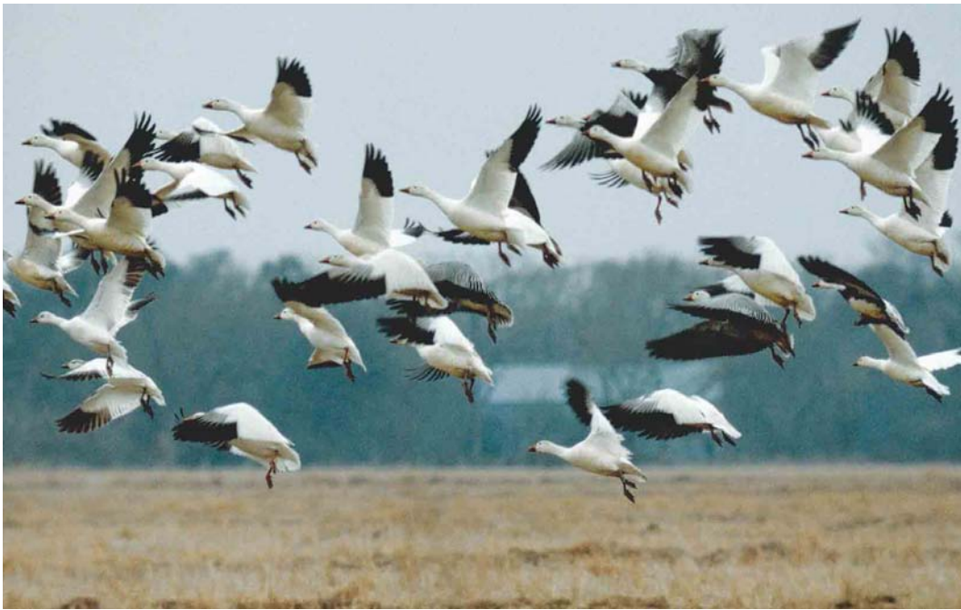
167 Ross's Geese / Ross' Ganzen Anser rossii and Lesser Snow Geese / Kleine Sneeuwganzen A caerulescens caerulescens , Attwater, Texas, USA, 19 February 1982