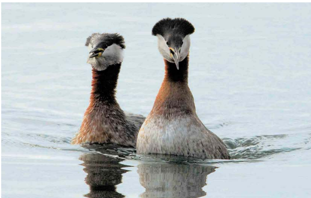
200 Roodhalsfuten / Red-necked Grebes Podiceps grisegena , Heel, Limburg, 1 maart 2004