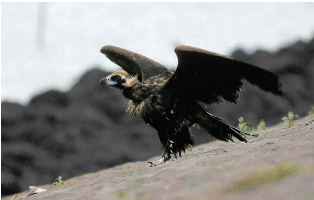
149 Monniksgier / Eurasian Black Vulture Aegypius monachus , onvolwassen, Den Oever, Noord-Holland, 26 juli 2000 ( René Pop )