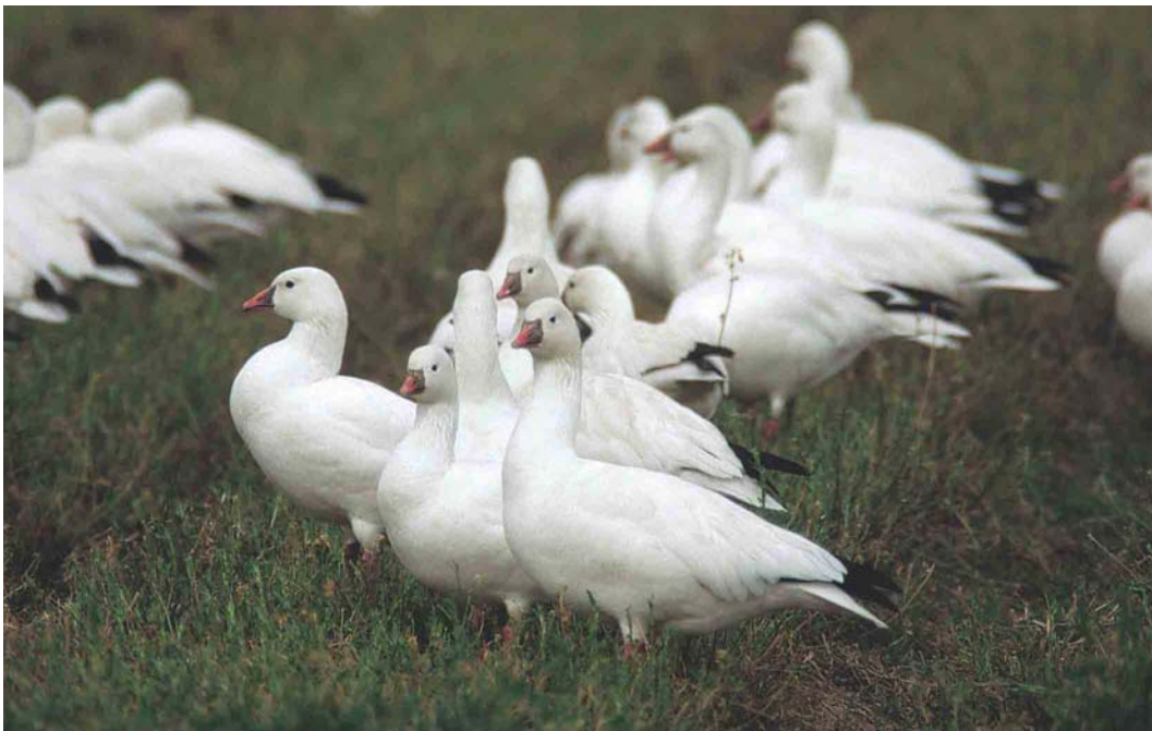
168 Ross's Geese / Ross' Ganzen Anser rossii , Salton Sea, California, USA, 20 January 1998