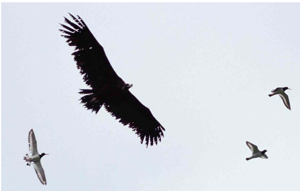
148 Monniksgier / Eurasian Black Vulture Aegypius monachus , onvolwassen, Westhoek, Friesland, 14 juli 2000