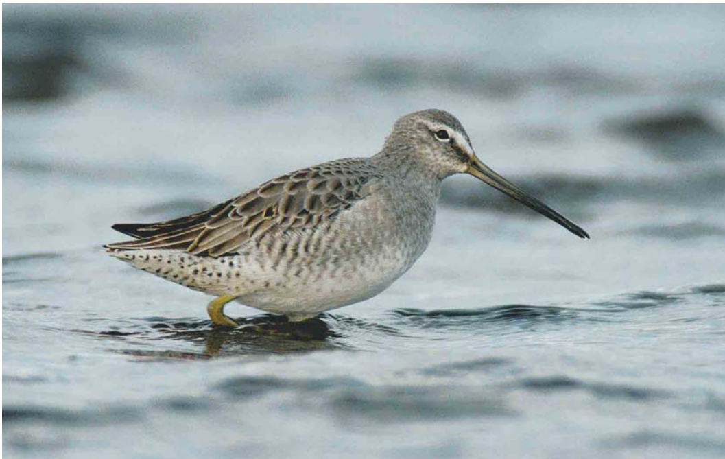
215 Grote Grijze Snip / Long-billed Dowitcher Limnodromus scolopaceus , eerstejaars, Veerse Meer, Oud-Sabbinge, Zeeland, 8 maart 2004 (Marten van Dijk)