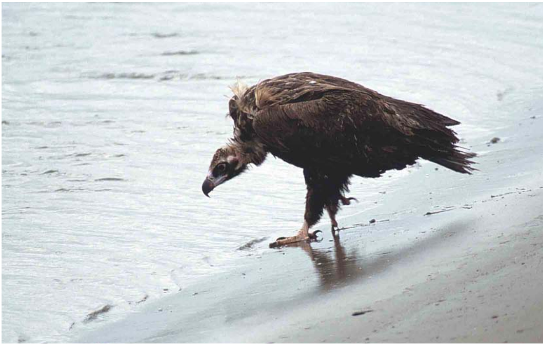
150-151 Monniksgier / Eurasian Black Vulture Aegypius monachus , onvolwassen, Maasvlakte, Zuid-Holland, 15 augustus 2000 (Marten van Dijl)