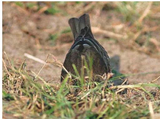
Mystery photograph IV (October)

for falcons Falco (15%) or swifts Apus (3%). Indeed, both are long winged but miss out on some characters. Juvenile falcons show more pale fringes on the scapulars. Dark-plumaged adult falcons, like Eleonora's Falcon F. eleonora and Sooty Falcon F. concolor , the most mentioned falcons, would be slimmer and would show a longer tail. In addition, the bill of the bird is just visible and shows a pointed tip. Swifts can be eliminated by the rather erect posture, quite unlike the clumsy crouching swifts. Furthermore, swifts have even longer and more pointed wings.