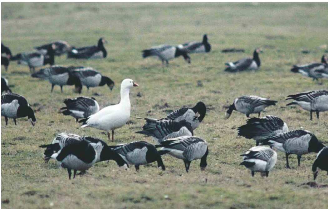
159 Ross' Gans / Ross's Goose Anser rossii , Strijen, Zuid-Holland, 9 februari 2000 (Marten van Dijk)

Van 1 december 1990 tot 10 maart 1995 bleef van deze vogels slechts één exemplaar 's winters