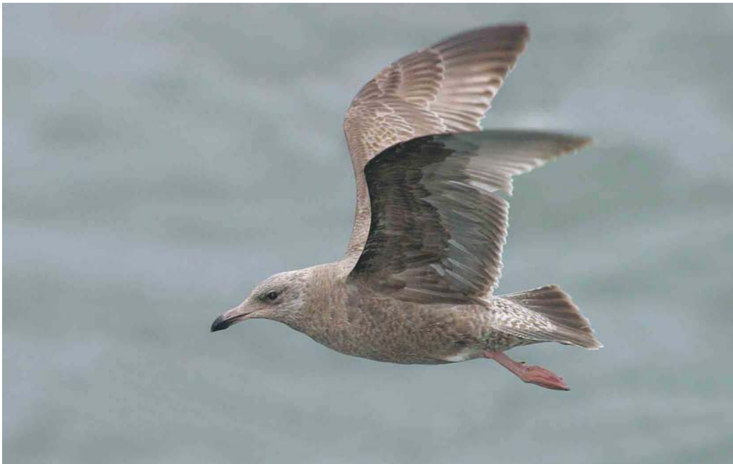
184 American Herring Gull / Amerikaanse Zilvermeeuw Larus smithsonianus , first-winter, Reykjanes peninsula, Iceland, March 2004