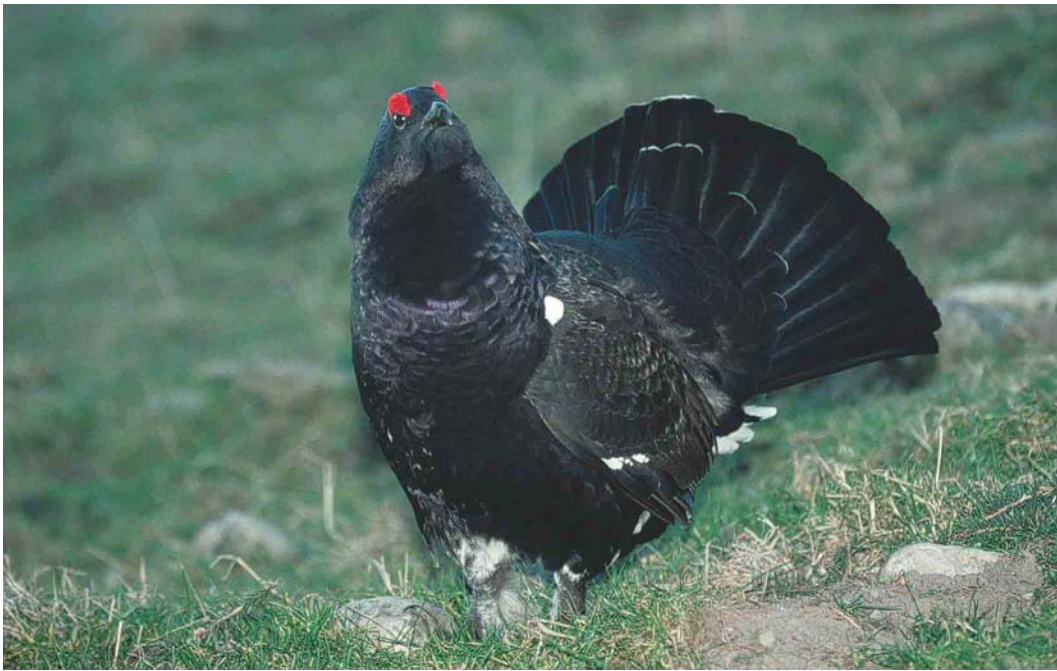
186-187 Hybrid Western Capercaillie x Black Grouse / hybride Auerhoen x Korhoen Tetrao urogallus x tetrrix , male, Sonthofen, Bayern, Germany, December 2003