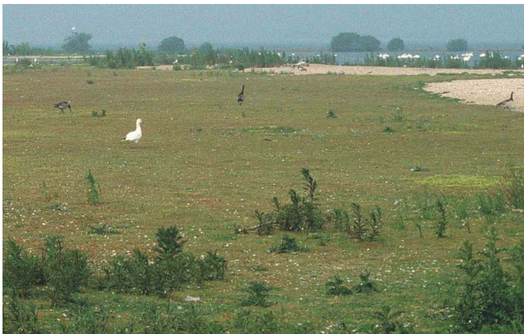
171 Ross' Gans / Ross's Goose Anser rossii , nabij nest, Slijkplaat, Haringvliet, Zuid-Holland, 2 juni 2003

Ross' Gans. Op beide data was de vogel alleen: er was geen sprake van een 'wakend' mannetje Brandgans in de omgeving en ook als de vogel opvloog bleef deze solitair rondjes vliegen. Er waren dus geen aanwijzingen dat de vogel was gepaard met een Brandgans of voor de aanwezigheid van een tweede Ross' Gans. Op 18 juni leek het nest met de vijf eieren verlaten en werd de Ross' Gans niet meer aangetroffen. Ook tijdens het laatste bezoek op 8 juli was er geen spoor van de Ross' Gans, terwijl de meeste eieren nu gepredeerd waren. Het feit dat de vogel daadwerkelijk broedend op het nest werd gezien, alsmede de relatief kleine eieren, duiden erop dat het hier om een broedpoging van een vrouwtje Ross' Gans ging. De vogel leek ongepaard en de eieren waren waarschijnlijk onbevruucht.