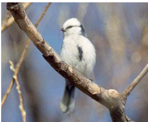
176 Azure Tit / Azuurmees Parus cyanus , Svid river, Kargopol, Russia, May 2003