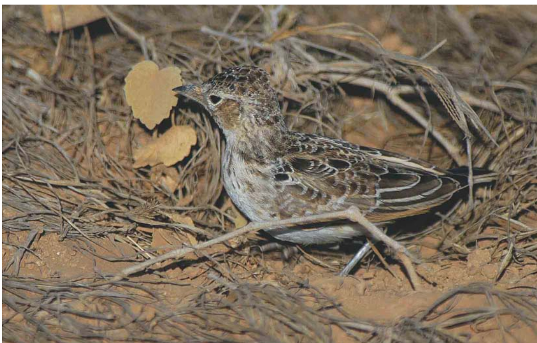
197 Raso Lark / Razoleeuwerik Alauda razae , juvenile, Raso, Cape Verde Islands, 13 February 2004