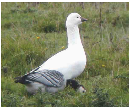
160 Ross' Gans / Ross's Goose Anser rossii , Stellendam, Zuid-Holland, 5 januari 1995 (Marten van Dijk) 161 Ross' Gans / Ross's Goose Anser rossii , Scheelhoek, Stellendam, Zuid-Holland, 10 februari 2001 (Arnoud B van den Berg) 162 Ross' Gans / Ross's Goose Anser rossii , Rammegors, Zeeland, 18 januari 2003 (Eddy Blomme) 163 Ross' Gans / Ross's Goose Anser rossii , Paessens, Friesland, 18 september 2002 (Willem Hartholt)