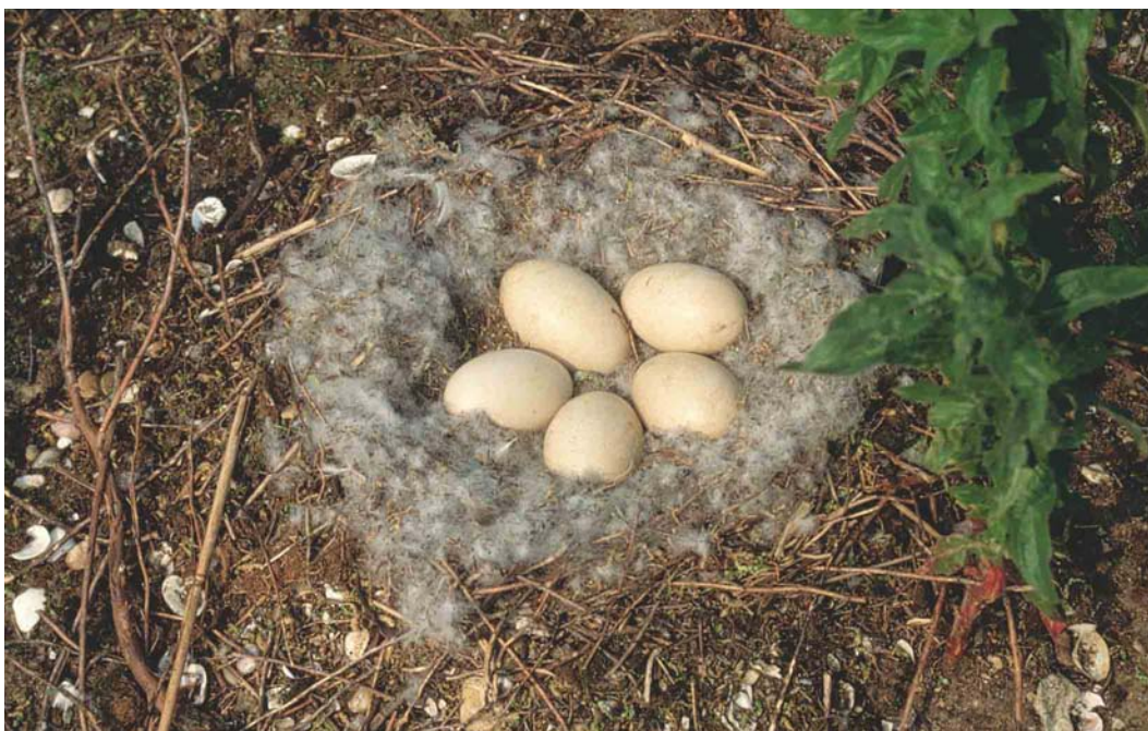
169 Nest van Ross' Gans / Ross's Goose Anser rossii , Slijkplaat, Haringvliet, Zuid-Holland, 2 juni 2003 (Peter L Meininger)