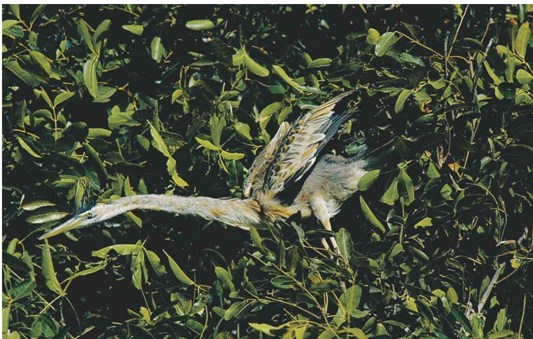
196 Bourne's Heron / Kaapverdise Purperreiger Ardea bournei , immature, Santiago, Cape Verde Islands, 10 March 2004