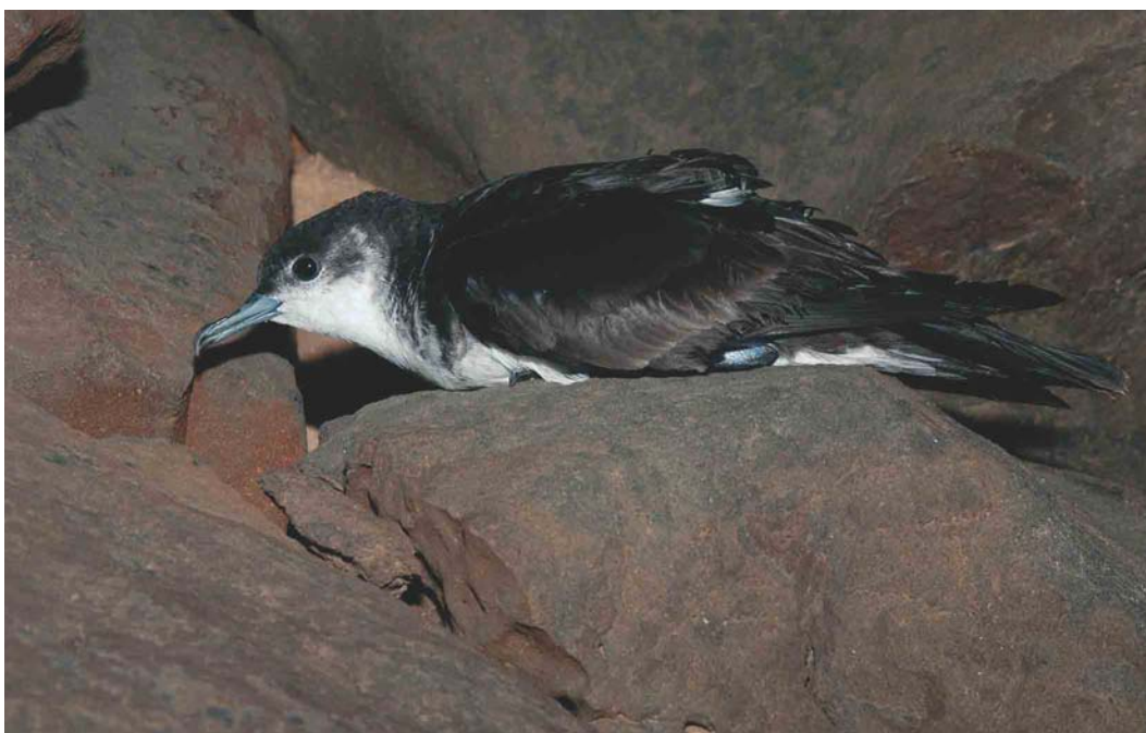
183 Cape Verde Little Shearwater / Kaapverdische Kleine Pijlstormvogel Puffinus (assimilis) boydi , Raso, Cape Verde Islands, 14 February 2004