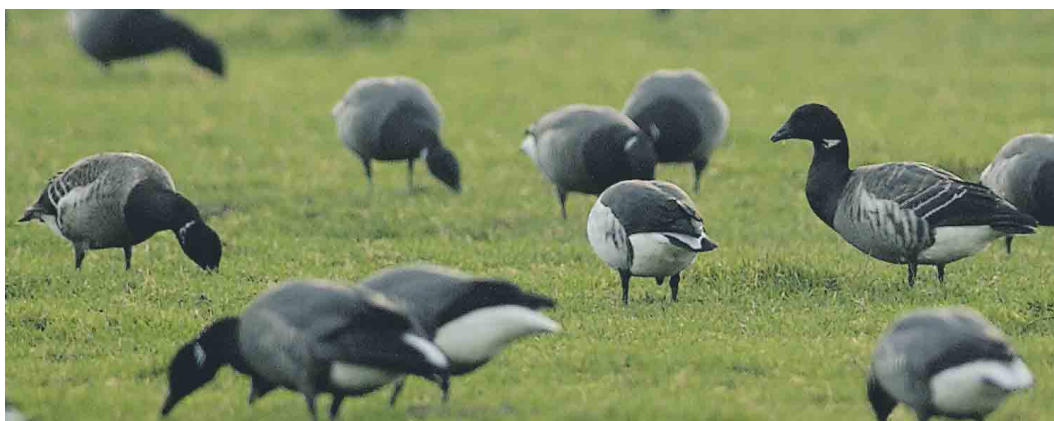
172 Witbuikrotgans / Pale-bellied Brent Goose Branta hrota , adult mannetje (links), Rotganzen / Dark-bellied Brent Geese B bernicla , en twee hybriden Witbuikrotgans x Rotgans / Pale-bellied Brent Goose x Dark-bellied Brent Goose, eerstejaars (rechts), Wagejot, Texel, Noord-Holland, 30 december 2003 (René Pop) 173 Witbuikrotgans / Pale-bellied Brent Goose Branta hrota , adult mannetje (rechts), Rotganzen / Dark-bellied Brent Geese B bernicla , en hybride Witbuikrotgans x Rotgans / Pale-bellied Brent Goose x Dark-bellied Brent Goose (midden), Wagejot, Texel, Noord-Holland, 30 december 2003 (René Pop) 174 Witbuikrotgans / Pale-bellied Brent Goose Branta hrota , adult mannetje (midden), Rotganzen / Dark-bellied Brent Geese B bernicla , en twee hybriden Witbuikrotgans x Rotgans / Pale-bellied Brent Goose x Dark-bellied Brent Goose, eerstejaars (rechts en links), Wagejot, Texel, Noord-Holland, 30 december 2003 (René Pop)

september tot mei in Nederland. Tijdens de vermenging in de wintergebieden kunnen gemengde paren gevormd worden.