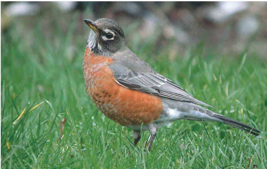
199 American Robin / Roodborstlijster Turdus migratorius , Grimsby, Lincolnshire, England, February 2004