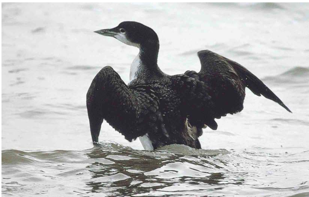
202 Ijsduiker / Great Northern Loon Gavia immer , Oostvoorne, Zuid-Holland, 23 januari 2004