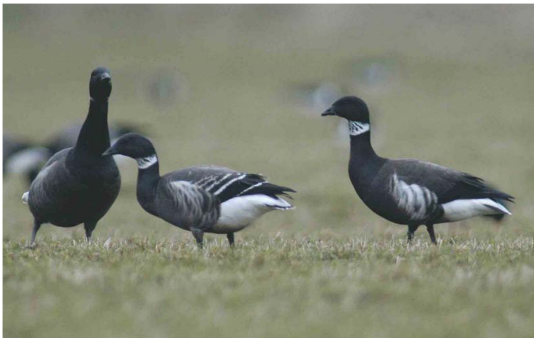
203 Zwarte Rotganzen / Black Brants Branta nigricans , adult (rechts) en juveniel, met Rotgans / Dark-bellied Brent Goose B bernicla (links), Yerseke, Zeeland, 1 februari 2004