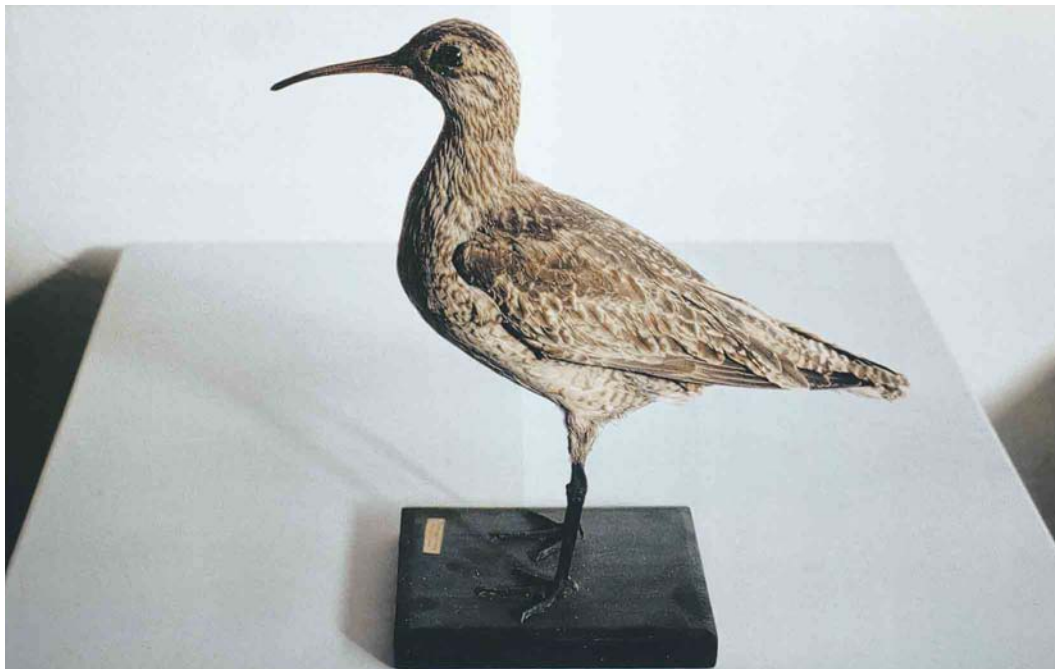
178 Eskimo Curlew / Eskimowulp Numenius borealis (shot on Tresco, Scilly, England, on 10 September 1887), Isles of Scilly Museum, St Mary's, Scilly, England, October 1992 (Paul Knolle). Reproduced with permission from the Isles of Scilly Museum.

to cross (if they arrive from the mainland at all). It is also interesting to note how rare some species in Scilly are compared with their presence in or around the North Sea. Compare, for instance, Velvet Scoter Melanitta fusca (11 records, involving 17 birds) with Surf Scoter (nine records), Marsh Sandpiper Tringa stagnatilis (one record) with the Nearctic yellowlegs (16 in total: five Greater Yellowlegs T. melanoleuca , nine Lesser Yellowlegs T. flavipes and two unidentified yellowlegs) and Lesser Grey Shrike L. minor (seven records, none since 1976) with Great Grey Shrike (eight records, only one since 1978). And what to think of only 17 records (involving 19 birds) of Great Crested Grebe Podiceps cristatus and only five records (involving seven birds) of Eurasian Jay Garrulus glandarius ? The latter examples illustrate the true rarity of some of the 'common' European species rather than a lack of observer's awareness, because few islands will be so intensively covered as Scilly, at least during the migration months in autumn. It is this kind of reading and browsing that makes The birds of the Isles of Scilly a fascinating book for many birders. My feeling is that the most important information could have been presented in a more compact, more richly illustrated and yet less expensive way but that may be as much a reflection of my own preferences as a criticism of this book. ENNO B EBELS