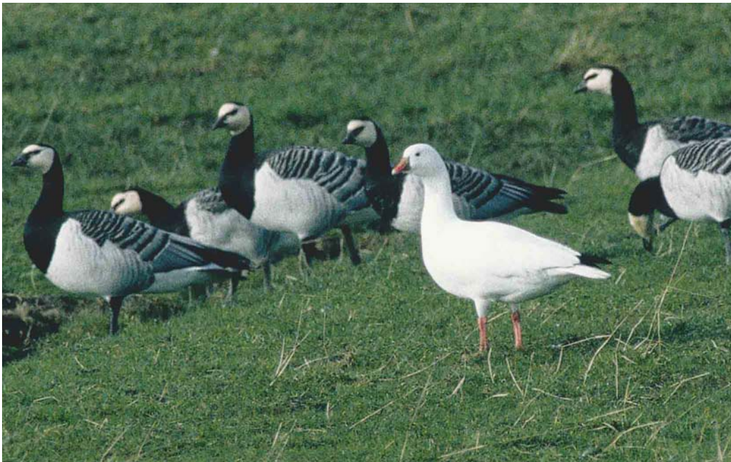
164 Ross' Gans / Ross's Goose Anser rossii , Anjumerkolken, Friesland, 26 februari 2000