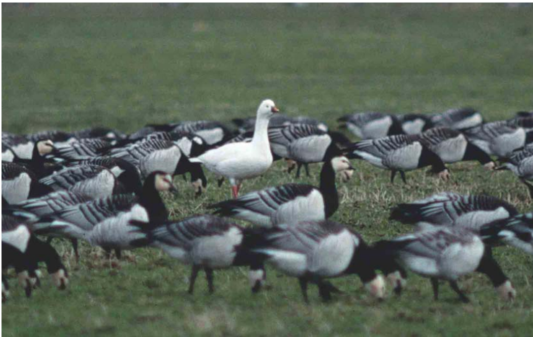
165 Ross' Gans / Ross's Goose Anser rossii , Anjumerkolken, Friesland, 2 maart 2000