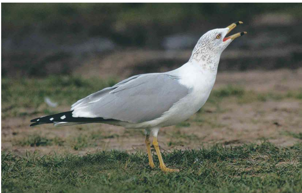
213 Ringsnavelmeeuw / Ring-billed Gull Larus delawarensis , adult, Tiel, Gelderland, 22 februari 2004