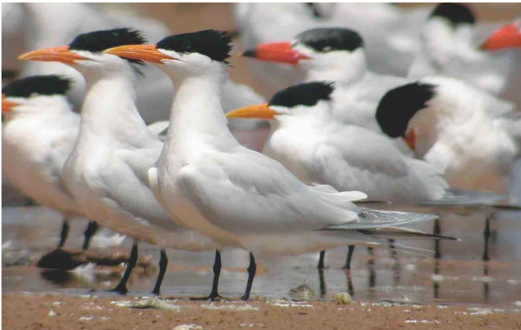
258 Royal Terns / Koningssterns Sterna maxima , with Caspian Terns / Reuzensterms S caspia , Cap Blanc, Mauritania, 26 March 2004