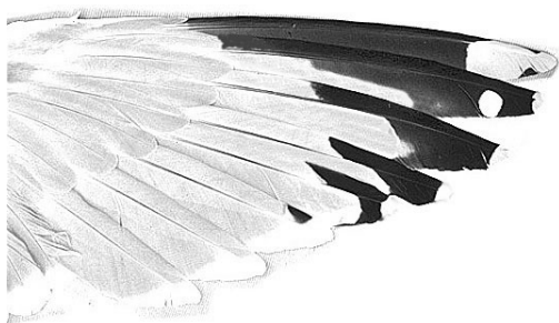
FIGURE 4a European Herring Gull / Zilvermeeuw Larus argentatus argenteus , upperwing of adult (Peter Adriaens)