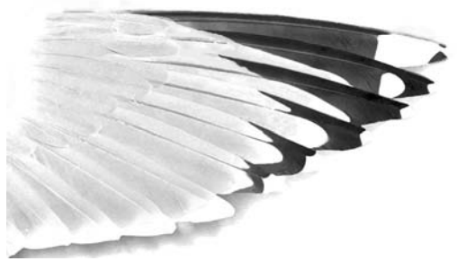
FIGURE 3 Newfoundland American Herring Gull / Amerikaanse Zilvermeeuw Larus smithsonianus , upperwing of adult (Peter Adriaens)

The red gonys spot is often distinctly small, obviously not reaching up to the lower cutting edge, and is rather pale (more orange than red). Therefore, the bill pattern resembles that of argentatus although the gonys spot may be even smaller. In winter, adult argenteus usually retains a more yellowish bill throughout (although the basal two thirds may be paler yellow than the tip), dark subterminal markings are more often absent, and the gonys spot is larger (reaching up to or almost up to the cutting edges) and brighter. Beware of subadult birds, however. From mid-February onwards, the bills of NF smithsonianus rapidly turn bright yellow as head streaking disappears. However, the dark subterminal marks often remain into May at least, which only exceptionally occurs in European Herring Gulls. The orange gonys spot may increase in size and brightness, although it remains relatively small in quite a few birds.