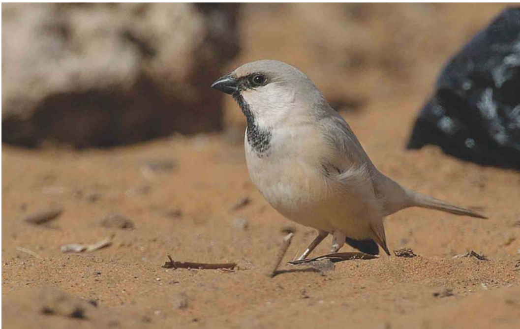
283 Desert Sparrow / Woestijnmus Passer simplex , male, Merzouga, Tafilalt, Morocco, January 2004