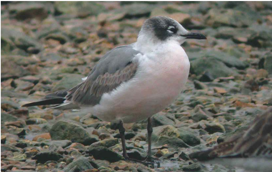
257 Franklin's Gull / Franklins Meeuw Larus pipixcan , first-winter, Radipole Lake, Dorset, England, 1 April 2004