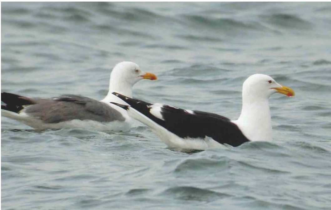
256 Cape Gull / Afrikaanse Kelpmeeuw Larus dominicanus vetula , with Yellow-legged Gull / Geelpootmeeuw L. michahellis , Iwik-Zira, Banc d'Arguin, Mauritania, 23 March 2004