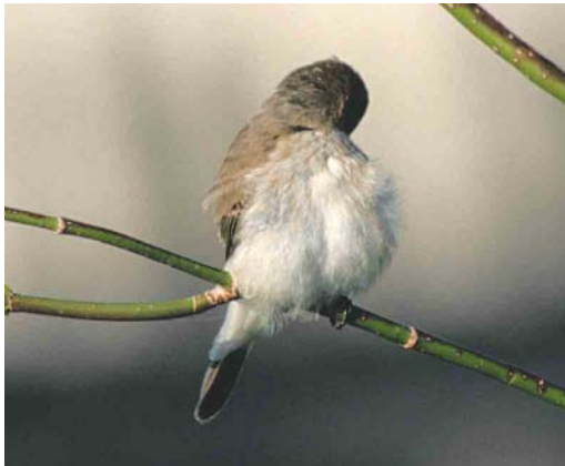
Mystery photograph V (May)