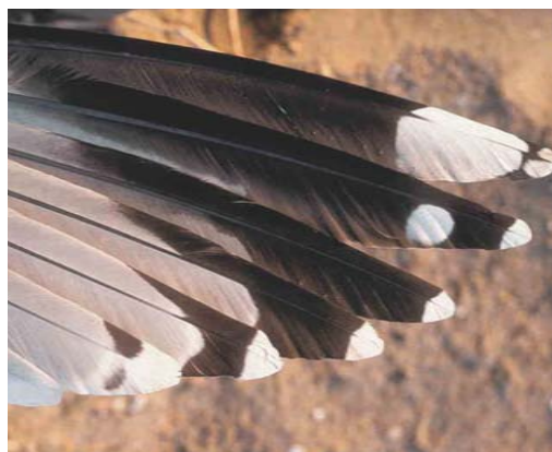
237 European Herring Gull / Zilvermeeuw Larus argentatus argenteus , adult, Zeebrugge, West-Vlaanderen, Belgium, June 2001 (Geert Spanoghe). The tongue of p10 is not visible but in any case cannot be very broad. P5 does not show a complete black band, and the spot on the outer web is thick and solid (not 'U'-shaped). The grey tongue of p8 is shorter than on p7, and lacks a white tongue-tip. There are no 'bayonets' on p7-8, or perhaps a very slight one on p8, but it is hardly visible. Note also the rather large amount of black on the inner and outer webs of p9.

ters on p10 (as in figure 5a) was found in less than 9%. Again, we would like to emphasize that, of these 9% (and of those 5.8% of Eastern Baltic Herring Gulls mentioned under fig 5a), none showed a complete black band between the white mirror and tip.