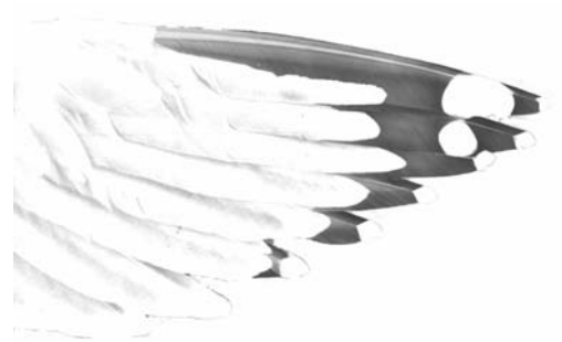
FIGURE 2b Newfoundland American Herring Gull / Amerikaanse Zilvermeeuw Larus smithsonianus , underwing of adult (Peter Adriaens)

BILL COLOUR In winter, this may be another element of limited help, as the bill is rather dull in adult NF smithsonianus , compared with adult argenteus . While the bill-tip is normally yellow, the basal two thirds are often clearly less brightly coloured, and may even be greenish, pinkish, or greyish without a yellowish hue. Many winter adults have dark subterminal bill markings, such as a greyish or blackish spot or bar above the gonys.