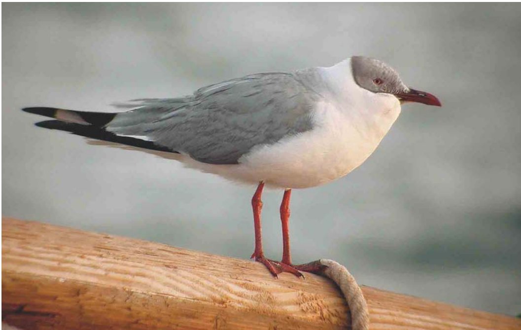
255 Grey-headed Gull / Grijskopmeeuw Larus cirrocephalus , Iwik-Zira, Banc d'Arguin, Mauritania, 23 March 2004 (Kris De Rouck)