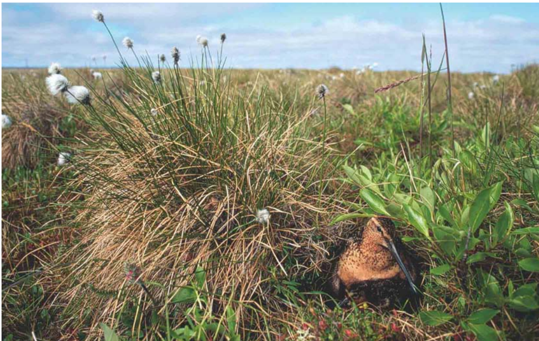
366 Long-billed Dowitcher / Grote Grijze Snip Limnodromus scolopaceus , Yakutia, Siberia, Russia, July 1999 (Chris Schenk)