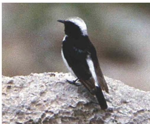
323 Eastern Mourning Wheatear / Oostelijke Rouwtaapuit Oenanthe lugens lugens , adult, Eilat, Israel, December 1992 324 Eastern Mourning Wheatear / Oostelijke Rouwtaapuit Oenanthe lugens persica , first-summer male, Mizpe Ramon, Central Negev, Israel, 28 February 2004. Probably the second record of O l persica for Israel. 325-326 Eastern Mourning Wheatear / Oostelijke Rouwtaapuit Oenanthe lugens persica , Persepolis, c 50 km north-east of Shiraz, Iran, 20 April 1998