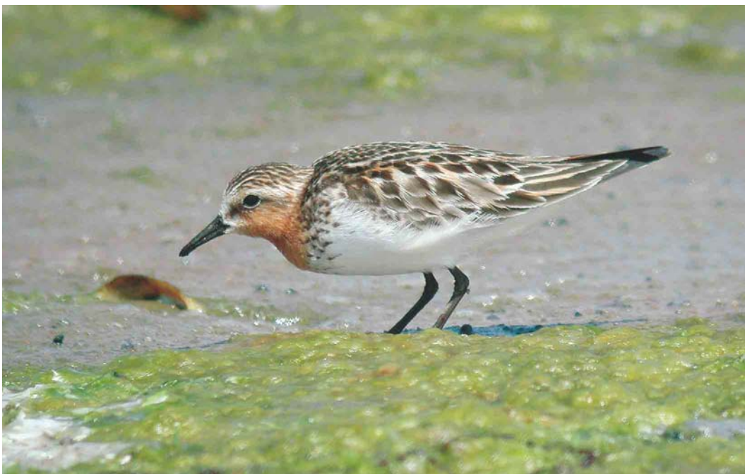
381 Red-necked Stint / Roodkeelstrandloper Calidris ruficollis , adult, Slikken van Flakkee, Zuid-Holland, Netherlands, 6 July 2004