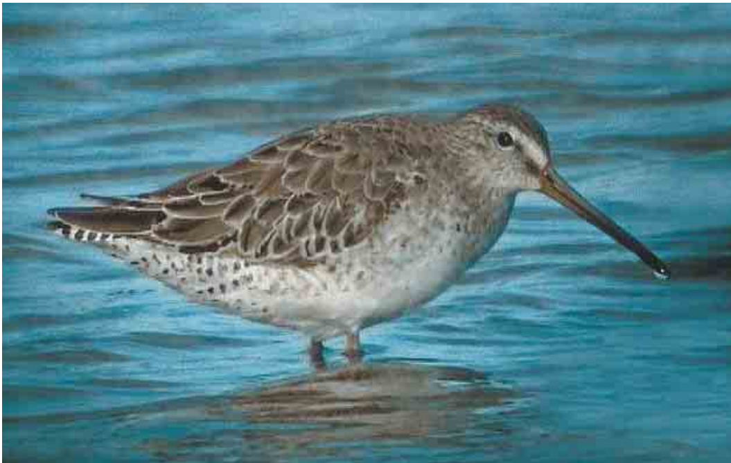
380 Short-billed Dowitcher / Kleine Grijze Snip Limnodromus griseus , first-summer, Lady's Island Lake, Wexford, Ireland, 2 July 2004