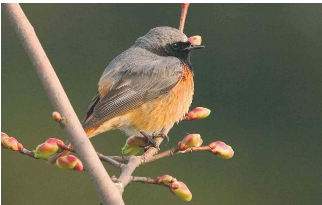
413 Hybride Zwarte x Gekraagde Roodstaat / hybrid Black x Common Redstart Phoenicurus ochrurus x phoenicurus , Groote Peel, Ospel, Limburg, 17 april 2004 cf Dutch Birding 26: 215, 2004