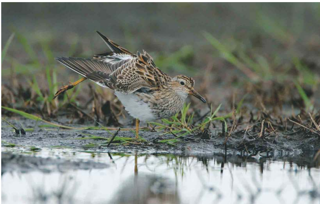
405 Gestreepte Strandloper / Pectoral Sandpiper Calidris melanotos , Annermoeras, Spijkerboor, Drenthe, 4 mei 2004