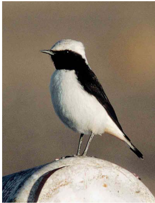
305-306 Western Mourning Wheatear / Westelijke Rouwtapuit Oenanthe halophila , male, Erfoud, Morocco, 25 December 1993 307 Western Mourning Wheatear / Westelijke Rouwtapuit Oenanthe halophila , male, Amezgane, Ouarzazate, Morocco, 12 April 1997