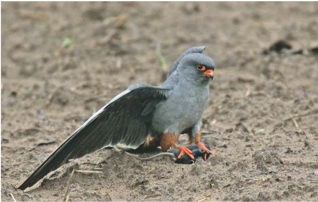
382 Red-footed Falcon / Roodpootvalk Falco vespertinus , adult male, Muhos, Oulu, Finland, 24 May 2004