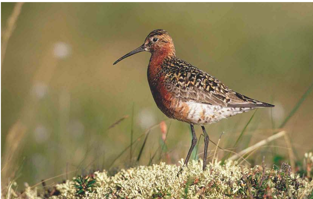
360 Curlew Sandpiper / Krombekstrandloper Calidris ferruginea , Yakutia, Siberia, Russia, June 1999 (Chris Schenk)