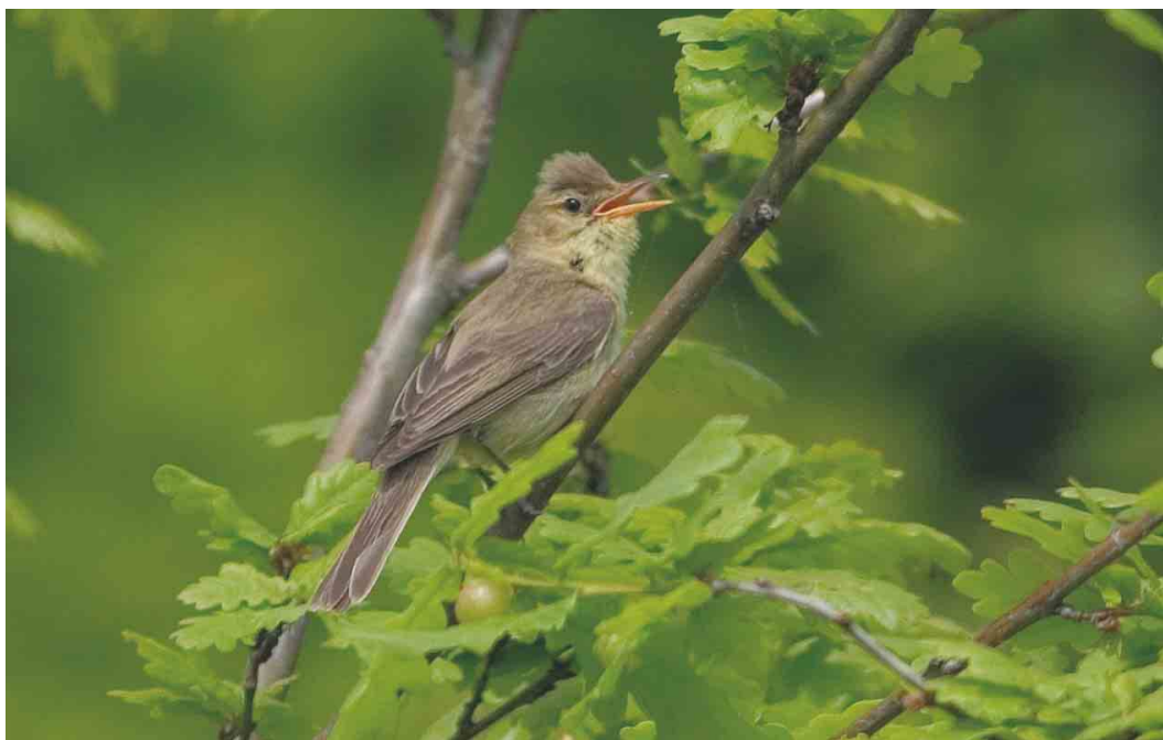
414 Orpheusspotvogel / Melodious Warbler Hippolais polyglotta , Nieuw-Bergen, Limburg, 15 mei 2004 (Patrick Palmen)