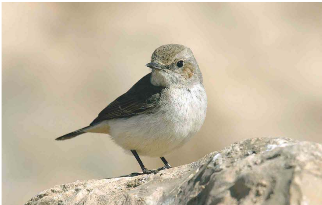
331 Arabian Wheatear / Arabische Rouwtapuit Oenanthe lugentoides , female, Dhofar mountains, Oman, 23 January 2004 (Hanne & Jens Eriksen)