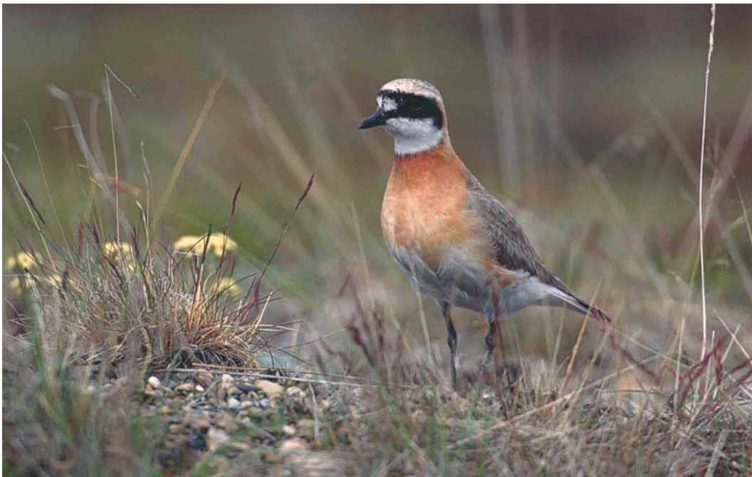
356 Lesser Sand Plover / Mongoolse Plevier Charadrius mongolus , Chukotka, Siberia, Russia, June 2001