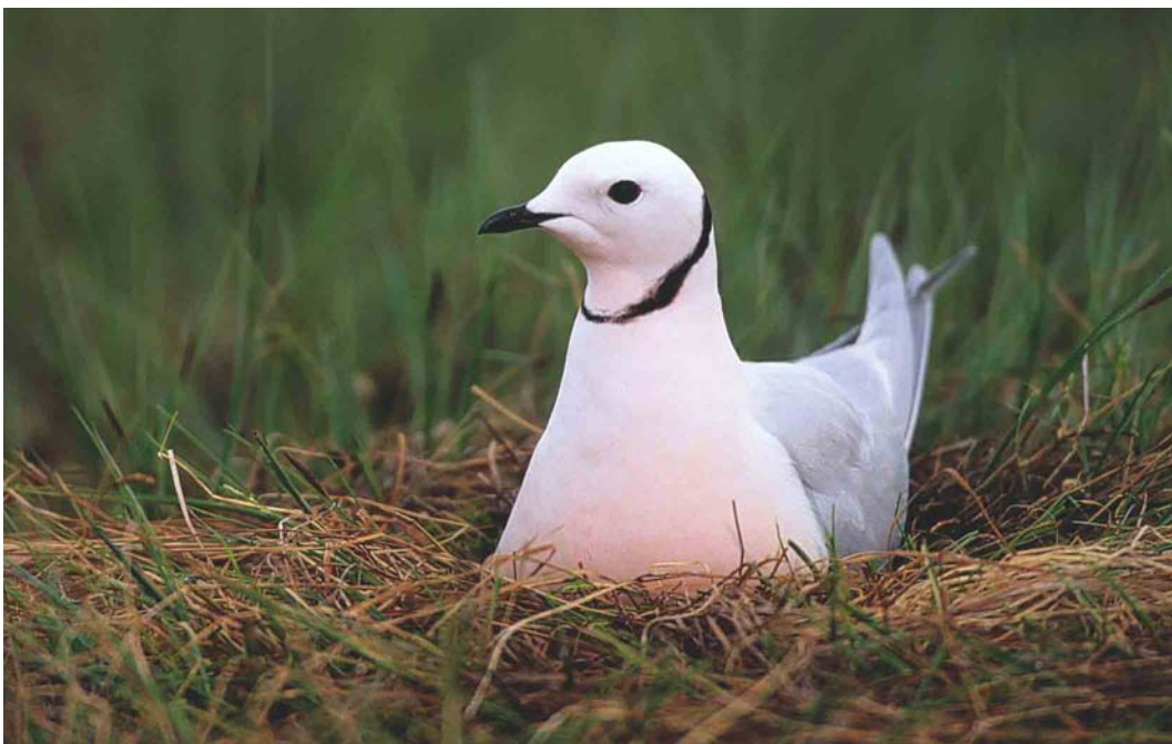
372 Ross's Gull / Ross Meeuw Rhodostethia rosea , Indigirka delta, Yakutia, Siberia, Russia, June 1999