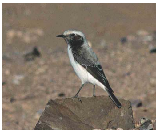
315-316 Western Mourning Wheatear / Westelijke Rouwtapuit Oenanthe halophila , male, c 25 km east of Boumalne Dadès, Morocco, 27 January 2004 317 Western Mourning Wheatear / Westelijke Rouwtapuit Oenanthe halophila , female, Amezgane, Ouarzazate, Morocco, 12 April 1997 318 Western Mourning Wheatear / Westelijke Rouwtapuit Oenanthe halophila , female, Zagora, Morocco, 29 December 1993

and the consequent recognition of four species within the group of mourning wheatears will probably stimulate this research.