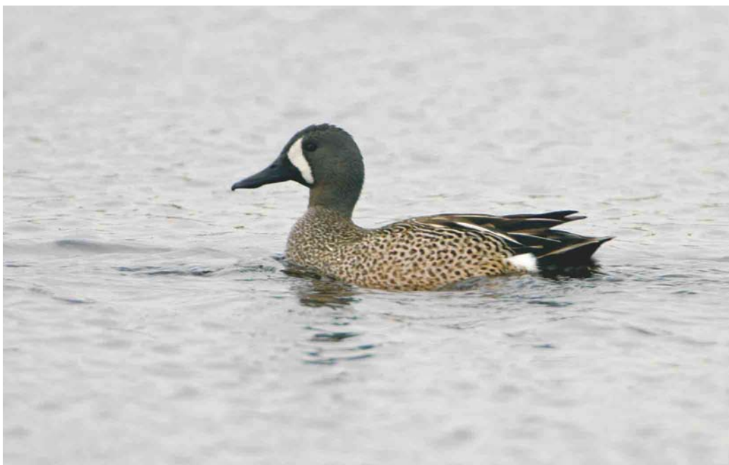
404 Blauwvleugeltaling / Blue-winged Teal Anas discors , mannetje, Groote Vlak, Texel, Noord-Holland, 20 mei 2004