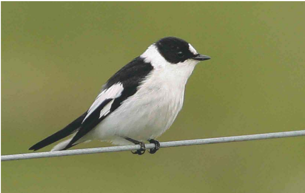
400 Collared Flycatcher / Withalsvliegenvanger Ficedula albicollis , adult male, Muness, Unst, Shetland, Scotland, 2 June 2004