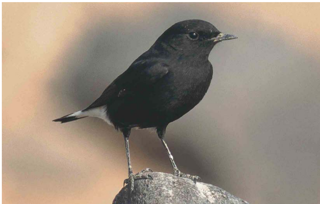
322 'Basalt Wheatear' / 'Basalttapuit', dark morph of Eastern Mourning Wheatear / Oostelijke Rouwtapuit Oenanthe lugens lugens , As Safawi, Jordan, 6 December 1999

rufous or pale cinnamon. Males have a dark crown, often distinctly streaked blackish, resembling lugentoides . There is a distinct black-bellied morph of nominate lugubris resembling 'Basalt Wheatear' (see above) although it also shows a rufous tail and rump. The mantle, back, rump and scapulars of males nominate lugubris are black; the crown and nape are dirty brown and heavily streaked black. Male vauriei differs from white-bellied male nominate lugubris in having the crown and nape pale greyish-buff with black streaks. Male schalowi looks very much like white-bellied male nominate lugubris but the back is very dark brown, instead of pure black, with a less streaked crown which appears uniform dirty brown in many birds. Females of all three taxa are rather different from males as well as from females of all other taxa. They are sooty brown on the throat and chest with darker streaks and have sooty brown upperparts. The underparts are dusky white and, as with the males, the rump, undertail-coverts and tail base are rufous.