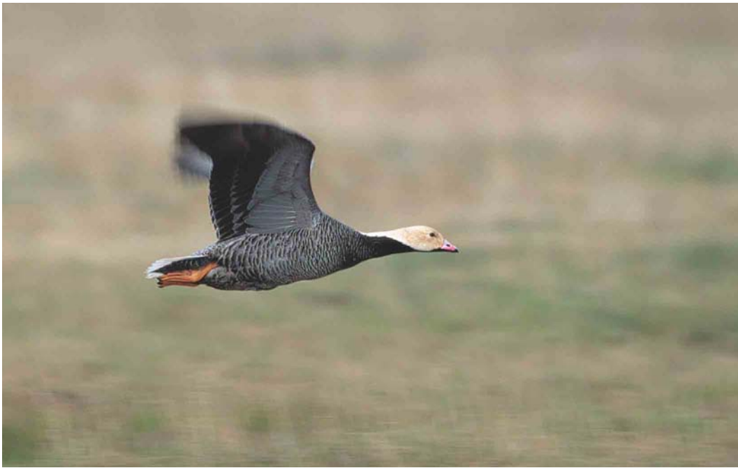
346-347 Emperor Goose / Keizergans Anser canagicus , Chukotka, Siberia, Russia, June 2000 (Chris Schenk)