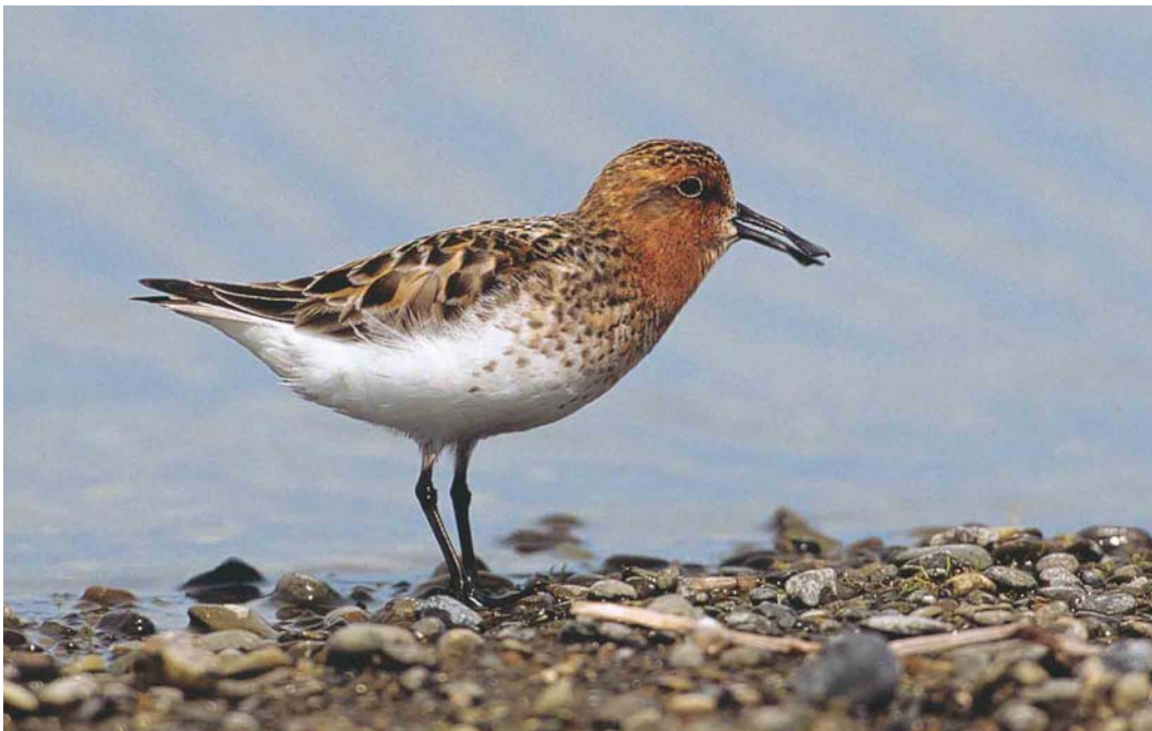
362 Spoon-billed Sandpiper / Lepelbekstrandloper Eurynorhynchus pygmeus , Chukotka, Siberia, Russia, June 2001