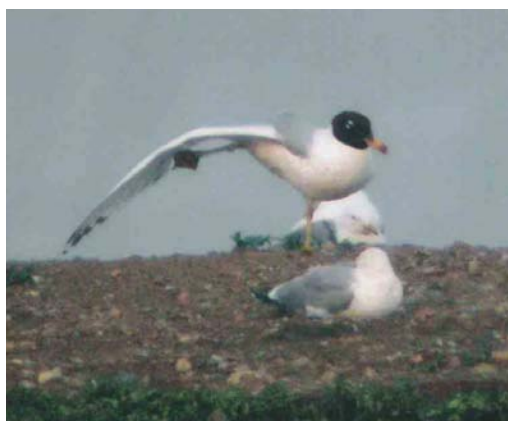
390-391 American Black Duck / Amerikaanse Zwarte Eend Anas rubripes , male, Sodankylä, Finland, 28 May 2004 (Markku Saarinen) 392 Gull-billed Tern / Lachstern Gelochelidon nilotica , adult, Opole, Silesia, Poland, 11 June 2004 (Pawel GebSKI) 393 Pallas's Gull / Reuzenzwartkopmeeuw Larus ichthyæetus , adult, Mietkow reservoir, Wrocław, Silesia, Poland, 10 June 2004 (Pawel GebSKI)

galensis ringed in 2001 was present at Banc d'Arguin, Gironde, from 23 May through June paired with a Sandwich Tern S. sandvicensis but not breeding. Also present here was the unidentified orange-billed tern first seen in summer 2002 and ringed in 2003; this spring, as in 2003, the latter was paired with a Sandwich Tern raising one chick. An Elegant Tern S. elegans was reported at Fouesnant, Finistère, on 9-14 May and another adult was photographed at Banc d'Arguin on 10 June (present for one day, possibly the same individual as the one photographed on 19 July 2003). On 3 July, at least 10 adult Chinese Crested Terns S. bernsteini were encountered on an islet in the Taiwanese held Matsu group within 10 km from the Chinese mainland; before its rediscovery in 2000, this species had not been reliably seen since 1937 (cf Dutch Birding 22: 248-249, plate 249, 2000, 23: 300,