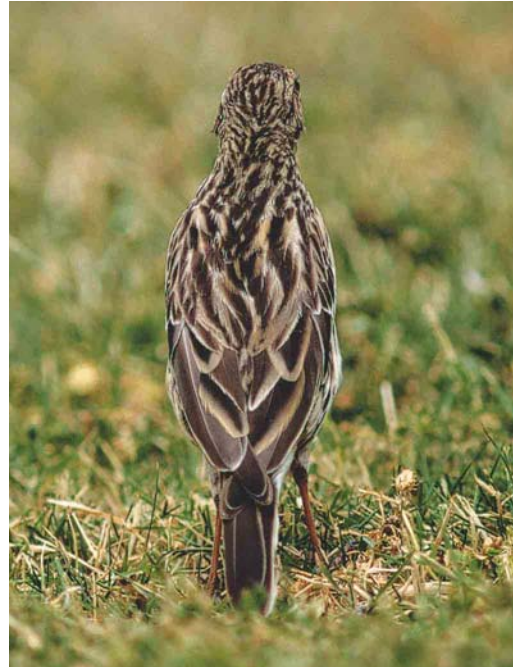
Mystery photograph VIII (March)

tion, harriers show a yellow cere, unlike the mystery bird. Due to the large variation of plumage colouration in both honey buzzards and buzzards, distinguishing these species on plumage features is rather difficult. The bluish cere of the mystery bird, however, leads to an easy elimination of buzzards, as these would show a yellow cere.