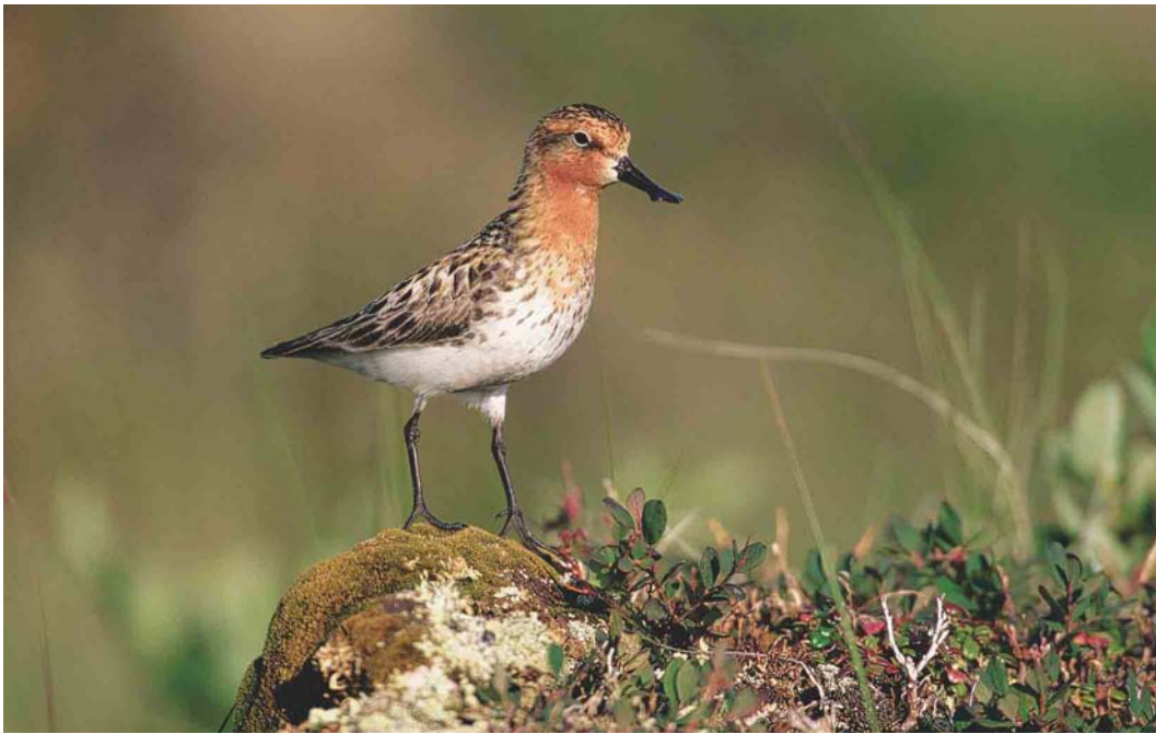
361 Spoon-billed Sandpiper / Lepelbekstrandloper Eurynorhynchus pygmeus , Chukotka, Siberia, Russia, July 2000 (Chris Schenk)