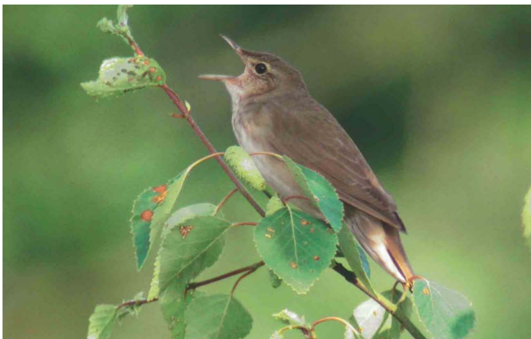
415 Krekelzanger / River Warbler Locustella fluviatilis , De Wieden, Overijssel, 10 juni 2004 (Sander Bot)