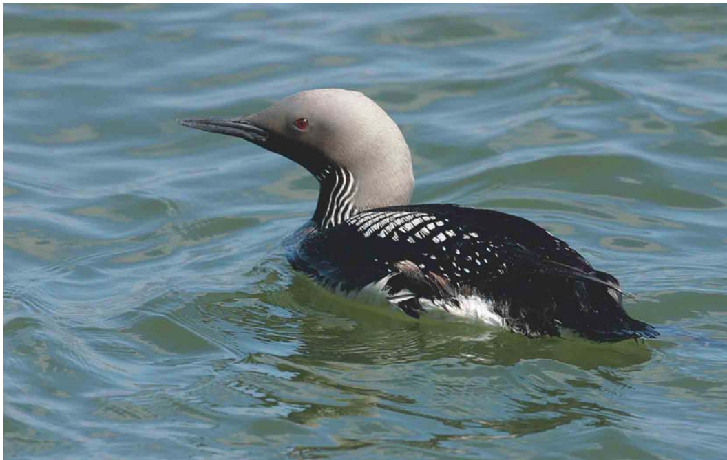
417 Parelduiker / Black-throated Loon Gavia arctica , Oostende, West-Vlaanderen, 5 juni 2004 (Patrick Beirens)

UILEN TOT GORZEN Een Oehoe Bubo bubo bezocht in mei het begijnhof van Arendonk, Antwerpen. De periode was nog goed voor 17 Velduilen Asio flammeus . Op