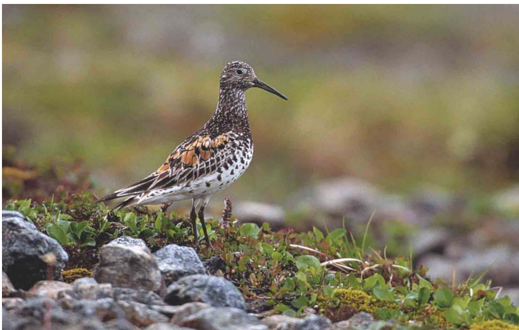
357 Great Knot / Grote Kanoet Calidris tenuirostris , Chukotka, Siberia, Russia, July 2001