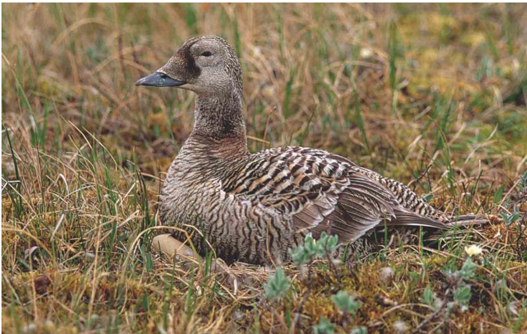
349 Spectacled Eider / Brileider Somateria fischeri , female, Yakutia, Siberia, Russia, July 1999 (Chris Schenk)