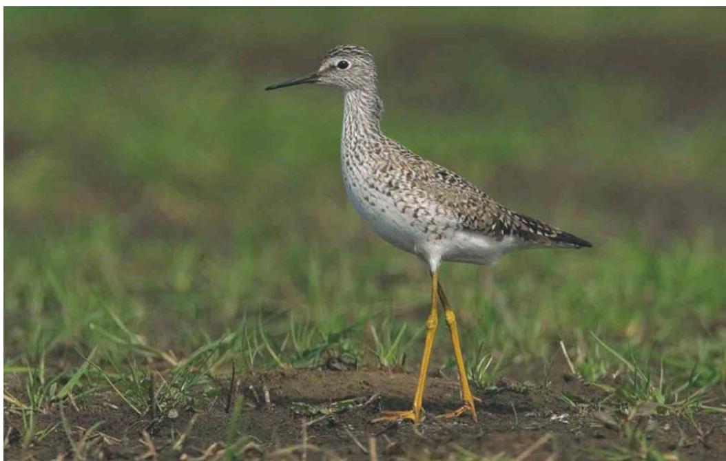
403 Kleine Geelpootruiter / Lesser Yellowlegs Tringa flavipes , Annermoeras, Spijkerboor, Drenthe, 21 mei 2004 (Bas van den Boogaard)