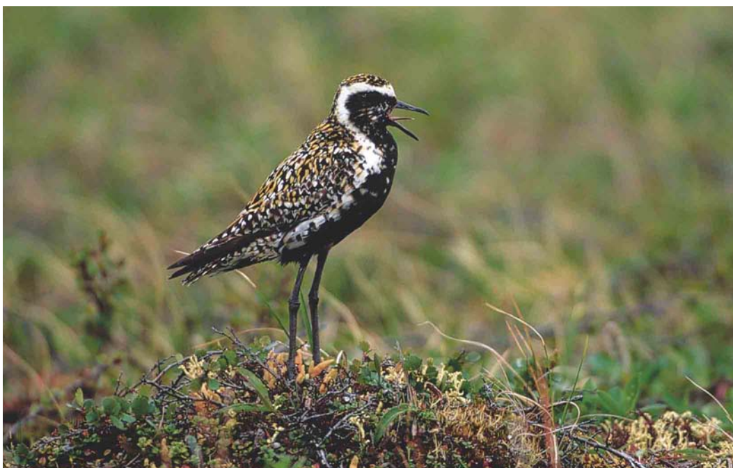
358 Pacific Golden Plover / Aziatische Goudplevier Pluvialis fulva , Yakutia, Siberia, Russia, July 1999