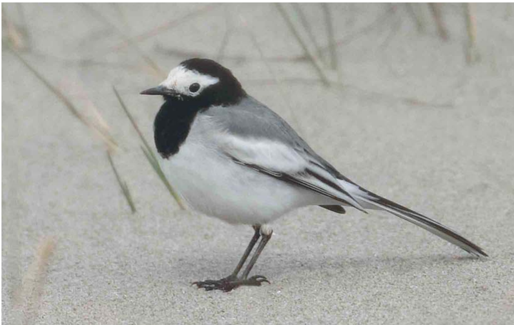
401 Masked Wagtail / Maskerkwikstaart Motacilla personata , first-summer male, Lista, Vest-Agder, Norway, 7 April 2004