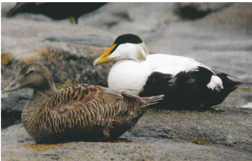
383 Boreal Eider / Noordelijke Eider Somateria mollissima borealis , male, Fanad Head, Donegal, Ireland, 6 June 2004 (Martin Garner)