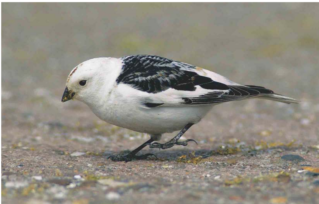
416 Sneeuwgors / Snow Bunting Plectrophenax nivalis , mannetje, Hoornderslag, Texel, Noord-Holland, 23 mei 2004

soorten – waaronder drie exemplaren in de provincie Utrecht (in Maarssenveen, Maartensdijk en de wijk Lunetten, Utrecht) en één in het Vliegenbos in Amsterdam-Noord. Er waren Kleine Vliegenvangers Ficedula parva op 16 mei op Texel en op 18 mei bij Groet, Noord-Holland. In het natuurontwikkelingsgebied Bentwoud nabij Boskoop, Zuid-Holland, werd in de avond van 3 juni een Kleine Klapekster Lanius minor waargenomen, waarvan enkele 10-tallen vogelaars konden meegenieten. Roodkopklauwieren L senator verschenen op 12 en 13 mei op Schiermonnikoog, op 22 mei bij Itteren, Limburg, op 27 mei (een vangst) aan het Veluwemeer bij Elburg, Gelderland, op 29 mei bij Hierden, Gelderland, en in Berkheide bij Wasse-naar, op 30 en 31 mei op De Boschplaat op Terschelling en op 5 juni bij de Lepelaarsplassen, Flevoland. Een adulte Roze Spreeuw Sturnus roseus verbleef van 7 tot 11 mei op Schiermonnikoog en twee adulte passeerden op 10 juni telpost Eemshaven. Dit jaar werden tussen 20 mei en half juni c 20 Roodmussen Carpodacus erythrinus vastgesteld, het merendeel in Noord-Holland, Friesland en Groningen. Een exemplaar in Kollum, Friesland, bleef in ieder geval tot 19 juni. In de categorie vermeldenswaard hoort het mannetje Sneeuwgors Plectrophenax nivalis in zomerkleed dat van 21 tot 27 mei op de parkeerplaats aan de Hoornderslag op Texel verbleef. De waarneming van een Grijze Gors Emberiza cia op Rottumerplaat op 30