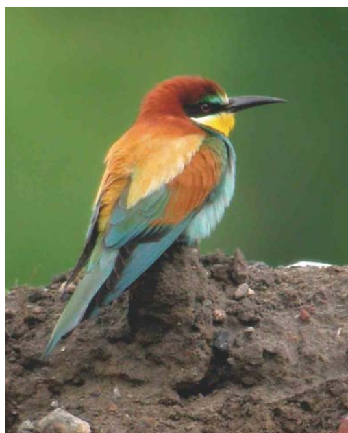
418 Bijeneter / European Bee-eater Merops apiaster , Wachtebeke, Oost-Vlaanderen, 21 mei 2004

niet onbetuigd met waarnemingen in Oud-Turnhout rond 25 mei; bij Manhay, Luxembourg van 27 tot 29 mei; in Kalmthout op 9 en 10 juni; en in Sint-Lambrechts-Woluwe, Vlaams-Brabant, op 9 juni. Van 21 tot ten minste 31 mei bevonden zich twee Huis-kraaien Corvus splendens bij Wachtebeke; het gaat hier om de eerste waarneming voor België. Europese Kanaries Serinus serinus verschenen op 16 mei in Viersel, op 31 mei in Wachtebeke en op 2 juni in Gent. Vanaf 1 juni meldden de eerste Kruisbekken Loxia curvirostra zich aan, als voorbode van een kleine invasie. Een Roodmus Carpodacus erythrinus pleisterde van 29 mei tot 5 juni bij De Panne, West-Vlaanderen. Opmerkelijk laat was de Ijsgors Calcarius lapponicus bij Turnhout op 27 mei. Op 1 mei was er kortstondig een Ortolaan Emberiza hortulana in Leefdaal, Vlaams-Brabant, op 2 mei werden er twee gezien bij Jamoigne, Luxembourg, op 8 mei één in Kallo-Doel, op 9 mei één in Tienen, op 10 mei één langstrekkend bij Eghezée-Longchamps, Liège, en op 28 mei opnieuw één in Kallo-Doel.