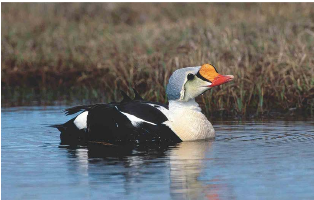
350 King Eider / Koningseider Somateria spectabilis , male, Chukotka, Siberia, Russia, June 2000 (Chris Schenk)