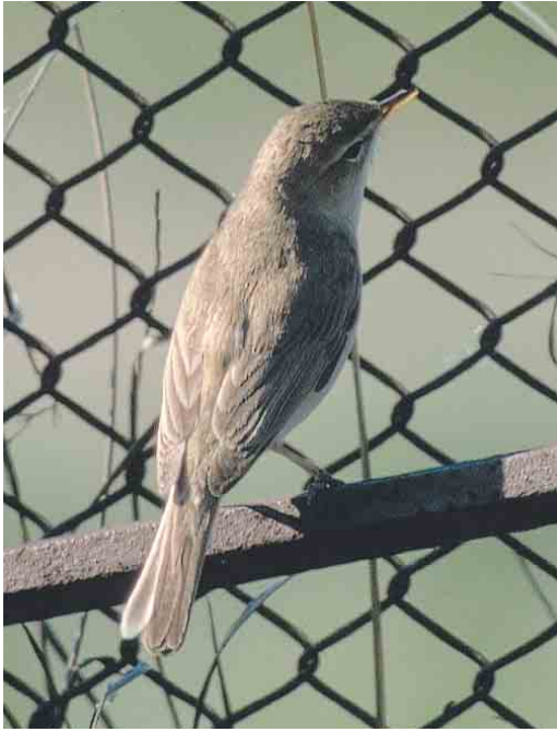
Mystery photograph VII (May)