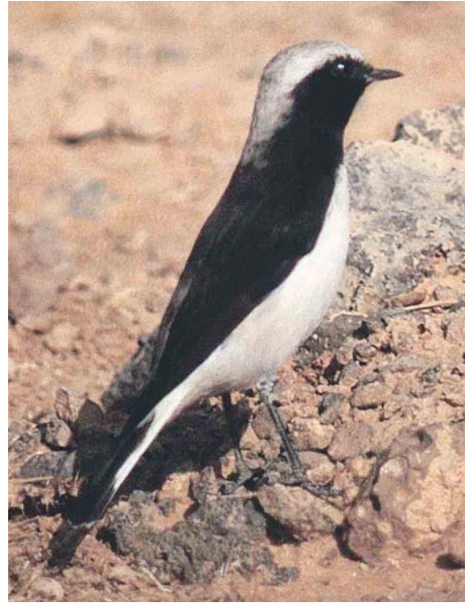
327-329 Eastern Mourning Wheatear / Oostelijke Rouwtapuit Oenanthe lugens , As Safawi, Jordan, December 1999. The dark-streaked crown indicates O. l. persica .