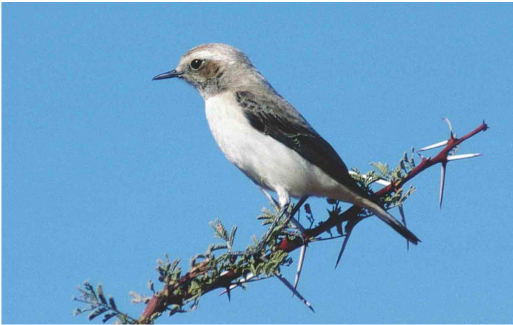
312 Western Mourning Wheatear / Westelijke Rouwtapuit Oenanthe halophila , female, Zagora, Morocco, 29 December 1993 313 Western Mourning Wheatear / Westelijke Rouwtapuit Oenanthe halophila , female, Merzouga, Morocco, 28 January 2004 314 Western Mourning Wheatear / Westelijke Rouwtapuit Oenanthe halophila , female, Merzouga, Morocco, 28 January 2004