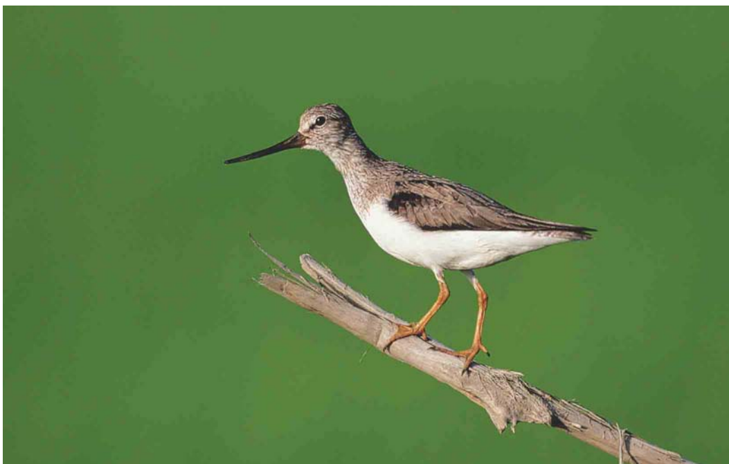
365 Terek Sandpiper / Terekruiter Xenus cinereus , Yakutia, Siberia, Russia, June 1999 (Chris Schenk)