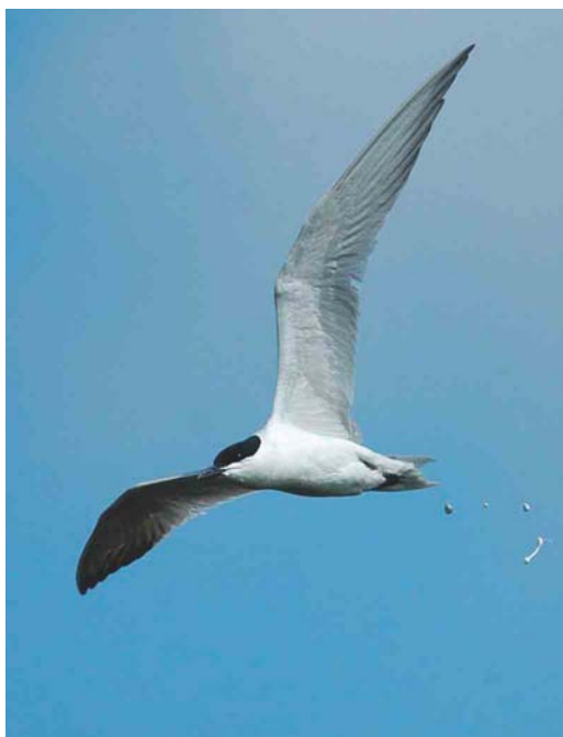
384 Gull-billed Tern / Lachstern Gelochelidon nilotica , Wexford, Ireland, July 2004 (John Murphy)