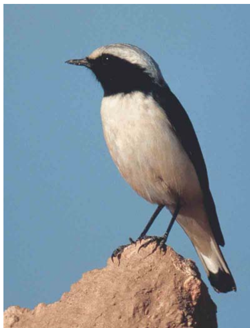
308 Western Mourning Wheatear / Westelijke Rouwtapuit Oenanthe halophila , male, c 25 km east of Boumalne Dadès, Morocco, 27 January 2004 ( Ran Schols ) 309 Western Mourning Wheatear / Westelijke Rouwtapuit Oenanthe halophila , male, El Hamma, Tunisia, 12 December 2003 ( Harm Niesen ) 310 Western Mourning Wheatear / Westelijke Rouwtapuit Oenanthe halophila , female, Zagora, Morocco, 29 December 1993 ( Theo Bakker/Cursorius ) 311 Western Mourning Wheatear / Westelijke Rouwtapuit Oenanthe halophila , female, Merzouga, Morocco, 28 January 2004 ( Ran Schols )