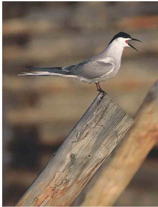
352 Little Curlew / Kleine Regenwulp Numenius minutus , Yakutia, Siberia, Russia, June 1999 (Chris Schenk) 353 Eastern Common Tern / Oostelijke Visdief Sterna hirundo longipennis/tibetana , Chukotka, Siberia, Russia, June 1999 (Chris Schenk) 354 Baikal Teal / Siberische Taling Anas formosa , male, Yakutia, Siberia, Russia, June 1999 (Chris Schenk)