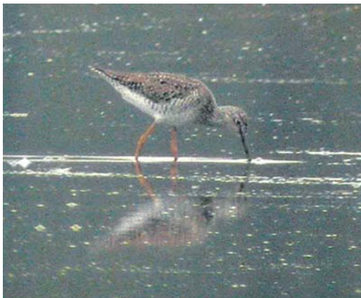
419 Grote Geelpootruiter / Greater Yellowlegs Tringa melanoleuca, Hilversumse Bovenmeent, Noord-Holland, 25 mei 2004