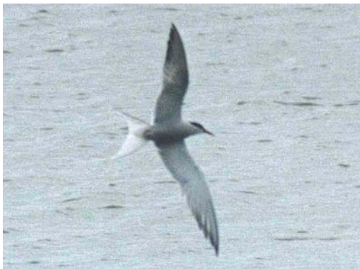
344-345 Melanistische Visdief / melanistic Common Tern Sterna hirundo , tussen Deventer en Olst, Overijssel, april 2001 (Edwin Winkel)

MELANISTIC COMMON TERN NEAR DEVENTER IN APRIL 2001 In late April 2001, an unusually dark Common Tern Sterna hirundo was photographed among normally coloured Common Terns near Deventer, Overijssel, the Netherlands. Melanism in terns is rare and has only