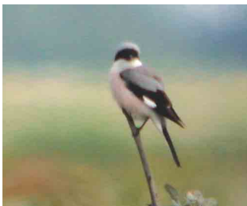
406 Iberische Tjiftjaf / Iberian Chiffchaff Phylloscopus ibericus , Vliegenbos, Amsterdam-Noord, Noord-Holland, 5 mei 2004 (Garry Bakker) 407 Blauwvleugeltaling / Blue-winged Teal Anas discors , mannetje, Grootte Vlak, Texel, Noord-Holland, 18 mei 2004 (Willem Hartholt) 408 Bonapartes Strandloper / White-rumped Sandpiper Calidris fuscicollis , De Hamert, Limburg, 22 mei 2004 (Ran Schols) 409 Steltstrandloper / Stilt Sandpiper Calidris himantopus , met Kempphaan / Ruff Philomachus pugnax , Ezumakeeg, Friesland, 16 mei 2004 (Bart-Jan Prak) 410 Roodkopklauwier / Woodchat Shrike Lanius senator , Itteren, Limburg, 22 mei 2004 (Ran Schols) 411 Kleine Klapekster / Lesser Grey Shrike Lanius minor , Bentwoud, Zuid-Holland, 3 juni 2004 (Adri de Groot)