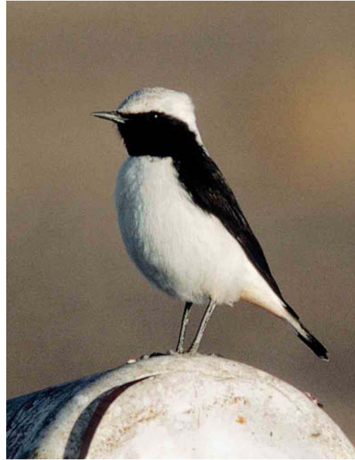
305-306 Western Mourning Wheatear / Westelijke Rouwtapuit Oenanthe halophila , male, Erfoud, Morocco, 25 December 1993 307 Western Mourning Wheatear / Westelijke Rouwtapuit Oenanthe halophila , male, Amezgane, Ouarzazate, Morocco, 12 April 1997