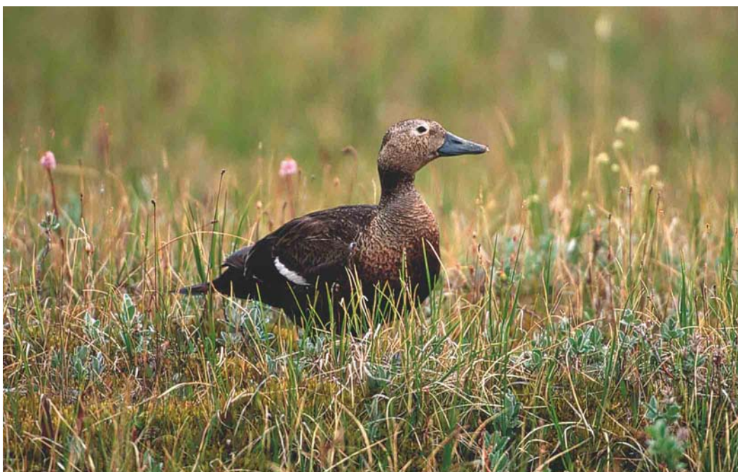
351 Steller's Eider / Stellers Eider Polysticta stelleri , female, Indigirka delta, Yakutia, Siberia, Russia, June 1999 (Chris Schenk)