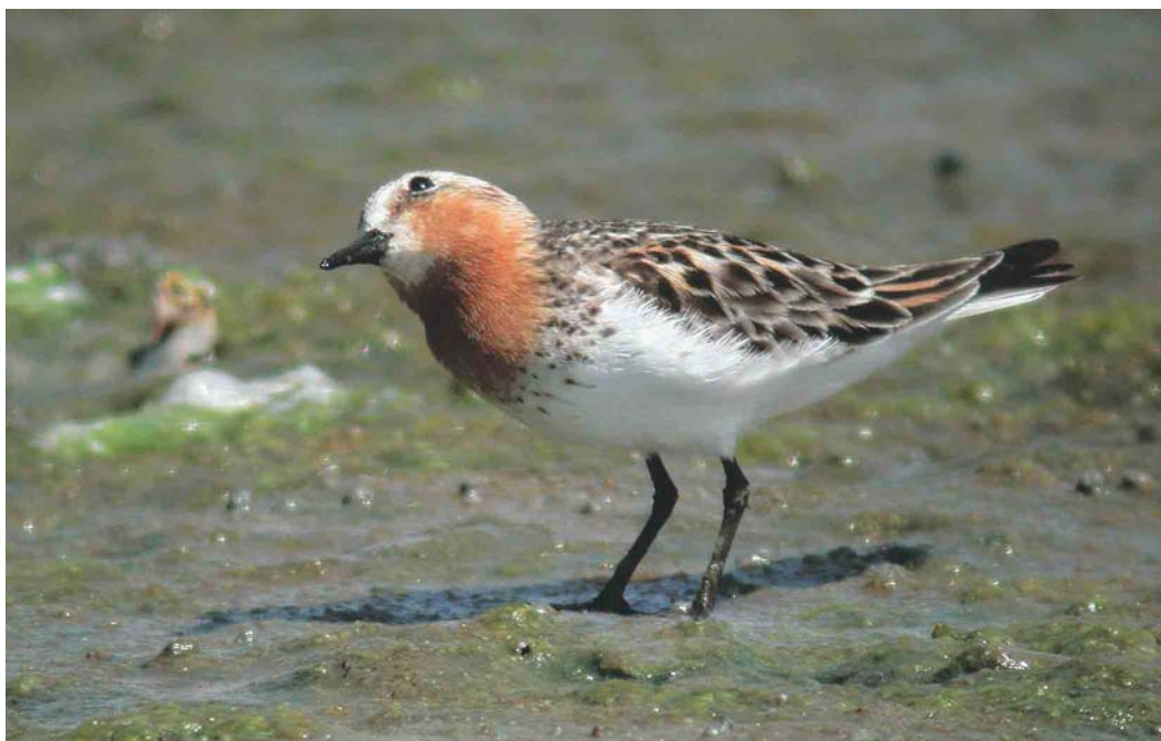
420 Roodkeelstrandloper / Red-necked Stint Calidris ruficollis , adult, Slikken van Flakkee, Zuid-Holland, 6 juli 2004

deel van dit onderzoek is het bepalen van het broedsucces van Bontbekplevieren Charadrius hiaticula en Strandplevieren C alexandrinus op de Slikken van Flakkee, Goeree-Overflakkee, Zuid-Holland. Na een rustig begin van de telling op 6 juli 2004 zagen René van Loo en ik omstreeks 14:00 ter hoogte van het zogeheten Zanddepot de eerste grote groep met c 40 Bontbekken en c 35 Strandplevieren. Dergelijke groepen worden altijd omzichtig benaderd en al van grote afstand afgezocht op de aanwezigheid van gekleurde exemplaren en net 'uitgevlogen' jongen. Tijdens het telwerk zag ik in de groep een kleinere strandloper waarna de woorden 'hé René, daar staat een adulte Roodkeelstrandloper' een voorlopig einde aan de telling maakten. De determinatie als Roodkeelstrandloper Calidris ruficollis was eenvoudig. De combinatie van rode wang, keel en bovendeel van de borst (kleur als van zomerkleed Krombekstrandloper C ferruginea ), omzoomd door bruinzwarte vlekjes op een helderwitte ondergrond, met een grotendeels grijze vleugel sloot alle andere Calidris -soorten uit. Buiten de kleedkenmerken vielen ook de bouw en manier van foerageren op. In zijaanzicht bleek de vogel erg langgerekt en recht van voren bijzonder 'plat' en ovaal, een bouw die eerder aan een Bonapartes Strandloper C fuscicollis dan aan een Kleine Strandloper C minuta deed denken. Tijdens het foerageren viel de meer plevierachtige manier van lopen op. Na een kort telefoontje haastten