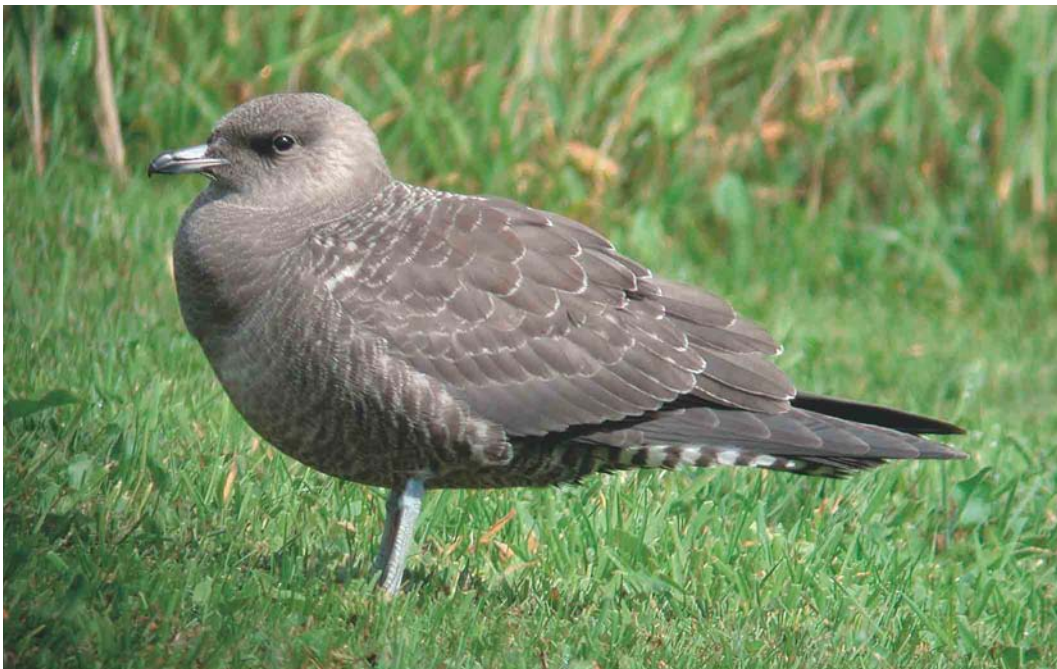
498 Kleinste Jager / Long-tailed Jaeger Stercorarius longicaudus , juveniel, Budel-Dorplein, Noord-Brabant, 26 augustus 2004