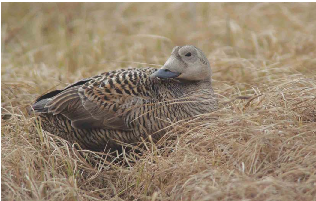
460 Spectacled Eider / Brileider Somateria fischeri , adult female, on nest, Deadhorse, Prudhoe Bay, Alaska, USA, 14 June 2004 (René Pop)