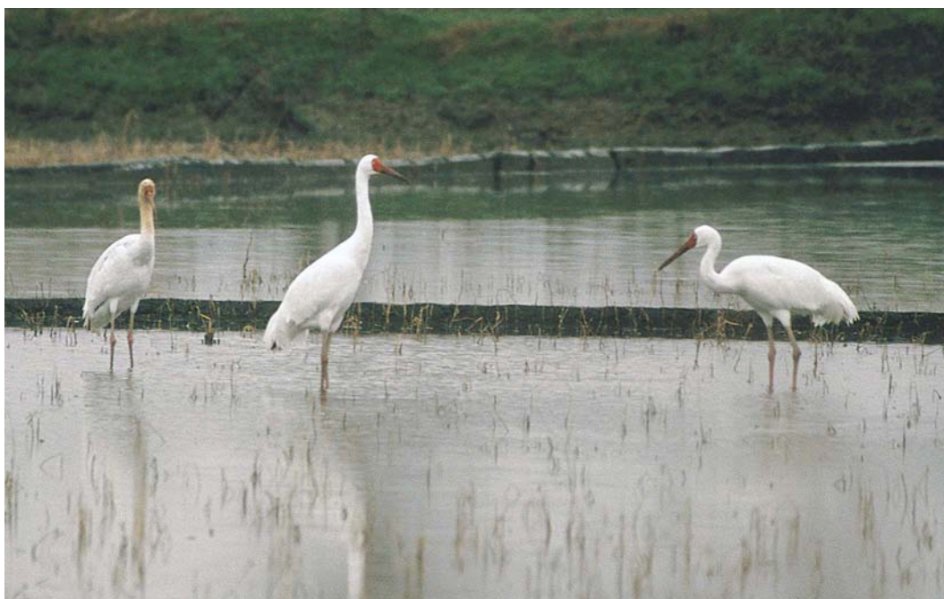
430 Siberian Cranes / Siberische Witte Kraanvogels Grus leucogeranus , pair with young, Fereidoonkenar Damgah, Mazandaran, Iran, 19 January 2004 (Mark Zekhuis)