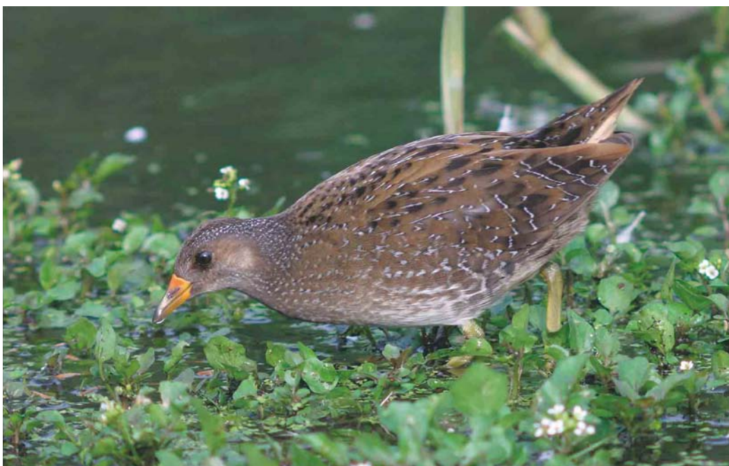
492 Porseleinhoen / Spotted Crake Porzana porzana , Starrevaart, Leidschendam, Zuid-Holland, 18 augustus 2004