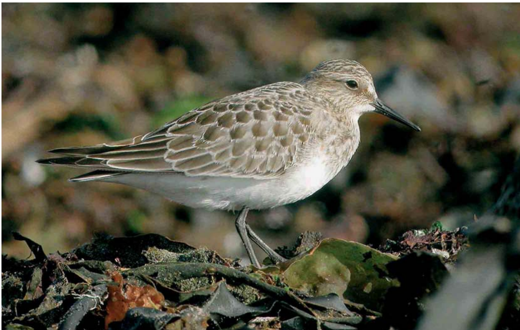
472 Baird's Sandpiper / Bairds Strandloper Calidris bairdii , juvenile, Sein, Finistère, France, 14 September 2004 (Aurélien Audevard)