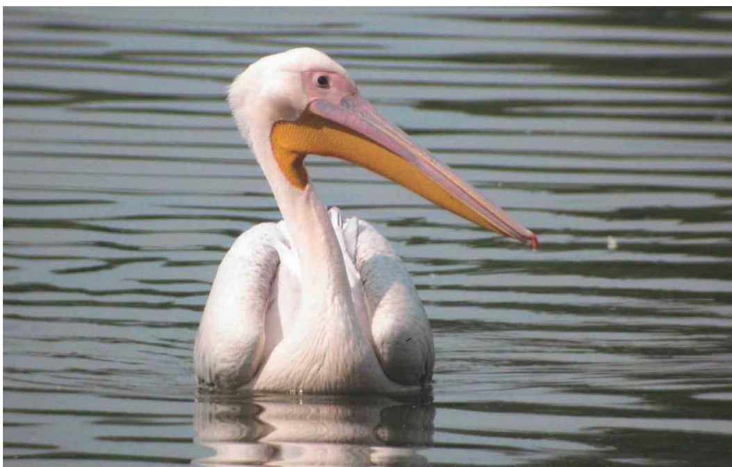
468 Great White Pelican / Roze Pelikaan Pelecanus onocrotalus , Raszyn fish ponds, Warszawa, Poland, 6 August 2004