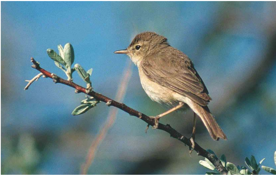
465 Booted Warbler / Kleine Spotvogel Acrocephalus caligatus , Karazhar, Tengiz, Aqmola Oblast, Kazakhstan, 20 May 2003. Note contrasting tertials and rusty-tinged flanks and upperbreast.

Note, however, that the dark crown-sides may be influenced shadow effects and that dark crown-sides can also appear faintly in Sykes's. In addition, in Sykes's, the supercilium is often shorter and ending just behind the rear edge of the eye.