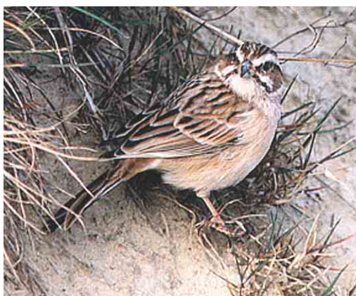
453 Purple-backed Starling / Daurische Spreeuw Sturnus sturninus , Duiven, Gelderland, 5 November 1999 454 Zijdespreeuw / Red-billed Starling Sturnus sericeus , Rottumerplaat, Groningen, August 2004 455 Long-tailed Rosefinch / Langstaartroodmus Uragus sibiricus , first-winter male, Hoek van Holland, Zuid-Holland, 31 October 1999 456 Meadow Bunting / Weidegors Emberiza cioides , Castenray, Limburg, 16 April 2000

third British records, also placed in Category D1, concern males at Ponteland, Northumberland, England, from 26 August to 5 September 1997 and at Durness, Highland, Scotland, on 24- 27 September 1998.