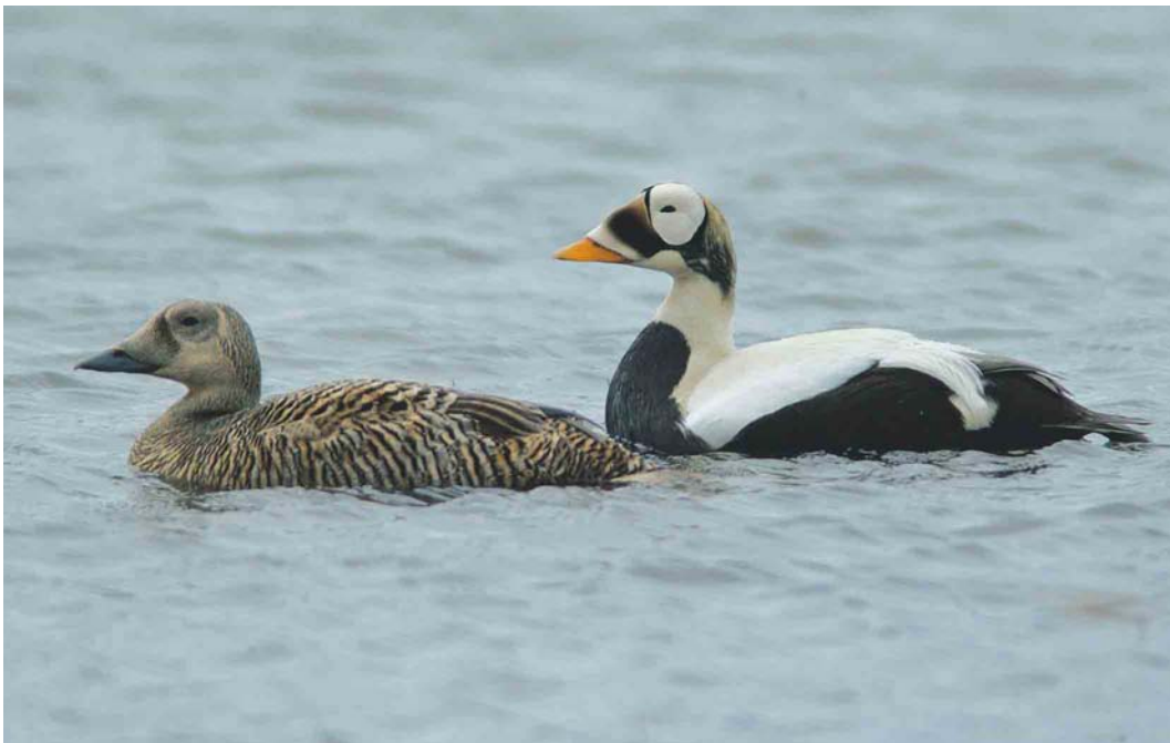
462 Spectacled Eiders / Brileiders Somateria fischeri , pair, Deadhorse, Prudhoe Bay, Alaska, USA, 13 June 2004