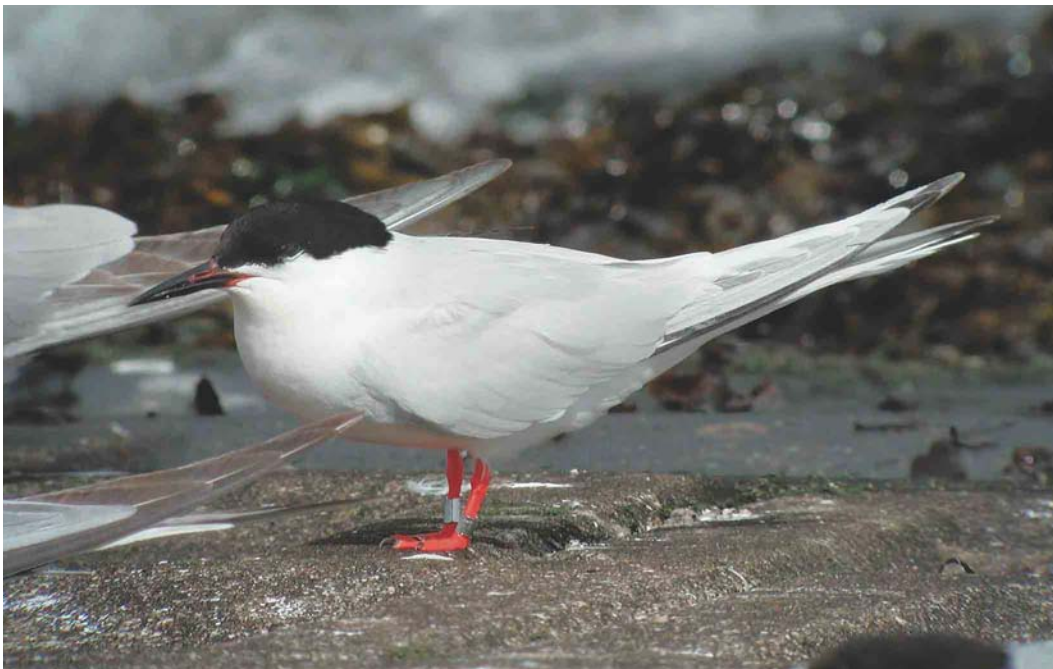
490 Dougalls Stern / Roseate Tern Sterna dougallii , adult, Neeltje Jans, Zeeland, 13 augustus 2004