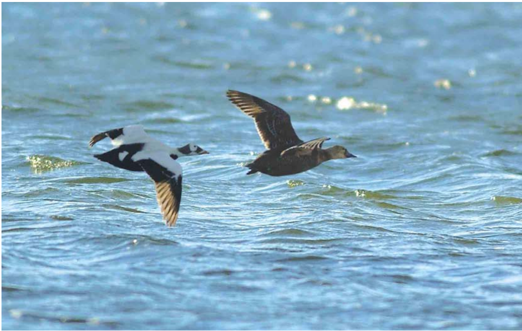
461 Spectacled Eiders / Brileiders Somateria fischeri , pair, Deadhorse, Prudhoe Bay, Alaska, USA, 12 June 2004