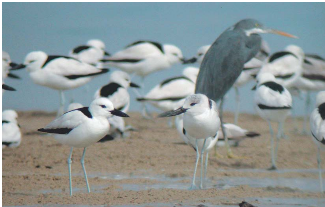
425 Crab-plovers / Krabplevieren Dromas ardeola , with Indian Reef Egret / Rode-Zeerifreiger Egretta gularis schistacea , Hara protected area, Hormozgan, Iran, 11 January 2004

den Berg 2004). Up to 12 Caspian Stonechats Saxicola maurus variegatus , 10 Plain Leaf Warblers Phylloscopus neglectus and 242 Dead Sea Sparrows Passer moabiticus were recorded. Surprisingly, 35 Mesopotamian Crows Corvus cornix capellanus were seen. This taxon, sometimes treated as a separate species, is restricted to an area along the Euphrates in south-eastern Iraq and south-western Iran and has a contrasting black-and-white plumage, with the grey parts of Hooded Crow C. c. cornix much paler and almost white (cf Madge & Burn 1993). Near Bostan, an Oriental Pratincole Glareola maldivarum was discovered on 18 January, providing the first observation for Iran. It was studied for c 20 min under good light conditions. Unfortunately, the distance was too large to take photographs and to see subtle identification characters as primary pattern, colour of the underparts, leg length and bill pattern. A description is given in appendix 1. At Aflok basin, a probable Basra Reed Warbler Acrocephalus griseldis was observed. This would be the second sighting in winter after one reported in February 1998. The bird was observed for c 2 min at a distance of 20 m. A description is given in appendix 2. At Karun fishponds, a juve-