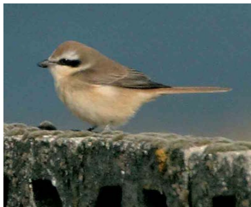
484-485 Purple Martin / Purperzwaluw Progne subis , juvenile, Butt of Lewis, Lewis, Outer Hebrides, Scotland, 6 September 2004 486-487 Purple Martin / Purperzwaluw Progne subis , juvenile, Butt of Lewis, Lewis, Outer Hebrides, Scotland, 6 September 2004 488 White-winged Lark / Witvleugelleeuwerik Melanocorypha leucoptera , female, Vardø, Finnmark, Norway, 19 July 2004 489 Brown Shrike / Bruine Klauwier Lanius cristatus , Skaw, Whalsay, Shetland, 22 September 2004