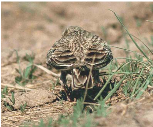
Mystery photograph IX (May)

web. Using these characters, the mystery bird can be safely identified as a Red-throated Pipit.