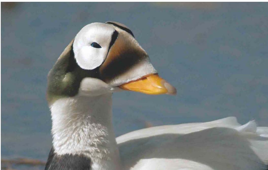
458 Spectacled Eider / Brileider Somateria fischeri , adult male, Deadhorse, Prudhoe Bay, Alaska, USA, 14 June 2004