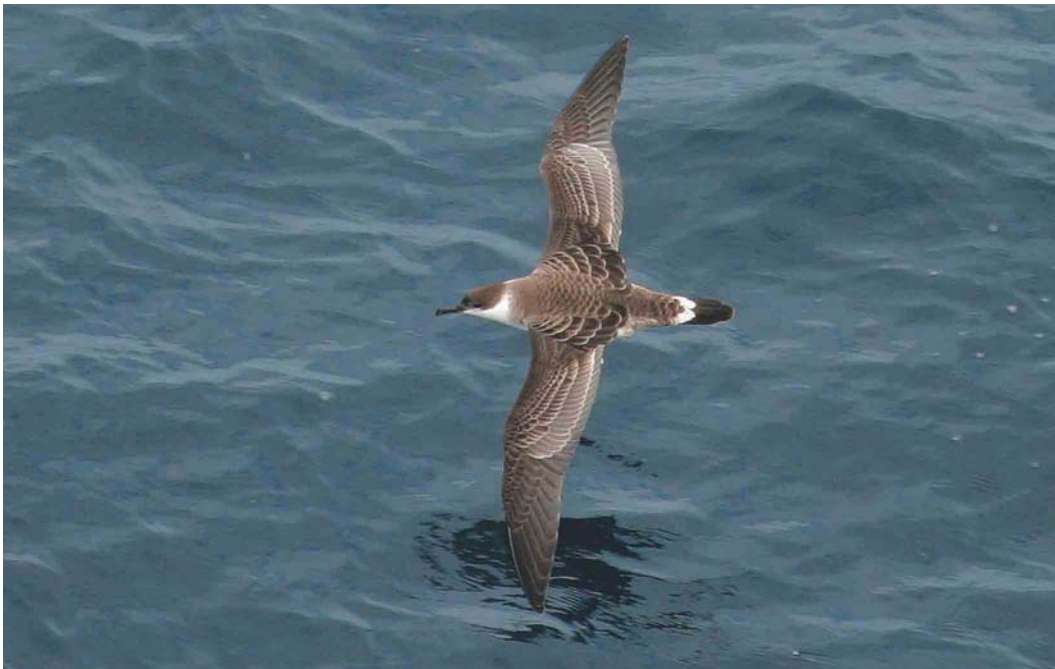
473 Great Shearwater / Grote Pijlstormvogel Puffinus gravis , Bay of Biscay, 10 miles north-west of Bilbao, Spain, 23 August 2004