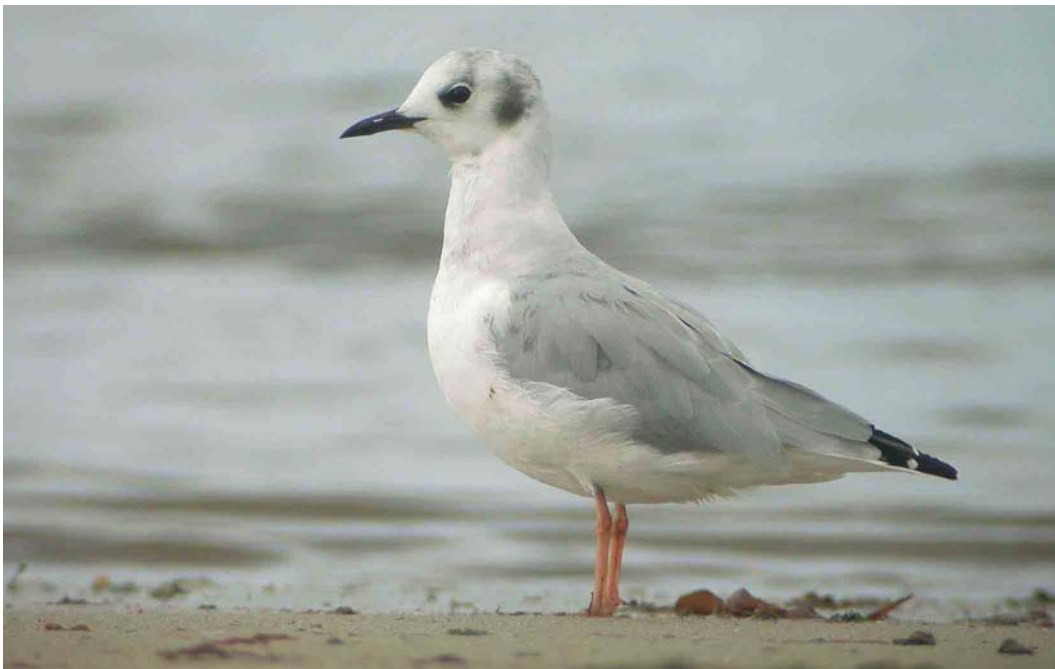
474 Bonaparte's Gull / Kleine Kokmeeuw Larus philadelphia , Porspaul, Lampaul-Plouarzel, Finistère, France, 19 September 2004 (Aurélien Audevard)