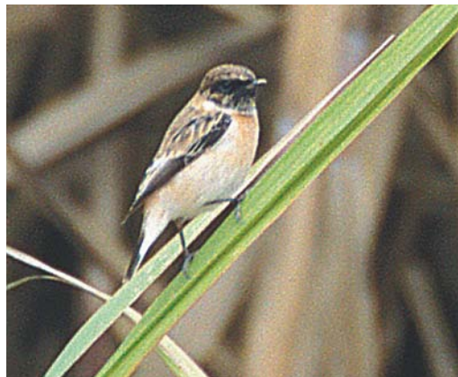
432 Breeding site of Brown Fish Owl Ketupa zeylonensis , Gaz, south of Sirik, Hormozgan, Iran, 18 January 2004 (Rob Felix). The nest cavity is the black spot right below the tree just left of the centre. 433 Black-winged Kite / Grijze Wouw Elanus caeruleus , juvenile, Karun fish ponds, Khuzestan, Iran, 22 January 2004 (Harvey van Diek) 434 Mesopotamian Crow / Mesopotamse Kraai Corvus cornix capellanus , near Hoveyzeh, Khuzestan, Iran, 19 January 2004 (Harvey van Diek) 435 Caspian Stonechat / Kaspische Roodborsttapuit Saxicola maurus variegatus , Amir Kabir sugar cane farm, Ahvaz, Khuzestan, Iran, 15 January 2004 (Harvey van Diek)