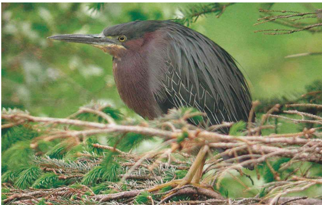
467 Green Heron / Groene Reiger Butorides virescens , Hali, Suðursveit, Iceland, 3 June 2004 (Yann Kolbeinnson)