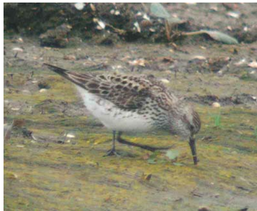
503 Zwarte Wouw / Black Kite Milvus migrans , Kennemermeer, IJmuiden, Noord-Holland, 10 augustus 2004 504 Ortolaan / Ortolan Bunting Emberiza hortulana , Zuidpier, IJmuiden, Noord-Holland, 18 augustus 2004 505 Breedbekstrandloper / Broad-billed Sandpiper Limicola falcinellus , adult, IJdoorn, Noord-Holland, 12 juli 2004 506 Bonapartes Strandloper / White-rumped Sandpiper Caldidris fuscicollis , Ezumakeeg, Friesland, 12 juli 2004

en voornamelijk in het IJsselmeergebied. Pleisterplaatsen (met maxima in augustus) waren bijvoorbeeld 13 bij Delfzijl, Groningen, zes in de Workumerwaard, vier op de Steile Bank en vier bij Den Oever. Op 29 juli vloog een Zwarte Zeekoet Cephus grylle langs Camperduin.