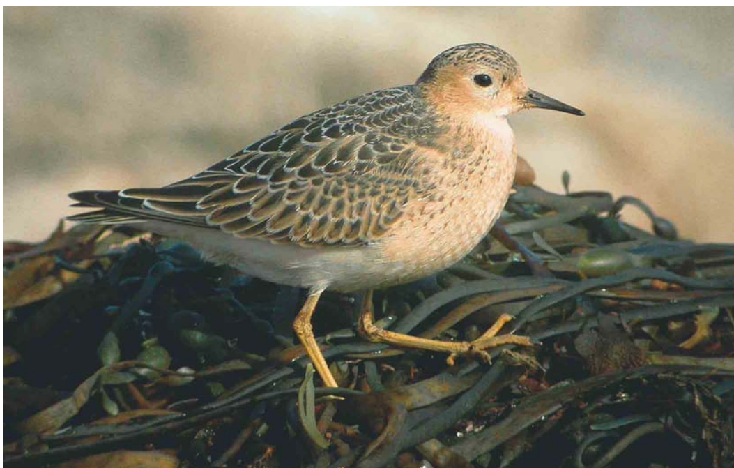
471 Buff-breasted Sandpiper / Blonde Ruitter Tryngites subruficollis , juvenile, Sein, Finistère, France, 13 September 2004