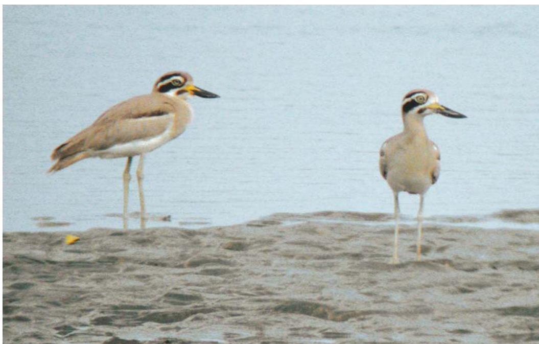
424 Great Thick-knees / Grote Grielen Esacus recurvirostris , Rud-e-Shur, Hormozgan, Iran, 14 January 2004