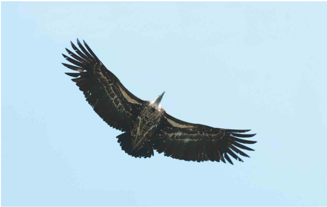
447-448 Rüppell's Griffon Vulture / Rüppells Gier Gyps rueppellii , Reeuwijk, Zuid-Holland, 21 April 2004

Probable escapes in the Netherlands: part 2