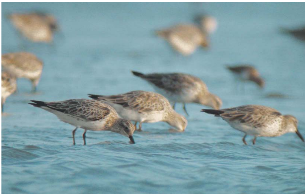
423 Great Knots / Grote Kanoeten Calidris tenuirostris , Tiab, Hormozgan, Iran, 15 January 2004