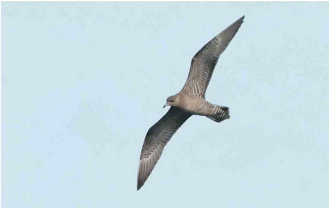
497 Kleinste Jager / Long-tailed Jaeger Stercorarius longicaudus , juveniel, Budel-Dorplein, Noord-Brabant, 21 augustus 2004 ( Ran Schols )