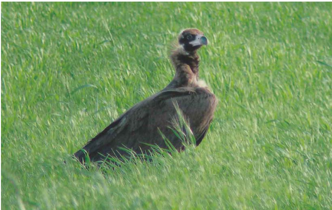
470 Eurasian Black Vulture / Monniksgier Aegypius monachus , Lancenieki, Tukums, Latvia, 16 June 2004 (Karlis Millers)