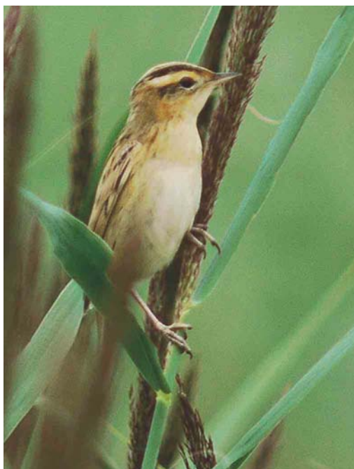
508 Waterrietzanger / Aquatic Warbler Acrocephalus paludicola , Bakkersdam, Petten, Noord-Holland, 7 augustus 2004 (Harm Niesen)

men op 18 en van 29 tot 31 augustus bij Stellendam, op 23 augustus in het Zwanenwater, Noord-Holland, en op 29 augustus bij Cadzand-Bad, Zeeland. De vogel van het Zwanenwater was daar naar verluidt al vanaf april aanwezig. Er waren Graszangers Cisticola juncidis aanwezig op 7 en 21 juli en 3 en 28 augustus bij Westkapelle, op 16 juli – maar vermoedelijk de hele periode – in het Verdronken Land van Saeftinge, vanaf 18 juli één en in augustus minstens vier op het schor bij Hoofdplaat en het Paulinaschor, Zeeland, op 24 juli in de Lauwersmeer, en op 4 en 11 augustus bij Westenschouwen, Zeeland. De drie Orpheusspottvogels Hippolais polyglotta bleven tot 4 juli bij De Weerribben, Overijssel, en bij Terziet, Limburg, en tot 5 juli bij Ter Apel, Groningen. Op 29 juli werd een Struikrietzanger Acrocephalus dumetorum geringd op Schiermonnikoog. Vanaf die datum werden c 40 Waterrietzangers A. paludicola vastgesteld waarvan er 18 werden gevangen en geringd; de hotspot wat betreft vangsten was het Verdronken Land van Saeftinge. De Bakkersdam bij Petten, Noord-Holland, en het Kennemermeer waren de plaatsen waar er meerdere werden gezien, met dagmaxima van drie. Sperwergrasmussen Sylvia nisoria werden vastgesteld op 2 augustus (vangst) te Westenschouwen, op 9 augustus (vangst) op Schiermonnikoog, op 11 augustus (vangst) in De Kennemerduinen, Noord-Holland, op 14, 15 en 16 augustus bij Westkapelle, op 15 augustus op Texel, op