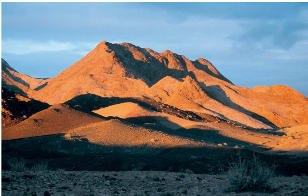
422 Sunset near Touran, Semnan, Iran, 27 January 2004

The national language is Farsi and, although only few people speak English, Iran appears to be a very hospitable country. Travelling must be done by public transport or organized tours, since car rental is almost impossible and traffic is