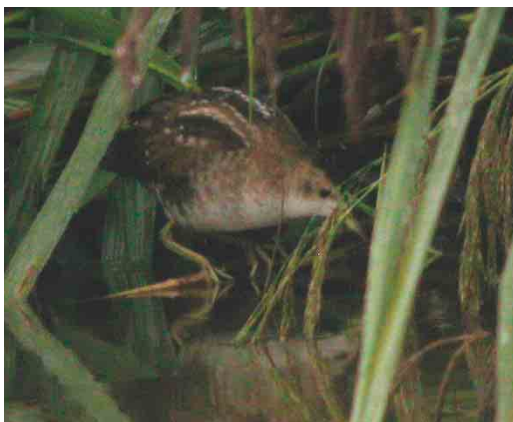
509 Klein Waterhoen / Little Crane Porzana parva , Hologne, Liège, 27 augustus 2004 (Vincent Legrand)