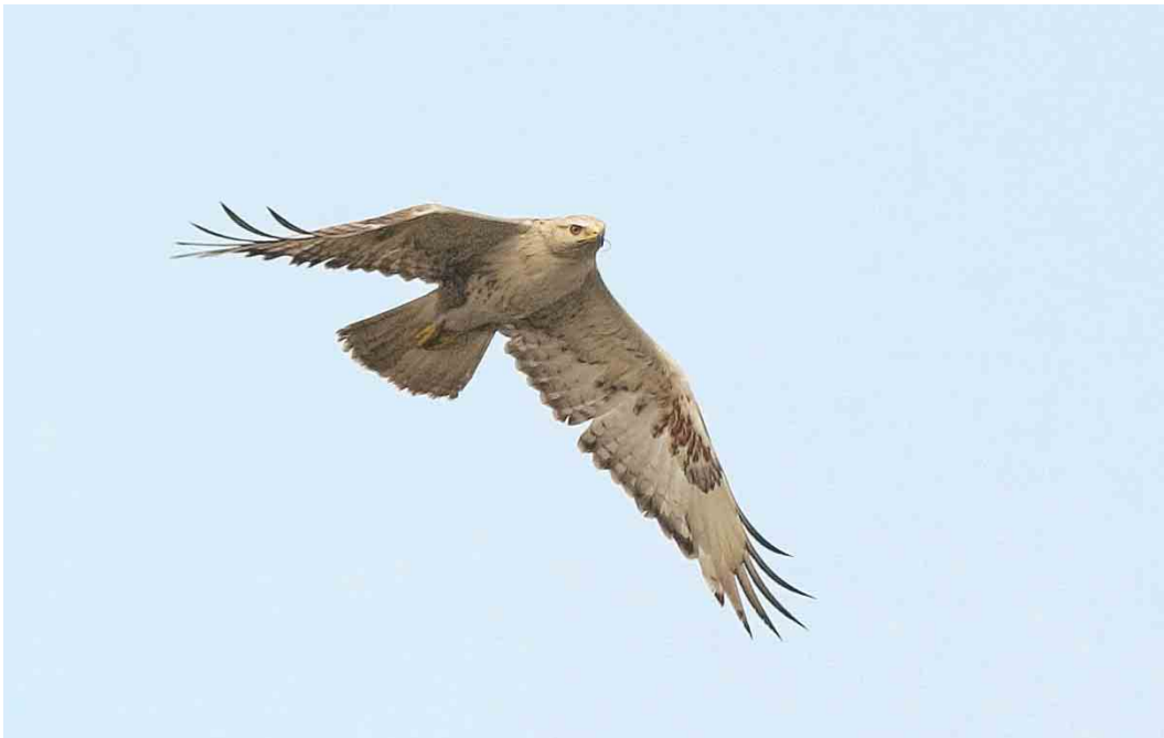
469 Long-legged Buzzard / Arendbuizerd Buteo rufinus , Espoo, Finland, 8 July 2004, 21 July 2004