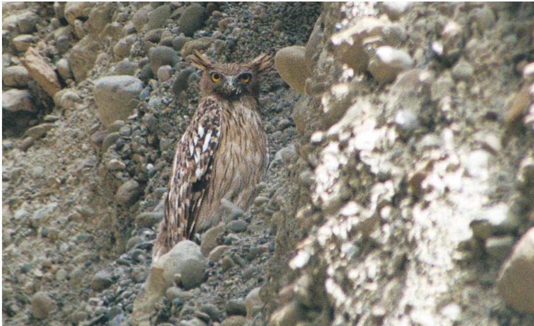
431 Brown Fish Owl / Bruine Visuil Ketupa zeylonensis , Gaz, south of Sirik, Hormozgan, Iran, 8 April 2004

After three weeks, we had seen many birds and counted most of them. The search for Slender-billed Curlew failed but more surveys are needed to make sure whether the species still exists. In addition, waterbird counts are paramount in the next years since Iran is very important for wintering waders and ducks.