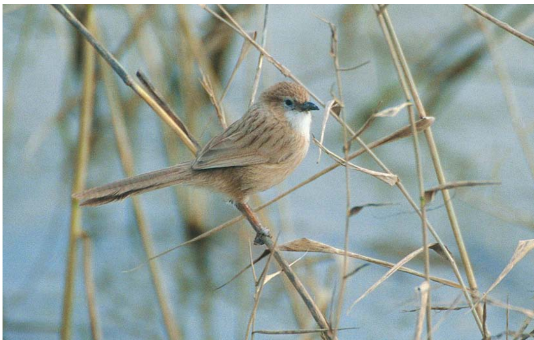
429 Iraq Babbler / Iraakse Babbelaar Turdoidea altirostris , Horeh Bamdej, Khuzestan, Iran, 23 January 2004 (Harvey van Diek)