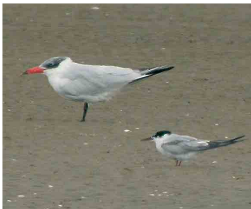
499 Witwangstern / Whiskered Tern Chlidonias hybrida , adult, Budel-Dorplein, Noord-Brabant, 12 augustus 2004 (Rob G Bouwman) 500 Lachstern / Gull-billed Tern Gelocheilidon nilotica , Schagerbrug, Noord-Holland, 17 augustus 2004 (Harm Niesen) 501 Ringsnavelmeeuw / Ring-billed Gull Larus delawarensis , adult, Goes, Zeeland, 23 augustus 2004 (Harm Niesen) 502 Reuzenster / Caspian Tern Sterna caspia , met Visdief / Common Tern S hirundo , Stellendam, Zuid-Holland, 30 augustus 2004 (Rudi Dujardin)

slag, op 7 augustus op het Kennemermeer bij IJmuiden, op 22 en 26 augustus bij de Bokkedoorns en op 31 augustus langs de Maasvlakte. De eerste Lachstern Gelocheilidon nilotica werd vanaf 6 juli gezien in de polders bij 't Zand, Noord-Holland. Hier waren regelmatig exemplaren aanwezig, met van 15 tot 22 augustus een maximum van 13 vogels. Vanaf 17 juli werden elders in het land 18 langsvliegende en 10 ter plaatse gezien. Aan de Friese IJsselmeerkust pleisterden vanaf 4 juli meerdere Reuzenster s Sterna caspia waarvan het aantal in de loop van augustus toenam tot maximaal c 75 (verspreid over de locaties Makkum, Piaam, Workumerwaard en Steile Bank). Het hoogste aantal op één plek was 71 op 21 augustus in de Makkumerzuidwaard. Andere pleisterplaatsen (met maxima in augustus) waren: 13 in het Lauwersmeergebied, eveneens 13 in het gebied Drontermeer-Vossemeer, Flevo-