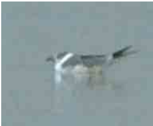
437 Lachmeeuw / Laughing Gull Larus atricilla , adult, Arnhem, Gelderland, 16 augustus 2000

Duitsland, c 1 km over de grens bij Groenlo, Gelderland. De vogel werd op 1 juni 2001 gevangen en geringd (rechts: witte PVC-ring (tarsus) en aluminiumring (tibia)). De Lachmeeuw gedroeg zich zeer vocaal en territoriaal. Regelmatig werd de zogeheten 'long-call' waargenomen waarbij hij de vleugels enigszins liet afhangen, de kop omhoog gooide en een luid, lachend geluid voortbracht. De aanwezige Kokmeeuwen leken hierop niet te reageren (pers obs). Op grond van zijn gedrag werd vastgesteld dat het om een mannetje ging. Enige aanwijzingen voor een (gemengd) broedgeval zijn niet gevonden. Wel had de Lachmeeuw in juni een nest gemaakt of bezet en werd gezien dat hij een pas uitgekomen Kokmeeuw naar het nest sleepte om het dier vervolgens te verorberen. Ook de overblijfselen van Kokmeeuwenkuikens die na het vertrek van de vogel in het nest werden aangetroffen waren waarschijnlijk van dergelijke maaltijden afkomstig. De Lachmeeuw was hier aanwezig tot ten minste 3 juli 2001 (Andreas Buchheim in litt).