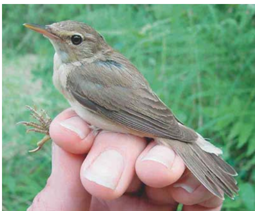
507 Struikrietzanger / Blyth's Reed Warbler Acrocephalus dumetorum , Groene Glop, Schiermonnikoog, Friesland, 29 juli 2004 (Henri Bouwmeester)

men op 18 en van 29 tot 31 augustus bij Stellendam, op 23 augustus in het Zwanenwater, Noord-Holland, en op 29 augustus bij Cadzand-Bad, Zeeland. De vogel van het Zwanenwater was daar naar verluidt al vanaf april aanwezig. Er waren Graszangers Cisticola juncidis aanwezig op 7 en 21 juli en 3 en 28 augustus bij Westkapelle, op 16 juli – maar vermoedelijk de hele periode – in het Verdronken Land van Saeftinge, vanaf 18 juli één en in augustus minstens vier op het schor bij Hoofdplaat en het Paulinaschor, Zeeland, op 24 juli in de Lauwersmeer, en op 4 en 11 augustus bij Westenschouwen, Zeeland. De drie Orpheusspottvogels Hippolais polyglotta bleven tot 4 juli bij De Weerribben, Overijssel, en bij Terziet, Limburg, en tot 5 juli bij Ter Apel, Groningen. Op 29 juli werd een Struikrietzanger Acrocephalus dumetorum geringd op Schiermonnikoog. Vanaf die datum werden c 40 Waterrietzangers A. paludicola vastgesteld waarvan er 18 werden gevangen en geringd; de hotspot wat betreft vangsten was het Verdronken Land van Saeftinge. De Bakkersdam bij Petten, Noord-Holland, en het Kennemermeer waren de plaatsen waar er meerdere werden gezien, met dagmaxima van drie. Sperwergrasmussen Sylvia nisoria werden vastgesteld op 2 augustus (vangst) te Westenschouwen, op 9 augustus (vangst) op Schiermonnikoog, op 11 augustus (vangst) in De Kennemerduinen, Noord-Holland, op 14, 15 en 16 augustus bij Westkapelle, op 15 augustus op Texel, op