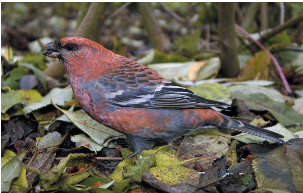
612 Haakbek / Pine Grosbeak Pinicola enucleator , adult mannetje, Groningen, Groningen, 18 november 2004 (Marten van Dijk)