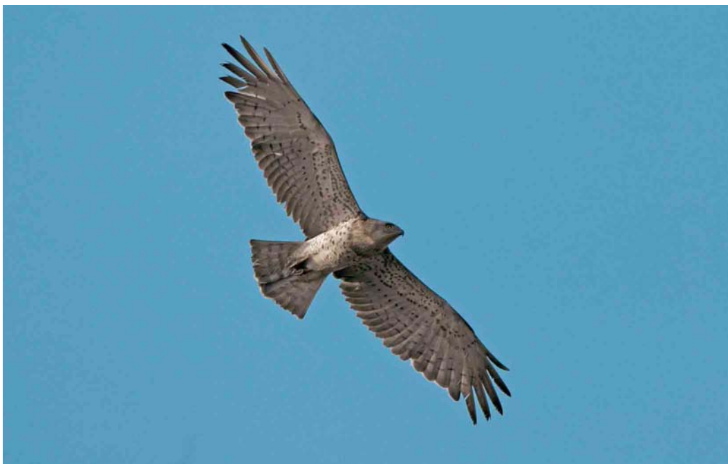
523 Short-toed Eagle / Slangenarend Circaetus gallicus , second calendar-year, De Hamert, Limburg, 14 August 2003