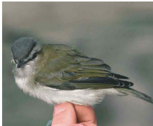
539 Paddyfield Warbler / Veldrietzanger Acrocephalus paludicola , Castricum, Noord-Holland, 12 September 2003 (Arnold Wijker) 540 Pallas's Grasshopper Warbler / Siberische Sprinkhaanzanger Locustella certhiola , Castricum, Noord-Holland, 12 September 2003 (Arnold Wijker) 541 Dusky Warbler / Bruine Boszanger Phylloscopus fuscatus , Castricum, Noord-Holland, 16 October 2003 (Arnold Wijker) 542 Red-eyed Vireo / Roodoogvireo Vireo olivaceus , Castricum, Noord-Holland, 22 October 2003 (Arnold Wijker)