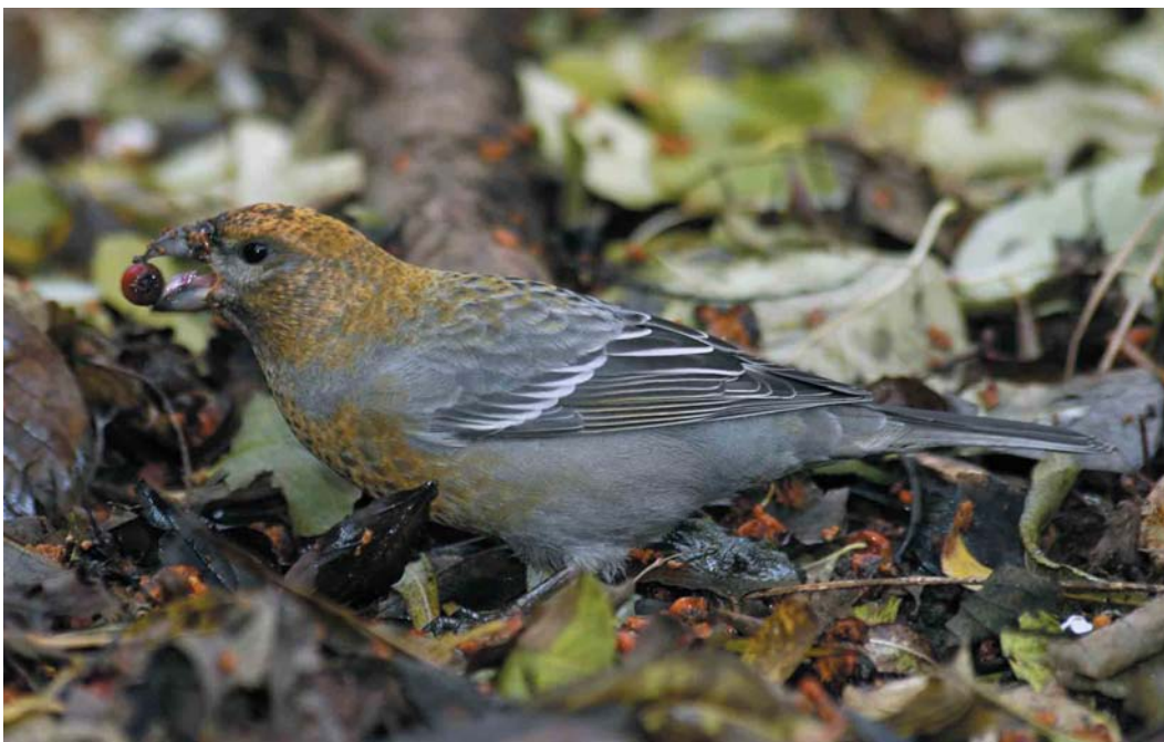
613 Haakbek / Pine Grosbeak Pinicola enucleator , eerste-winter mannetje of vrouwtje, Groningen, Groningen, 18 november 2004 (Marten van Dijk)