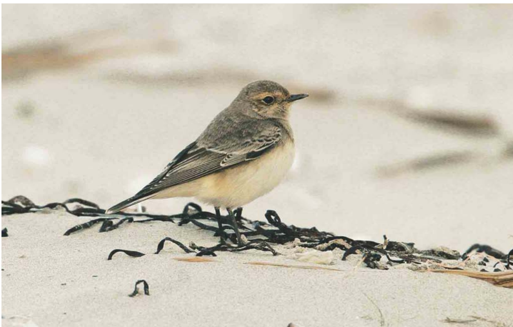
595 Bonte Tapuit / Pied Wheatear Oenanthe pleschanka , paal 22, Terschelling, Friesland, 16 oktober 2004