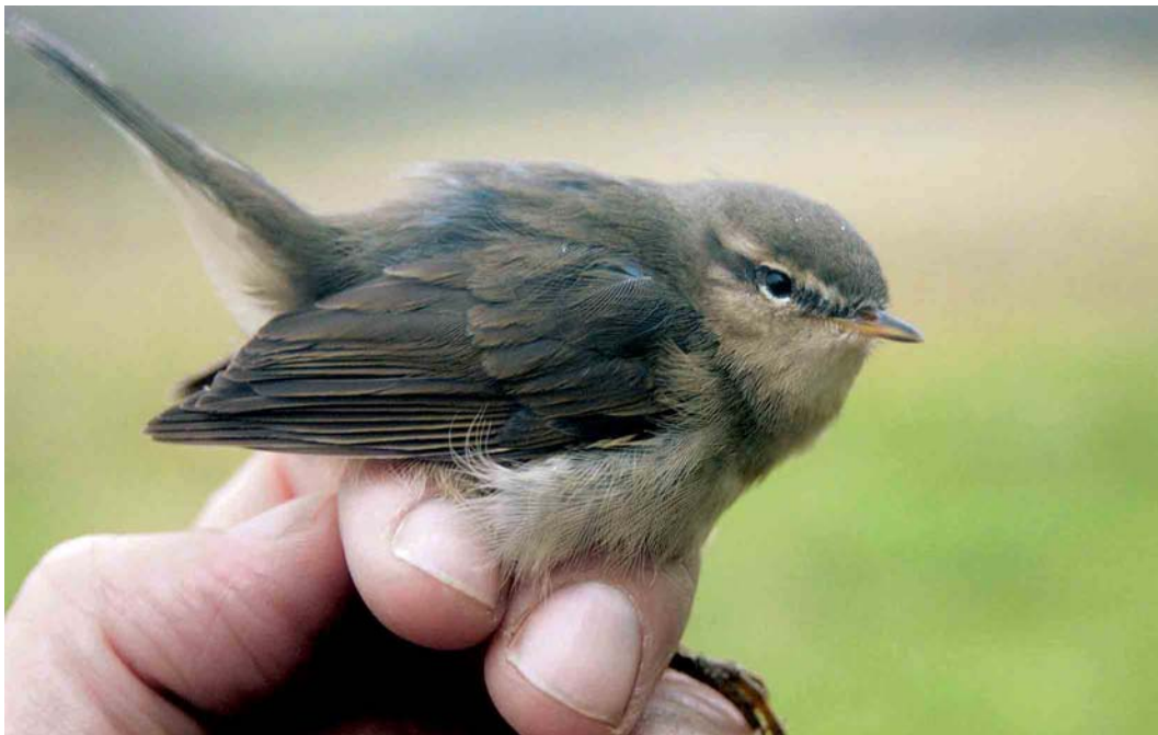
605 Bruine Boszanger / Dusky Warbler Phylloscopus fuscatus , Kennemerduinen, Bloemendaal, Noord-Holland, 20 oktober 2004