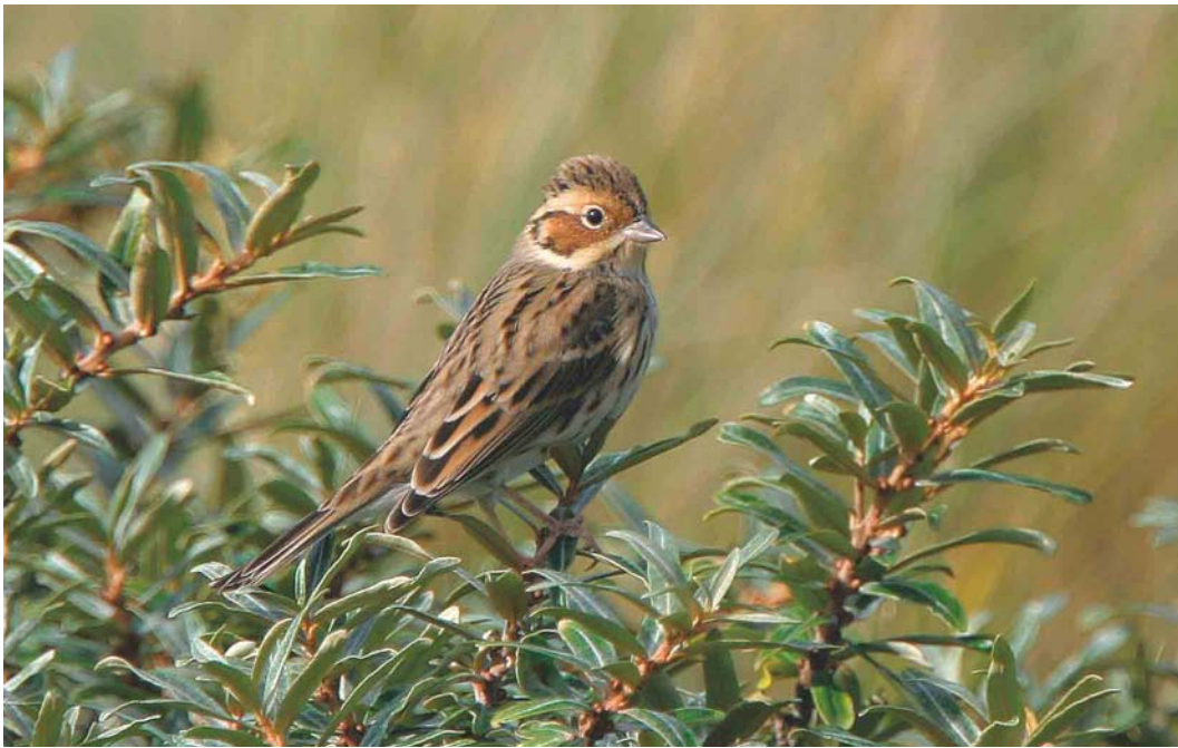
604 Dwerggors / Little Bunting Emberiza pusilla , Vlieland, Friesland, 30 september 2004