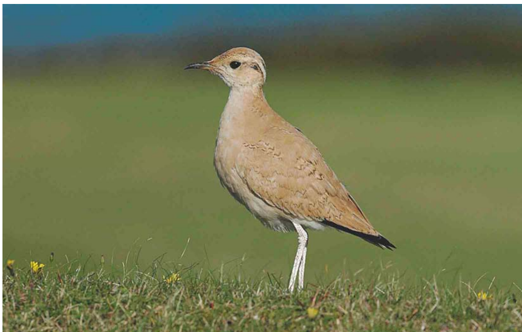
554 Cream-coloured Courser / Renvogel Cursorius cursor , first-winter, St Martin's, Scilly, England, 19 October 2004