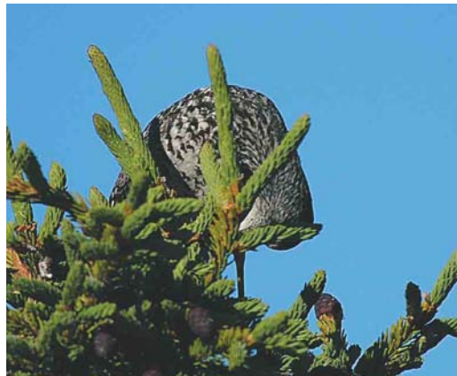
Mystery photograph XII (June)

scribed to Dutch Birding. From those entrants having identified both mystery birds correctly, one person will be drawn who will receive a free one year subscription for 2005 of the birding journal Alula donated by the Alula editorial