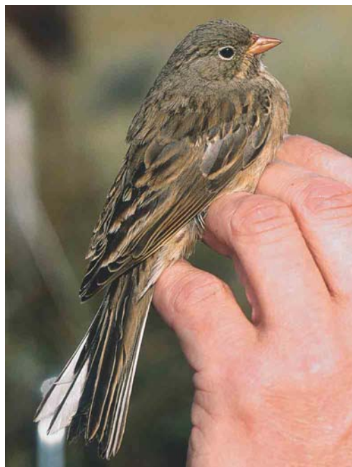
610 Steenortolaan / Grey-necked Bunting Emberiza buchanani , Castricum, Noord-Holland, 16 oktober 2004

'hout'). Zowel RR als AW bevonden zich buiten de vinkershut maar snelden naar binnen om via het kijkgat te zien waar de gors gebleven was. Pas na enige tijd ontdekten ze de vogel, niet zoals verwacht in het hout maar op een dakpan tussen het gras. AW, die alleen een kopje boven het gras zag uitsteken, pakte zijn kijker en riep 'Het lijkt wel een Ortolaan!' RR liep bij het kleine kijkgat van de druip vandaan om ook via een openstaand raam te kijken of het inderdaad om een Ortolaan ging. Juist op dat moment zag AW de vogel door zijn kijker opvliegen en laag over het eerste deel van het slagnet verdwijnen, zodat hij een lelijk woord aan RR toevoegde, omdat naar zijn mening de vogel met het slagnet gevangen had kunnen worden. RR haastte zich weer naar het kijkgat om te zien waar de gors was gebleven. Hij zag de vogel nergens meer en deze leek weg te zijn. JV, die al die tijd achter in de hut aan het ringen was geweest, keek ook eens door het kijkgat en vroeg 'Zit-ie niet gewoon op de baan?'. Hij had gelijk en RR trok het net dicht. Allen snelden naar buiten; RR haalde de vogel onder het net vandaan en riep 'Toch een Ortolaan, maar wel een rare!' Deels op basis van het uiterlijk maar vooral voor de grap zei AW 'Het is een Steenortolaan!' Natuurlijk werd er echter van uitgegaan dat het gewoon een Ortolaan E hortolana was. Op basis van de kleur van de onderzijde en het vrijwel ontbreken van enige duidelijke streping werd (voorlopig) geconcludeerd dat het een adulte