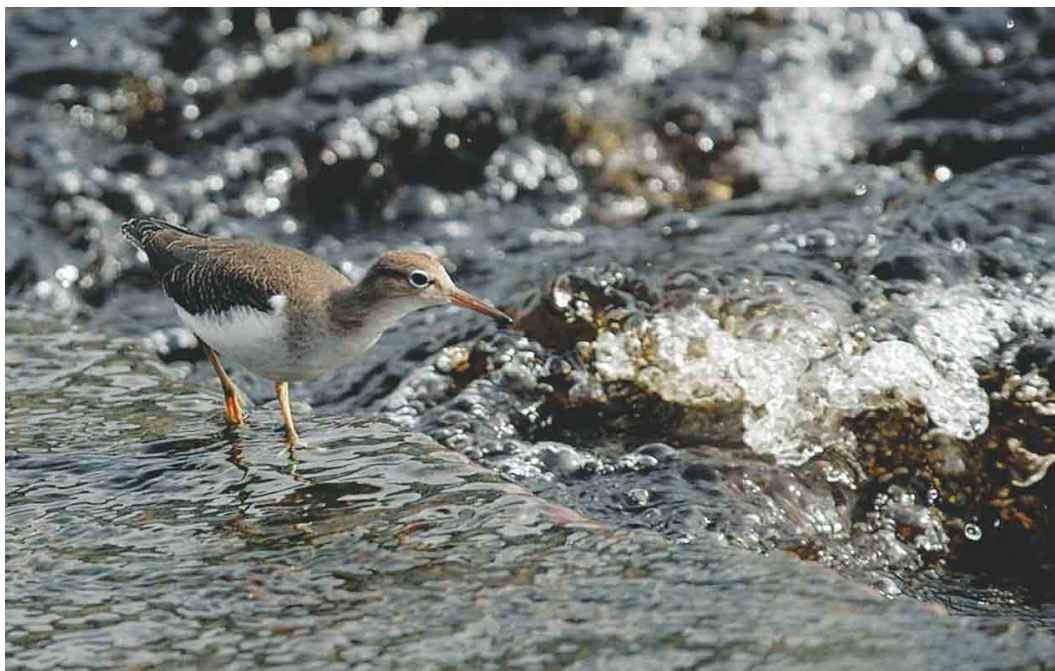
555 Spotted Sandpiper / Amerikaanse Oeverloper Actitis macularius , juvenile, Listowel, Kerry, Ireland, September 2004 (John E Murphy)