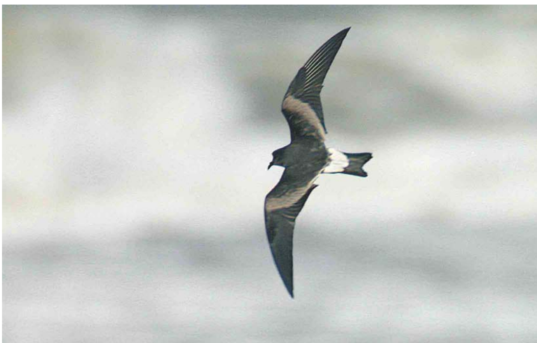
587 Vaal Stormvogeltje / Leach's Storm-petrel Oceanodroma leucorhoa , Katwijk aan Zee, Zuid-Holland, 23 september 2004