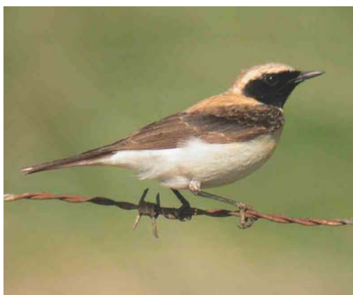
531 Red-rumped Swallow / Roodstuitzwaluw Hirundo daurica , Eijsderbeemden, Limburg, 19 April 2003 532 Daurian Shrike / Daurische Klauwier Lanius isabellinus , Texel, Noord-Holland, 25 September 2003 533 White-throated Robin / Perzische Roodborst Irania gutturalis , first-year, Budel-Dorplein, Limburg, 30 August 2003 534 Eastern Black-eared Wheatear / Oostelijke Blonde Tapuit Oenanthe melanoleuca , first-summer male, Texel, Noord-Holland, 4 May 2003

(S Sytsma, E van Hijum; Dutch Birding 25: 272, plate 299, 2003).