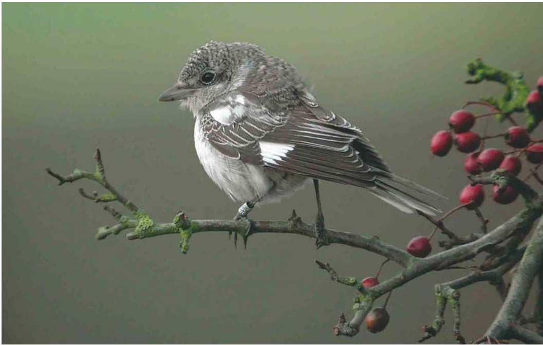
578 Masked Shrike / Maskerklauwier Lanius nubicus , juvenile, Killrenny, Fife, Scotland, 5 November 2004