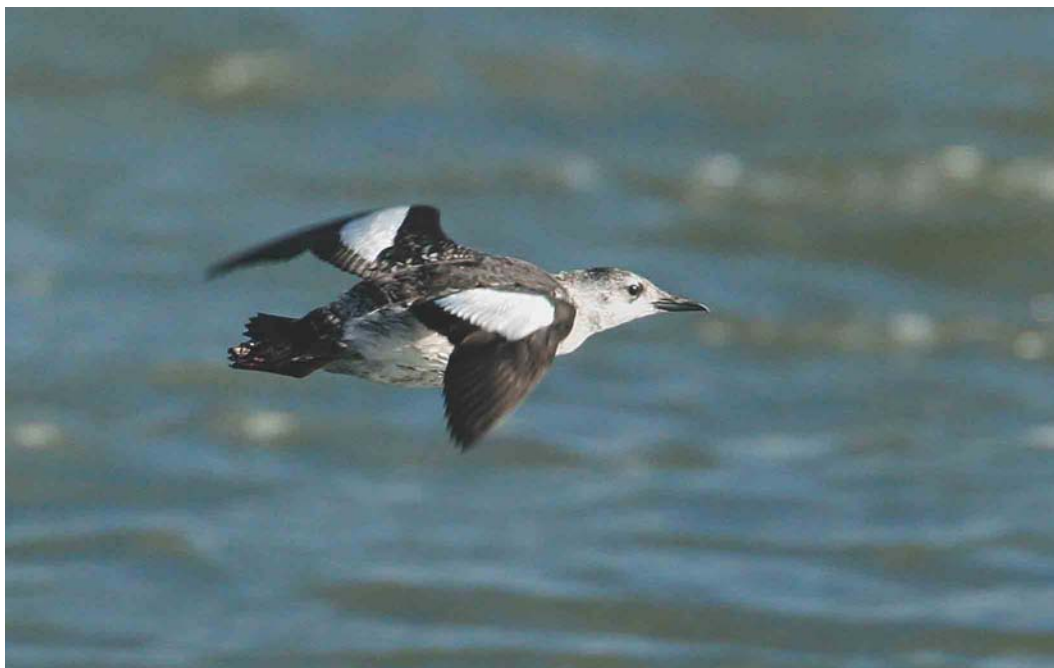
591 Zwarte Zeekoet / Black Guillemot Cephus grylle , adult-winter, West-Terschelling, Terschelling, Friesland, oktober 2004