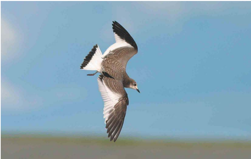
588 Vorkstaartmeeuw / Sabine's Gull Larus sabini , juveniel, Eemshaven, Groningen, 30 september 2004