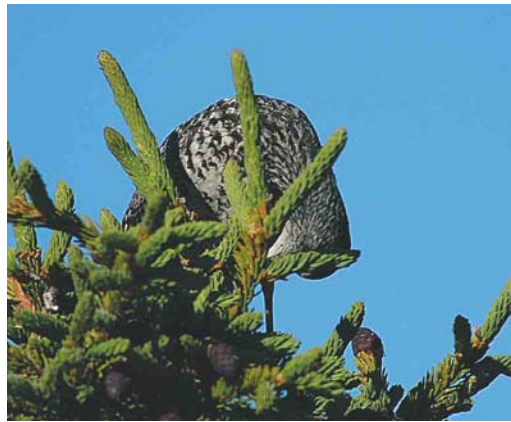
Mystery photograph XII (June)

scribed to Dutch Birding. From those entrants having identified both mystery birds correctly, one person will be drawn who will receive a free one year subscription for 2005 of the birding journal Alula donated by the Alula editorial