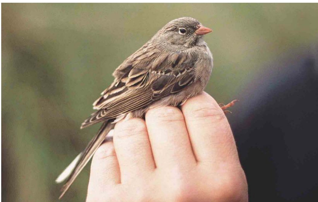
581 Grey-necked Bunting / Steenortolaan Emberiza buchanani , first-winter male, Castricum, Noord-Holland, Netherlands, 16 October 2004