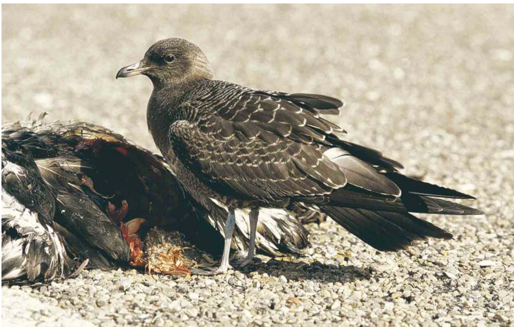
589 Kleinste Jager / Long-tailed Jaeger Stercorarius longicaudus , juveniel, Petten, Noord-Holland, 26 september 2004