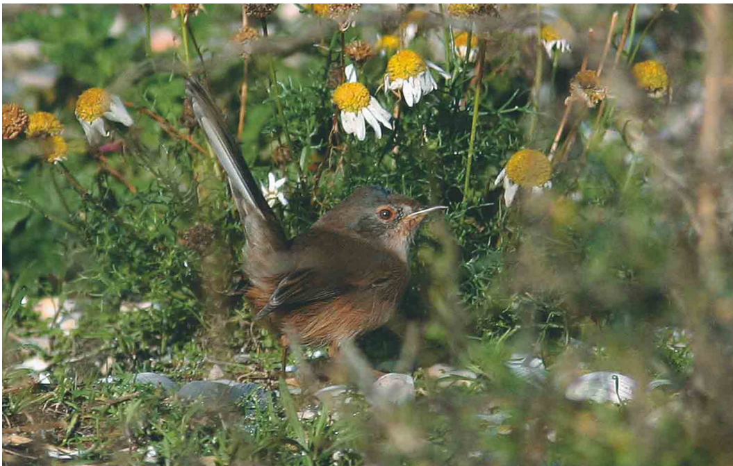
608 Provençaalse Grasmus / Dartford Warbler Sylvia undata , Zeebrugge, West-Vlaanderen, oktober 2004

grote afstand in de vroege uurtjes gezien. Op 3 september pleisterde een Hop Upupa epops in een tuin in Sint-Huibrechts-Hern, Limburg. Er werden 62 Draaihalzen Jynx torquilla doorgegeven, de meeste tussen 1 en 5 september. Op 8 oktober was er na een leegte van enkele jaren weer een waarneming van een Middelste Bonte Specht Dendrocopos medius in Pulderbos, Antwerpen. Vanaf 3 oktober verschenen de eerste Strandleeuweriken Eremophila alpestris maar het bleef telkens bij één tot maximaal acht exemplaren. Grote Piepers Anthus richardi werden vanaf 29 september waargenomen op volgende plaatsen: Essen; Heist (twee); Knokke (twee); Nieuwpoort; Oostduinkerke, West-Vlaanderen; Oudenburg, West-Vlaanderen; Rijkvorsel, Antwerpen; en Tienen (twee). Pleisterende vogels werden weer voornamelijk vastgesteld in het Zeebrugse met c negen in de Achterhaven en drie in de Voorhaven. Er werden nog 47 Duinpiepers A campestris opgemerkt, waarvan 38 tussen 1 en 10 september. De laatste waarnemingen gebeurden in Perwez, Namur, en in Houthalen, Limburg, op 3 oktober. De 11 waargenomen Roodkeelpiepers A cervinus trokken alle langs tussen 13 september en 13 oktober. Op 19 oktober trok een late Gele Kwikstaart Motacilla flava over Tienen. De eerste Pestvogel Bombycilla garrulus trok op 22 oktober over Koksijde, West-Vlaanderen; daarna volgden waarnemingen in Blankenberge op 27 oktober; in Zeebrugge op 28 oktober (drie) en 29 oktober; over Boekhoute op 30 oktober; en over Dilsen-