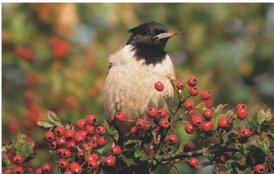
600 Roze Spreeuw / Rose-coloured Starling Sturnus roseus , adult, Noorderstreek, Schiermonnikoog, Friesland, september 2004 (Eric Menkveld)