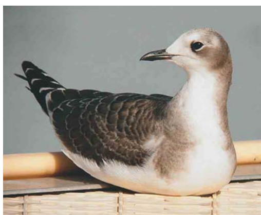
556-557 Pallid Swift / Vale Gierzwaluw Apus pallidus , Helgoland, Schleswig-Holstein, Germany, 27 October 2004 (Felix Jachmann) 558 Wilson's Storm-petrel / Wilsons Stormvogeltje Oceanites oceanicus , off Galicia, Spain, 21 August 2004 (Rafael Armada) 559 Snowy Egret / Amerikaanse Kleine Zilverreiger Egretta thula , Horta, Azores, 6 October 2004 (Mark Bolton) 560 Purple Gallinule / Amerikaans Purperhoen Porphyryla martinica , first-year, Mogán, Gran Canaria, Canary Islands, 19 October 2004 (Pascual Calabuig) 561 Sabine's Gull / Vorkstaartmeeuw Larus sabini , juvenile, Lac du Der-Chantecoq, Giffaumont-Campaubert, Marne, France, October 2004 (Ben van den Broek)