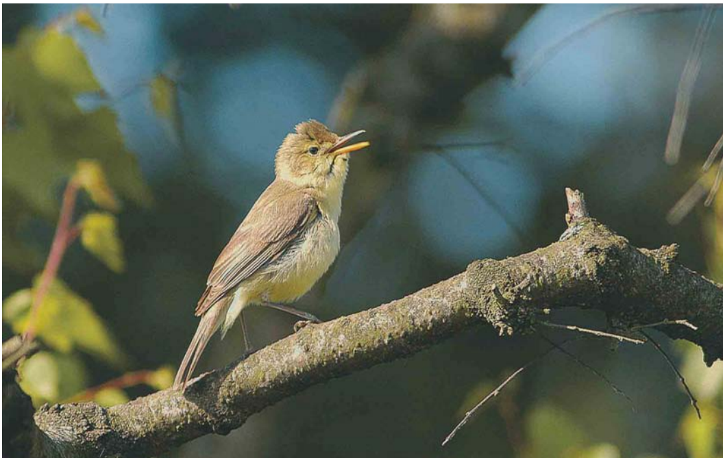
538 Melodious Warbler / Orpheusspotvogel Hippolais polyglotta , Mariapeel, Limburg, 15 June 2003