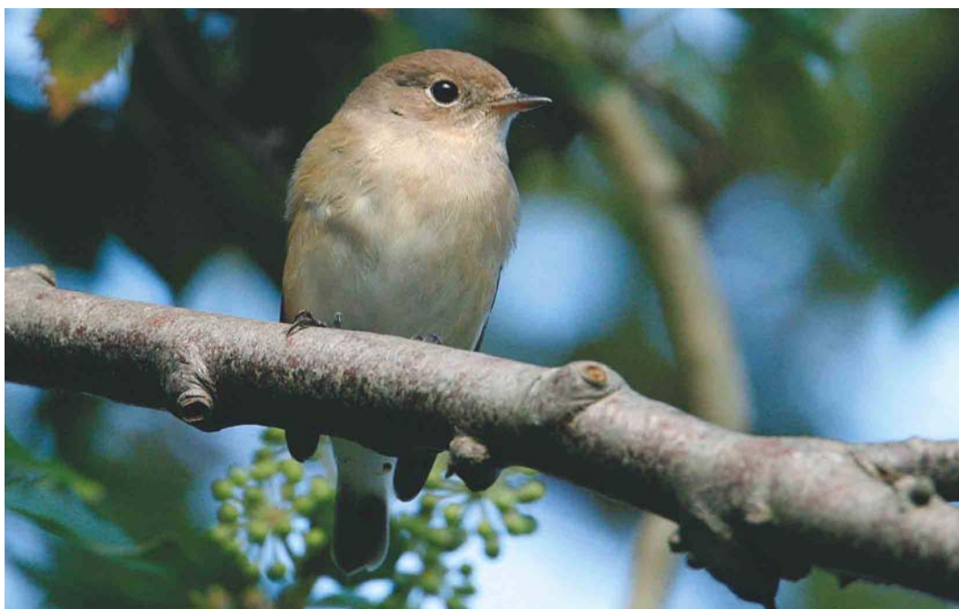
601 Kleine Vliegenvanger / Red-breasted Flycatcher Ficedula parva , Terschelling, Friesland, 8 oktober 2004 (Arie Ouwerkerk)