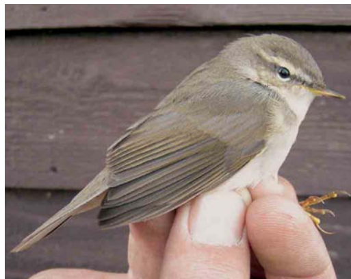
562 Blyth's Reed Warbler / Struikrietzanger Acrocephalus dumetorum , Canal Vell, Ebro delta, Tarragona, Spain, 22 October 2004 (Sergi Sales) 563 Eastern Orphean Warbler / Oostelijke Orpheusgrasmus Sylvia crassirostris , first-year male, Sula, Sør-Trøndelag, Norway, 3 October 2004 (Torborg Berge) 564 Brown Shrike / Bruine Klauwier Lanius cristatus , Ile de Noirmoutier, Vendée, France, 5 November 2004 (Vincent Legrand) 565 Pallas's Grasshopper Warbler / Siberische Sprinkhaanzanger Locustella certhiola , first-year, Utsira, Norway, 30 September 2004 (Jan Bisschop) 566 Dusky Warbler / Bruine Boszanger Phylloscopus fuscatus , Björns fyr, Uppland, Sweden, 2 October 2004 (Lennart Söderlund). This bird was retrapped on Vlieland, Friesland, the Netherlands, on 12 October. 567 Dusky Warbler / Bruine Boszanger Phylloscopus fuscatus , Kroonspolders, Vlieland, Friesland, Netherlands, 12 October 2004 (Holmer Vonk). Same bird as in plate 566!