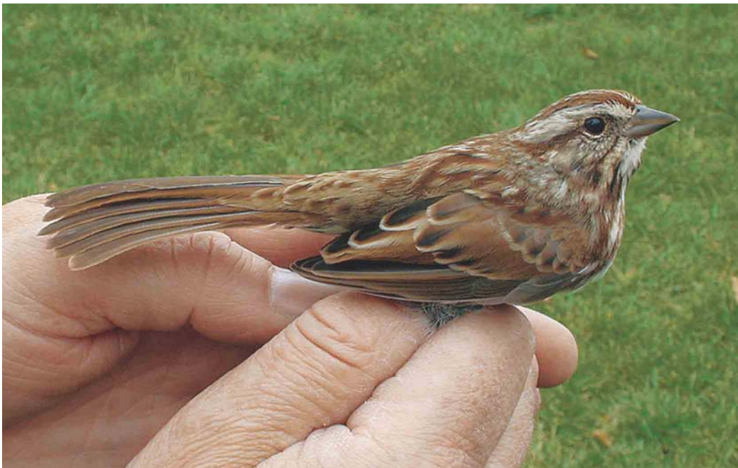
583 Song Sparrow / Zanggors Melospiza melodia , first-year, Sint-Laureins, Oost-Vlaanderen, Belgium, 30 September 2004