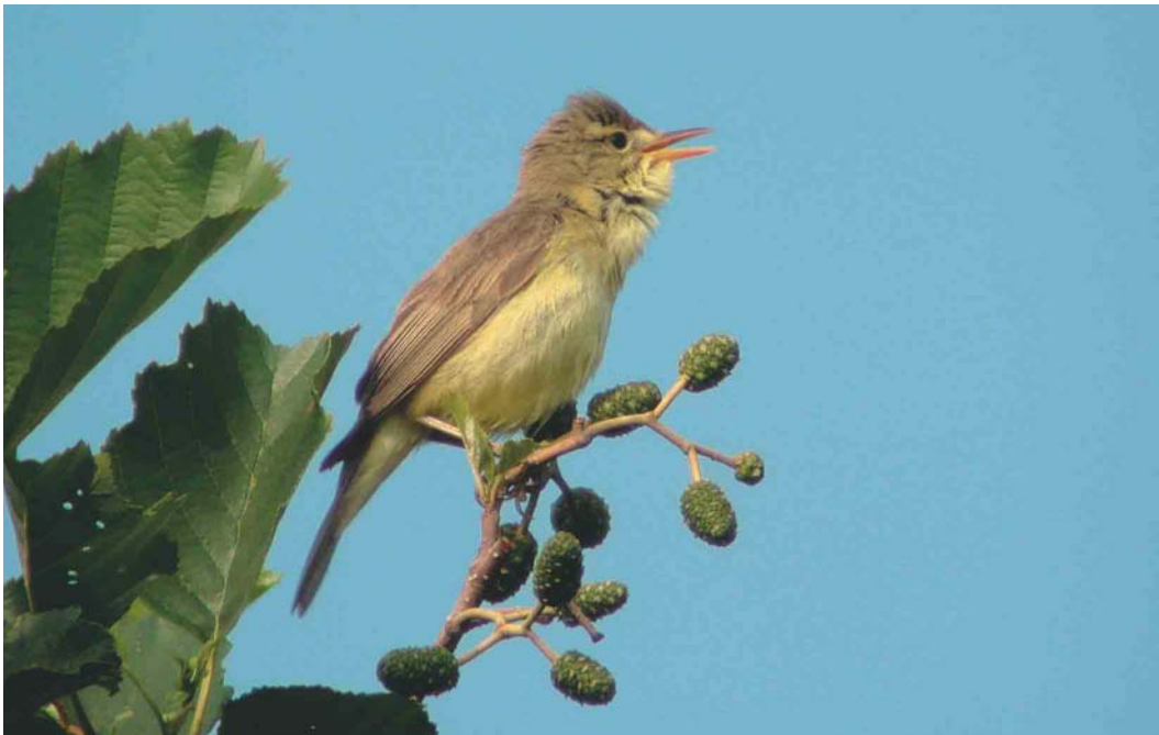
537 Melodious Warbler / Orpheusspotvogel Hippolais polyglotta , Zoetermeer, Zuid-Holland, 16 June 2003