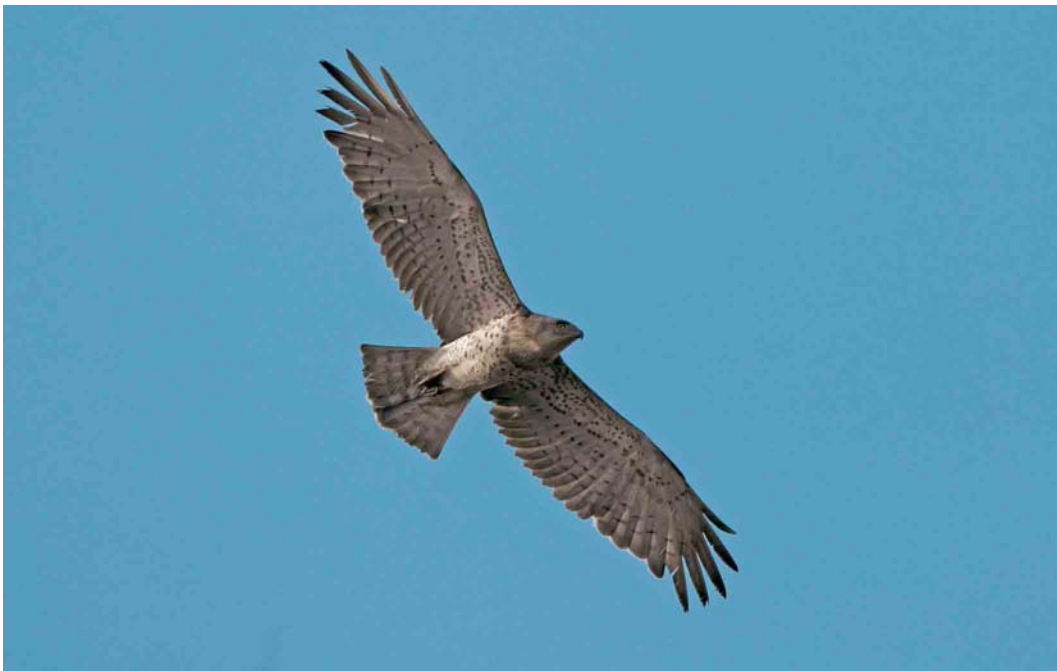
523 Short-toed Eagle / Slangenarend Circaetus gallicus , second calendar-year, De Hamert, Limburg, 14 August 2003 ( Ran Schols )