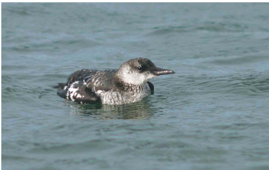
590 Zwarte Zeekoet / Black Guillemot Cepphus grylle , eerstejaars, Maasvlakte, Zuid-Holland, 11 september 2004