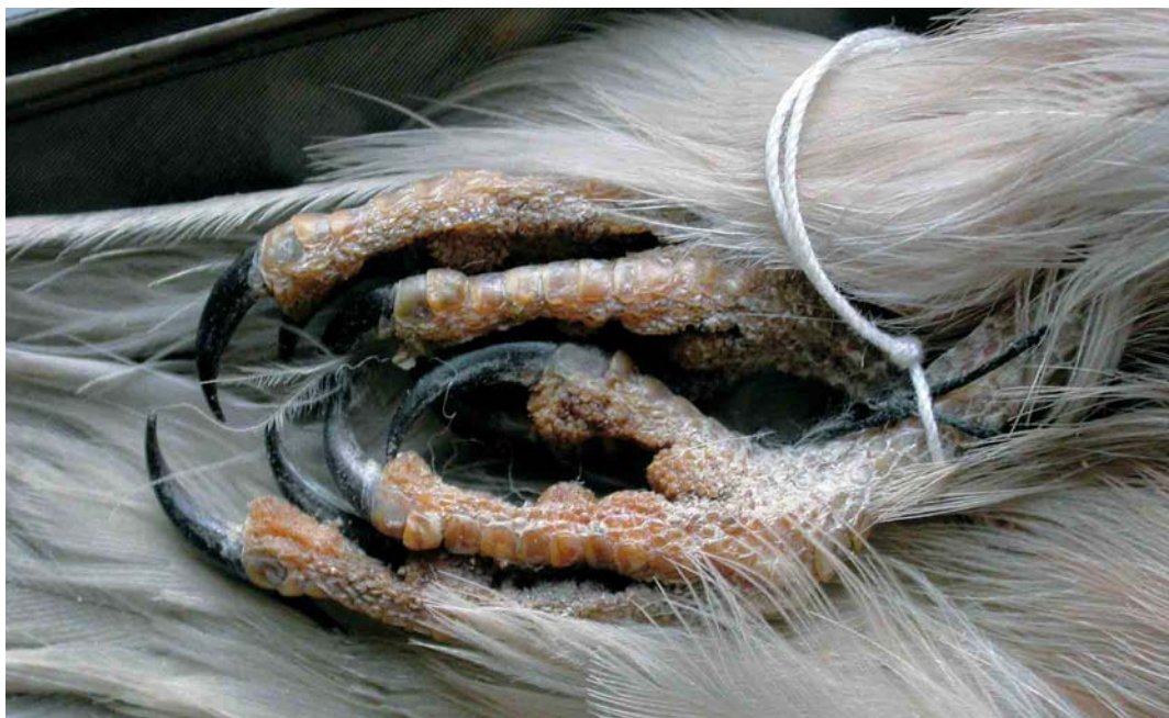
155 Torenvalk / Common Kestrel Falco tinnunculus , tenen en nagels van adult mannetje (verzameld op 2 december 1969 bij Rhenen, Utrecht) Zoölogisch Museum Amsterdam (ZMA), Noord-Holland, 28 februari 2005 (Ruud Altenburg). Let op de donkere nagels / note dark claws.