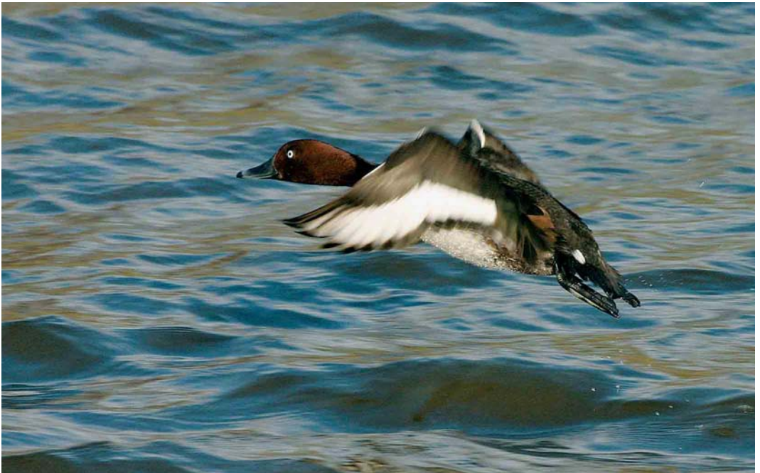
181 Witoogeend / Ferruginous Duck Aythya nyroca , Oude IJssel, Gendringen, Gelderland, 13 januari 2005