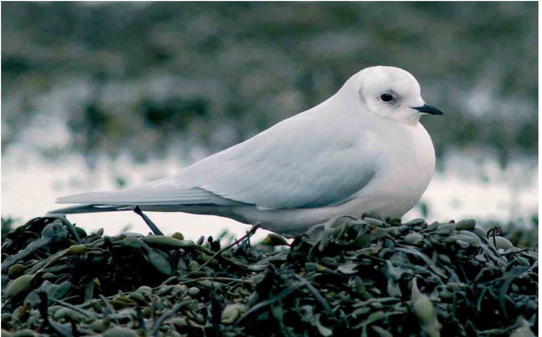
169 Ross's Gull / Ross' Meeuw Rhodostethia rosea , adult, Peterhead, Aberdeenshire, Scotland, February 2005