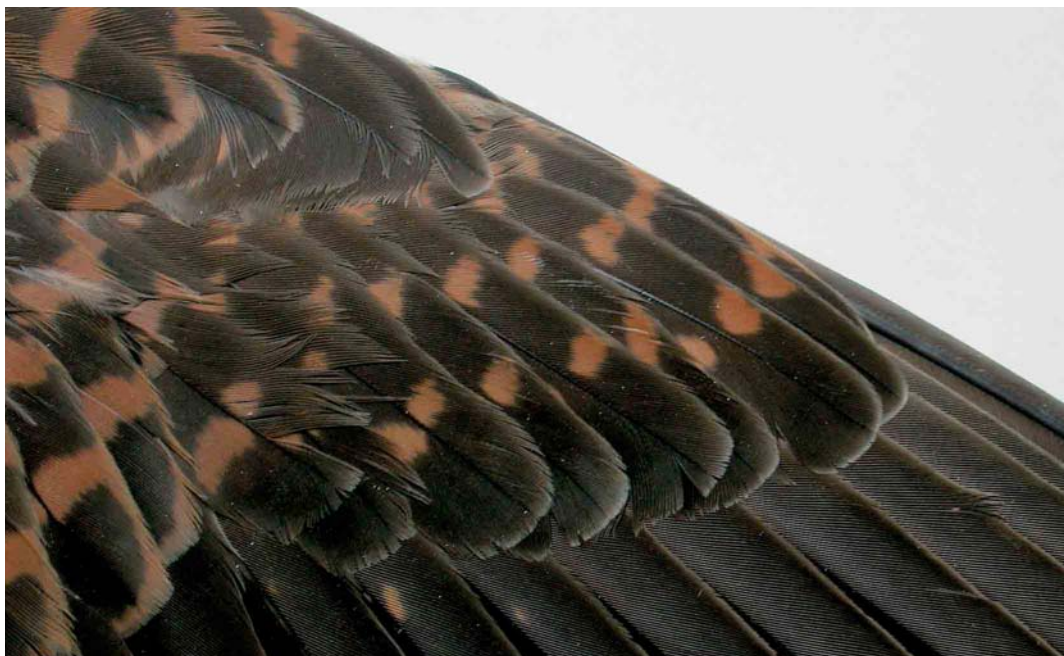
154 Torenvalk / Common Kestrel Falco tinnunculus , detail van bovenvleugel van adult vrouwtje (verzameld bij Den Hoorn, Texel, Noord-Holland, op 13 maart 1974), Zoölogisch Museum Amsterdam (ZMA), Noord-Holland, 1 maart 2005 (Ruud Altenburg).