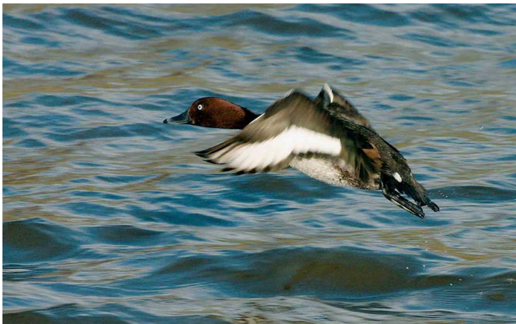
181 Witoogeend / Ferruginous Duck Aythya nyroca , Oude IJssel, Gendringen, Gelderland, 13 januari 2005 (Edwin Winkel)