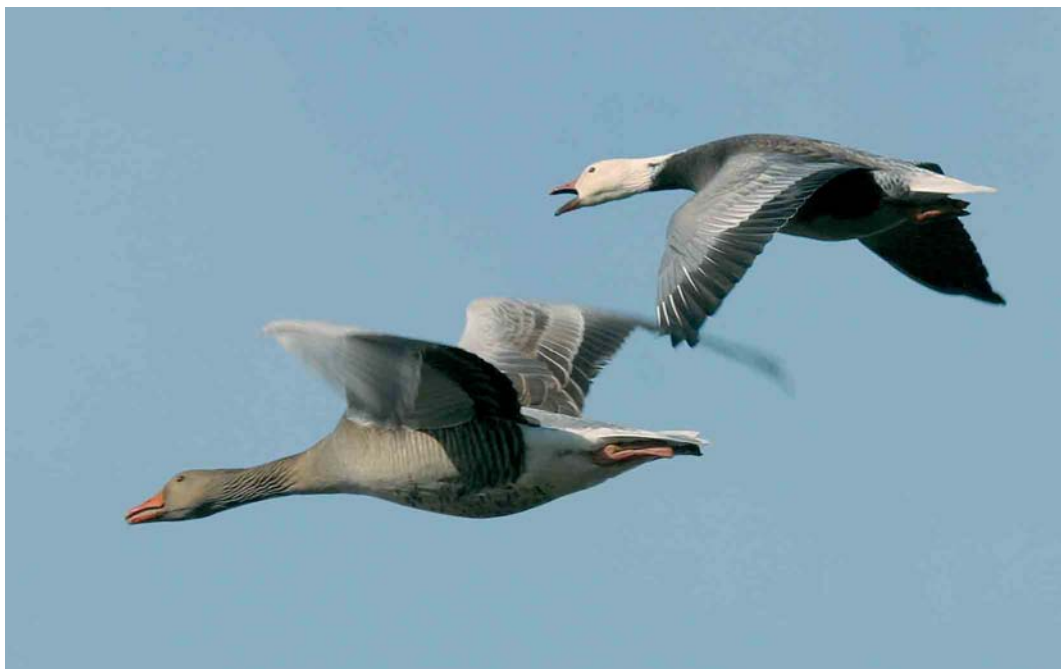
180 Kleine Sneeuwgans / Lesser Snow Goose Anser caerulescens caerulescens , adult, blauwe vorm, met Grauwe Gans / Greylag Goose A anser , Haarlemmerliede, Noord-Holland, 18 februari 2005