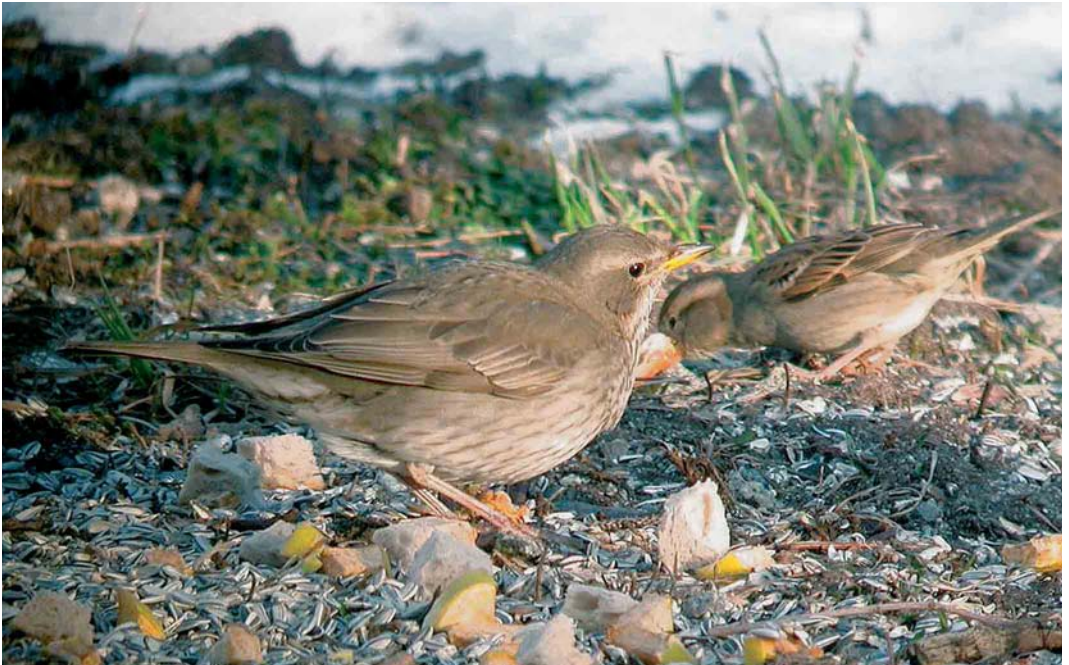
174 Black-throated Thrush / Zwartkeellijster Turdus ruficollis atrogularis , female, with House Sparrow / Huismus Passer domesticus , Husøy, Træna, Nordland, Norway, 13 March 2005