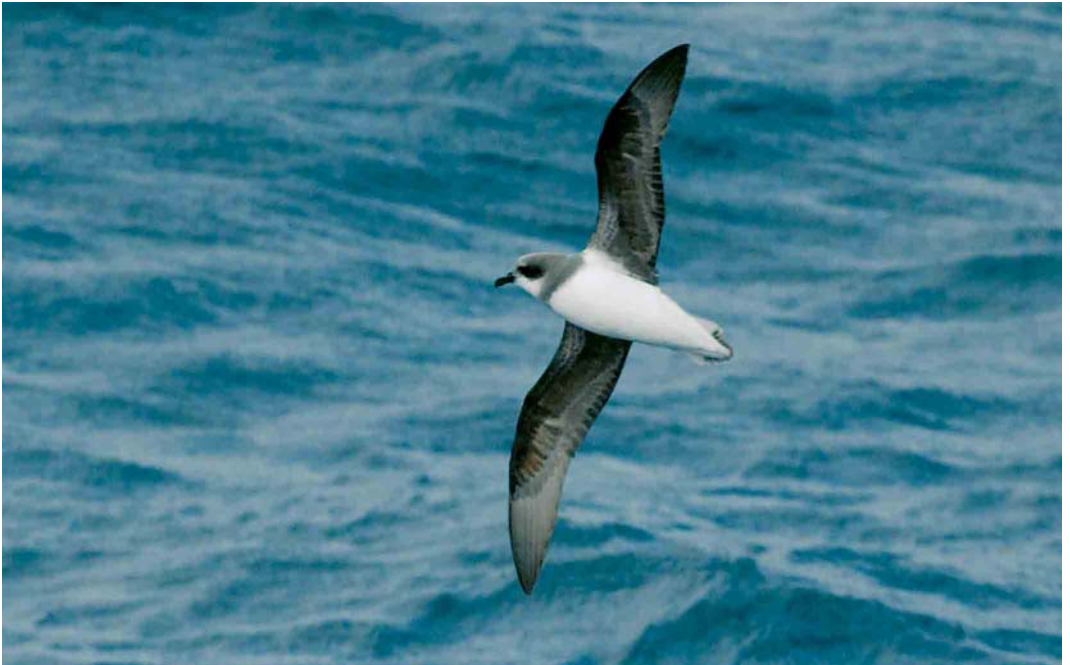
128 Soft-plumaged Petrel / Donsstormvogel Pterodroma mollis , off Kerguelen Islands, March 2004