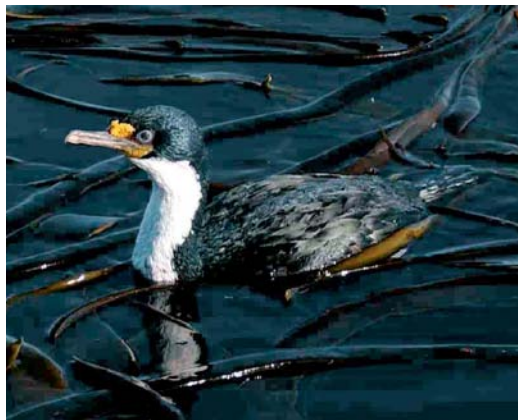
132 Blue Petrel / Blauwe Stormvogel Halobaena caerulea , off Kerguelen Islands, March 2004 ( Hadoram Shirihai ) 133 White-headed Petrel / Witkopstormvogel Pterodroma lessonii , off Kerguelen Islands, March 2004 ( Hadoram Shirihai ) 134 Kerguelen Tern / Kerguelensterne Sterna virgata , Kerguelen Islands, March 2004 ( Hadoram Shirihai ) 135 Kerguelen Shag / Kerguelenaalscholver Phalacrocorax verrucosus , Kerguelen Islands, March 2004 ( Hadoram Shirihai )

go, while Blue Petrel and Grey Petrel mostly inhabit the Golfe du Morbihan. Thanks to their larger size, Great-winged, White-headed and White-chinned Petrels can still breed on the mainland, in the presence of rats and cats. Black-faced Shearwaters C m minor and Brown Skuas are abundant around seabird colonies. On the rocky shores of Kerguelen, shearwaters are able to live also in territories without seabird colonies, foraging on marine invertebrates at low tide like waders. The endemic Kerguelen Shag P verrucosus as well as Kerguelen Pintail, Antarctic Tern and Kerguelen Tern are common throughout the archipelago.