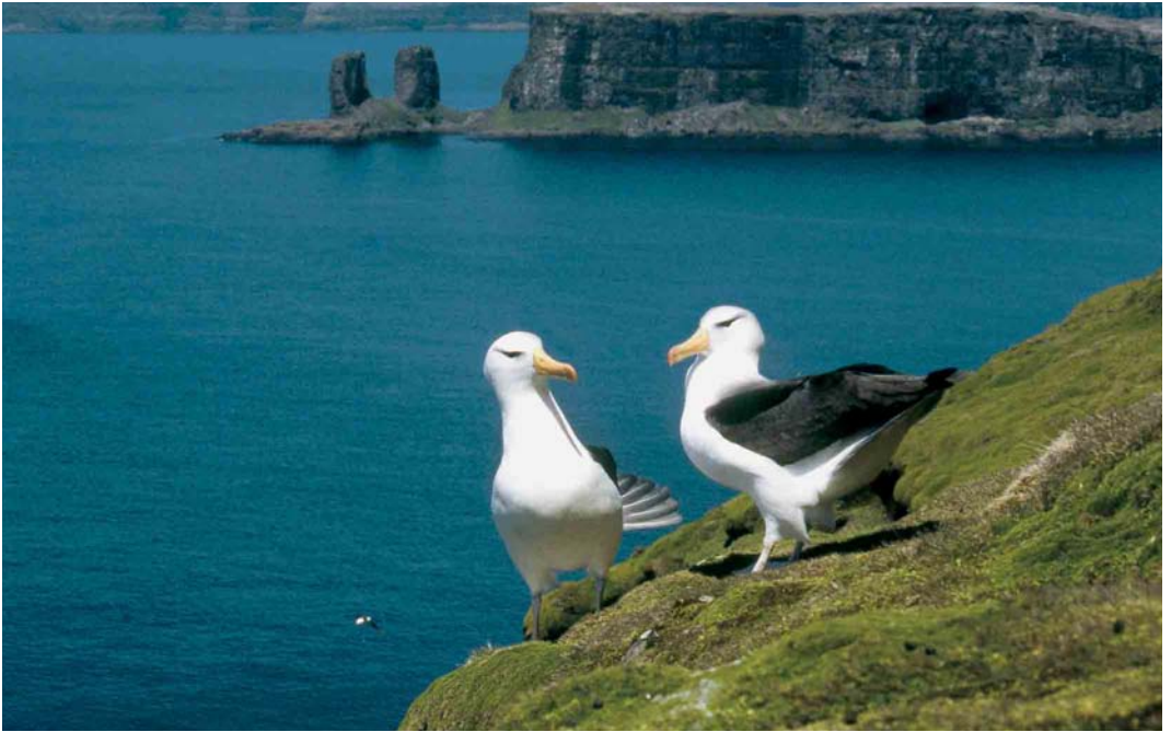
127 Black-browed Albatrosses / Wenkbrauwalbatrossen Thalassarche melanophrys , displaying in front of the 'Arche', Baie de l'Oiseau, Kerguelen Islands, 1997 (Olivier Duriez)