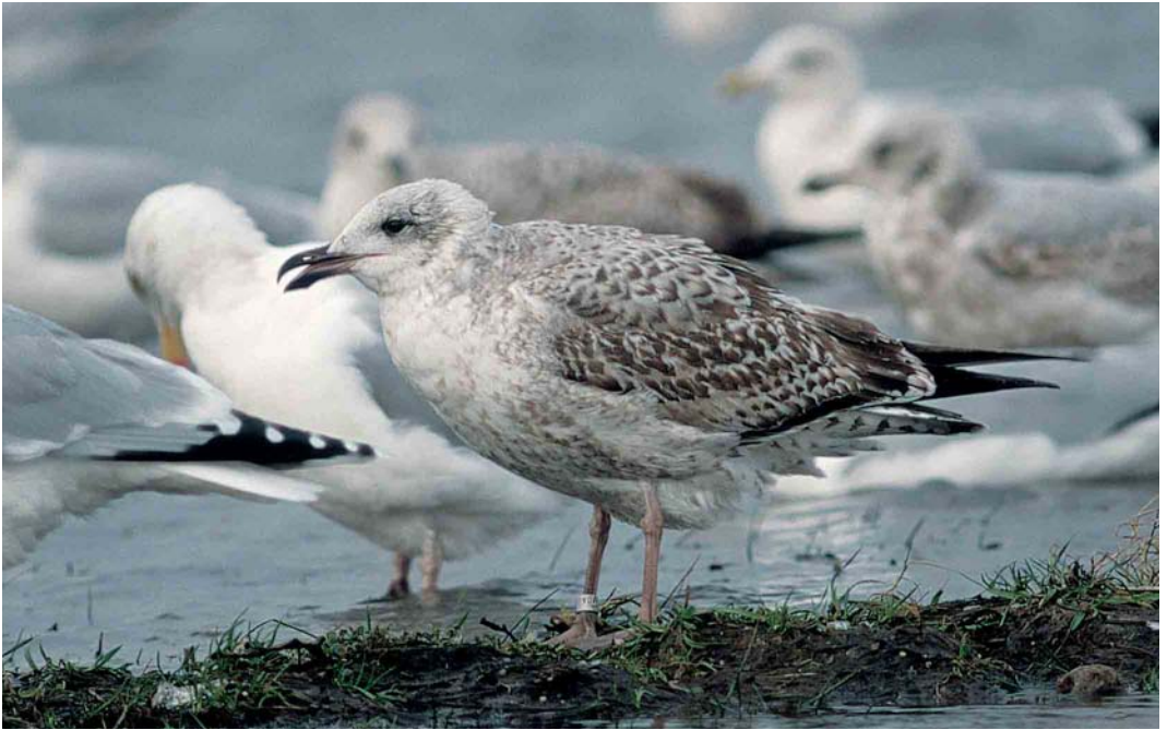
159 European Herring Gull / Zilvermeeuw Larus argentatus , Wijster, Drenthe, Netherlands, 29 January 2002 ( Rudy Offereins )

160 Yellow-legged Gull / Geelpootmeeuw Larus michahellis , Wijster, Drenthe, Netherlands, 4 December 1999 ( Rudy Offereins ). A remarkable individual with rather dark underparts, showing freshly moulted inner greater coverts. Note also that all scapulars have been renewed, showing the same contrasting pattern as the new greater coverts. The long legs and strong, blunt-tipped bill are typical for Yellow-legged Gull.