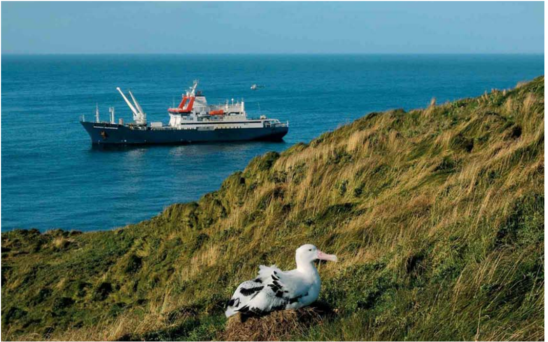
110 Wandering Albatross / Grote Albatros Diomedea exulans , incubating, île de la Possession, Crozet Islands, March 2004 ( Hadoram Shirihai ). In the background, MV Marion Dufresne is in full operation (with its helicopter). Note the open but protected decks which allow observing seabirds in most conditions. 111 White-chinned Petrel / Witkinstormvogel Procellaria aequinoctialis , off Crozet Island, March 2004 ( Hadoram Shirihai ) 112 Southern Rockhopper Penguin / Zuidelijke Rotspinguïn Eudyptes chrysocome filholi , Crozet Islands ( Crozet Base Collection, TAAF )