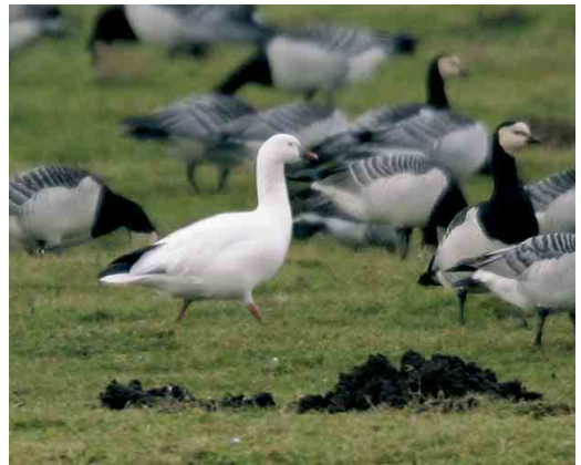
184 Bronskopeend / Falcated Duck Anas falcata , mannetje, Engbertsdijkvenen, Overijssel, 2 maart 2005 ( Richard Gerritsen ) 185 Kleine Sneeuwvangs / Lesser Snow Goose Anser caerulescens caerulescens , adult, blauwe vorm, Hekslootpolder, Haarlem, Noord-Holland, 27 februari 2005 ( Enno B Ebels ) 186 Zwarte Rotgans / Black Brant Branta nigricans , adult, Banckspolder, Schiermonnikoog, Friesland, 27 december 2004 ( Enno B Ebels ) 187 Ross' Gans / Ross's Goose Anser rossii , Oosterpoel, Waterland-Oost, Noord-Holland, 3 februari 2005 ( Ronald van Dijk )

Kamperland, Zeeland. Een Giervalk F rusticolus zou op 12 februari gezien zijn bij Nes, Friesland.