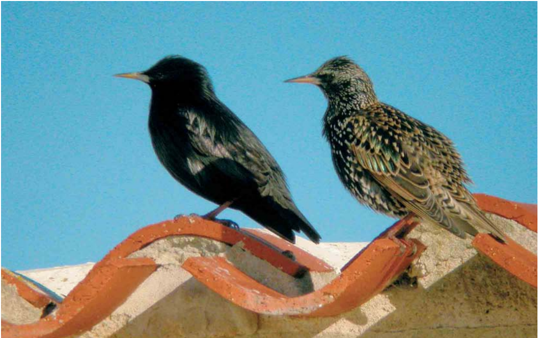
173 Spotless Starling / Zwarte Spreeuw Sturnus unicolor (left), with Common Starling / Spreeuw S vulgaris , Ile de Noirmoutier, Vendée, France, January 2005