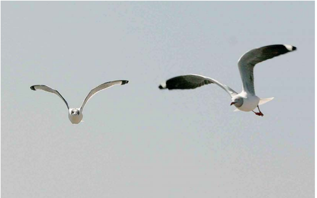
166 Franklin's Gull / Franklins Meeuw Larus pipixcan , adult (left), with Grey-headed Gull / Grijskopmeeuw L. cirrocephalus , Banjul, The Gambia, 8 February 2005