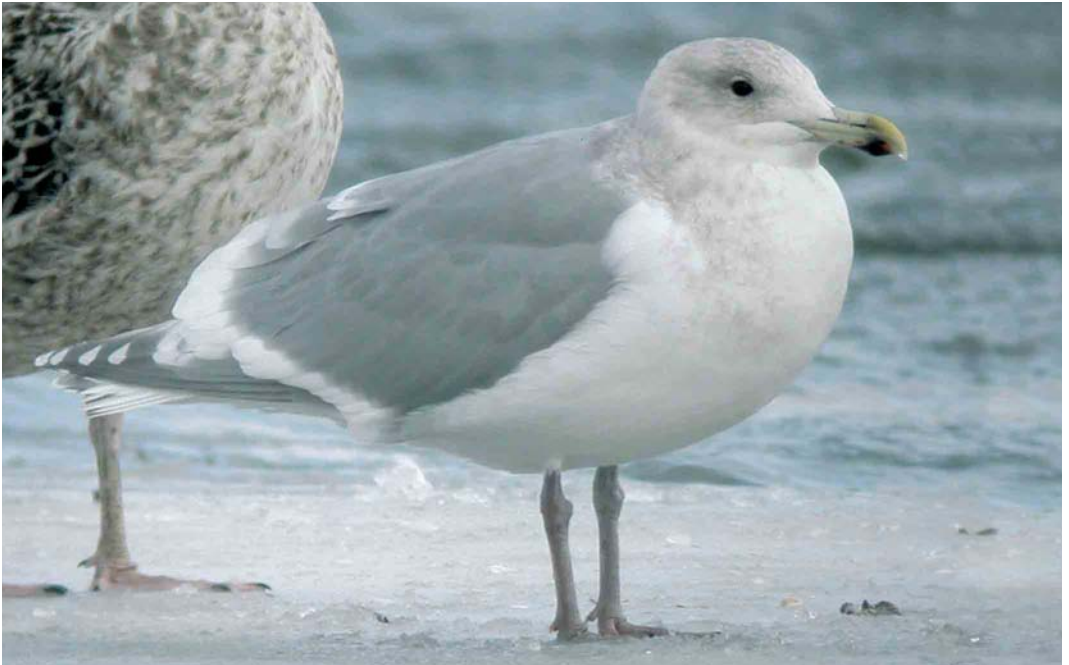
167 Glaucous-winged Gull / Beringmeeuw Larus glaucescens , adult or near-adult, Quidi Vidi Lake, St John's, Newfoundland, Canada, February 2005 (Bruce Mactavish)