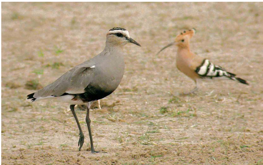
165 Sociable Lapwing / Steppekievit Vanellus gregarius , with Eurasian Hoopoe / Hop Upupa epops , Dubai pivot fields, Dubai, United Arab Emirates, 23 February 2005