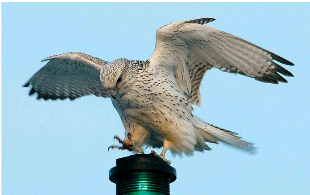
164 Gyr Falcon / Giervalk Falco rusticolus , at sea, west of Ramna Stacks, Shetland, Scotland, 12 February 2005