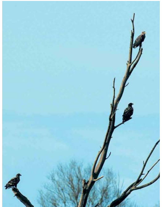
179 Zeereyden / White-tailed Eagles Haliaeetus albicilla , Oostvaardersplassen, Flevoland, 25 januari 2005 (Harm Niesen)

ding van een Dikbekfuut Podilymbus podiceps op 17 en 18 februari in het centrum van Den Haag. Winterwaarnemingen van Grauwe Pijlstormvogels Puffinus griseus werden verricht langs Scheveningen, Zuid-Holland, op 9 en 14 januari. Een Vaal Stormvogeltje Oceanodroma leucorhoa werd op 20 januari eveneens bij Scheveningen gezien. Maximaal vijf Kuifaalscholvers Phalacrocorax aristotelis verbleven tot 22 januari bij Neeltje Jans. Verspreid langs de kust werden er nog eens 15 gemeld van 10 locaties. Twee Koereigers Bubulcus ibis vlogen op 15 januari langs Goes, Zeeland, en op 21 februari verbleef er één bij Hem, Noord-Holland. Het hoogste aantal Kleine Zilverreigers Egretta garzetta betrof 34 op 22 januari bij Ouwerkerk, Zeeland. Wintertellingen van Grote Zilverreigers Casmerodius albus in december en januari leverden in totaal 26 slaappleaatsen op met maar liefst 445 exemplaren, waaronder zes locaties met meer dan 30 en als absoluut maximum 58 in Botshol, Utrecht; overigens is dit beeld niet volledig. De Zwarte Ibis Plegadis falcinellus van Huisduinen, Noord-Holland, bleef tot 5 februari. In januari werden vijf Rode Wouwen Milvus milvus gemeld en nog eens vijf in februari. In totaal werden 16 Zeereyden Haliaeetus albicilla doorgegeven, waaronder geregeld drie in de Oostvaardersplassen, Flevoland. Toendraslechtsvalken Falco peregrinus calidus werden op 16 januari gemeld bij Hellevoetsluis, Zuid-Holland, en op 24 januari bij