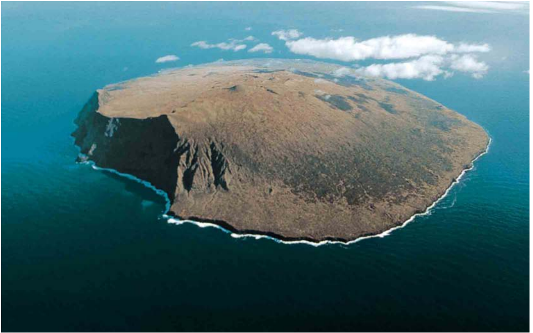
136 General view of Amsterdam Island, with the Falaises d'Entrecasteaux on the left (TAAF Collection)

137 Falaises d'Entrecasteaux, Amsterdam Island, 1995 (Dominique Filippi). These 700 m-high cliffs, covered with tussock grass, host the world's biggest colony of Yellow-nosed Albatross Thalassarche chlororhynchos .