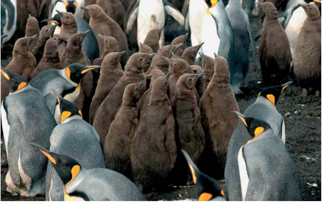
125-126 King Penguins / Koningspinguïns Aptenodytes patagonicus , Ratmanoff Beach, Grande Terre, Kerguelen Islands, March 2004 ( Hadoram Shirihai )