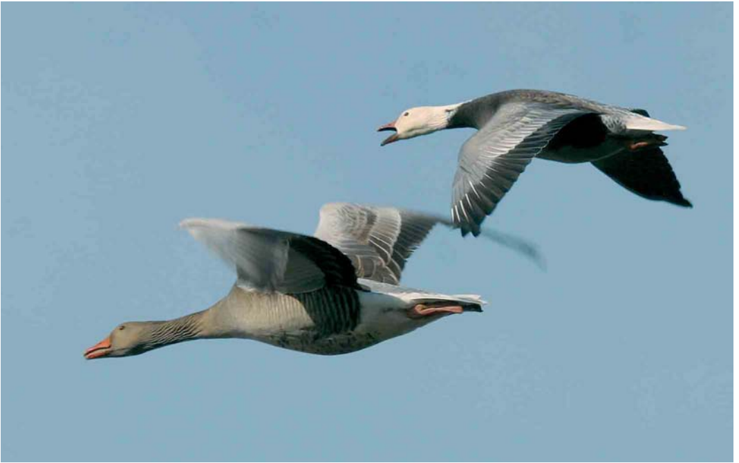
180 Kleine Sneeuwgans / Lesser Snow Goose Anser caerulescens caerulescens , adult, blauwe vorm, met Grauwe Gans / Greylag Goose A anser , Haarlemmerliede, Noord-Holland, 18 februari 2005