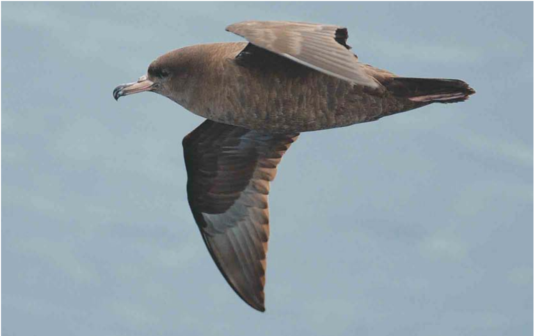
145 Flesh-footed Shearwater / Australische Grote Pijlstormvogel Puffinus carneipes , off St Paul Island, March 2004 (Hadoram Shirihai)