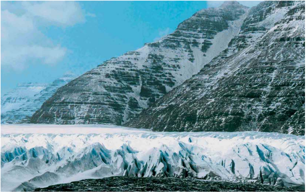
117 Glacier de la Mortadelle, Grande Terre, Kerguelen Islands, September 1997 (Olivier Duriez)