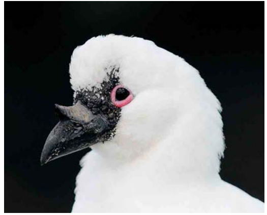
114 Black-faced Sheathbill / Klein IJshoen Chionis minor minor , Crozet Island, March 2004

Yellow-nosed, Grey-headed, Black-browed and a few pairs of Salvin's Albatross ( T c salvini ) mostly breed on Île de l'Est, Île des Apôtres and Île des Pingouins. In Crozet, 19 species of petrel breed but most of the small burrowing species have been expelled from Île de la Possession and Îles aux Cochons because of the presence of cats and rats. However, several millions of pairs still breed on predator-free islands (Île de l'Est, Île des Pingouins, Îles des Apôtres). Around penguin rookeries, large numbers of Lesser Sheathbills Chionis minor crozettensis , Brown Skuas and the small and pale-eyed recently named subspecies of Kelp Gull Larus dominicanus judithae (Kerguelen Gull) (cf Jiguet 2002) can be found. Crozet Shags P albigaster melanogenis , Antarctic Terns S vittata and Kerguelen Terns S virgata always stay close to the shore, while Kerguelen (or Eaton's) Pintails Anas eatoni live in inland marshes. Sea mammals are also common on Crozet. While the population of Southern Elephant Seal Mirounga leonina is declining, those of Subantarctic Fur Seal Arctocephalus tropicalis and Antarctic Fur Seal A gazella are increasing. The coastal waters are inhabited by Killer Whales Orcinus orca .