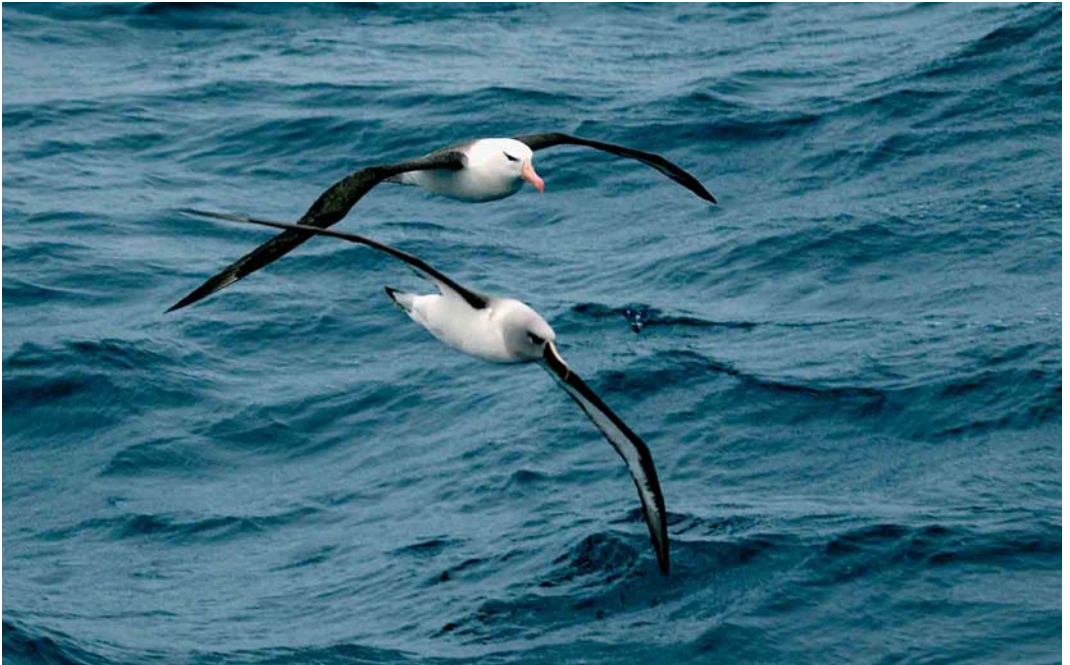
120 Black-browed Albatross / Wenkbrauwalbatros Thalassarche melanophrys (behind) and Grey-headed Albatross / Grijskopalbatros T. chrysostoma (front), off Kerguelen Islands, March 2004