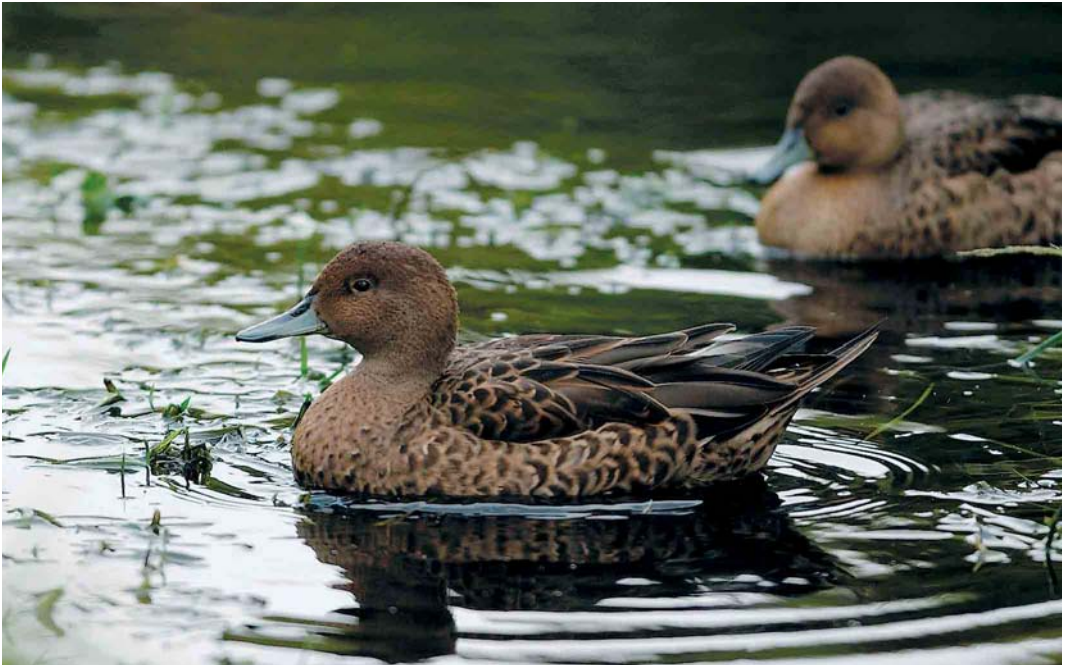
104 Kerguelen Pintails / Kerguelenpijlstaarten Anas eatoni , Crozet Islands, March 2004 ( Hadoram Shirihai )