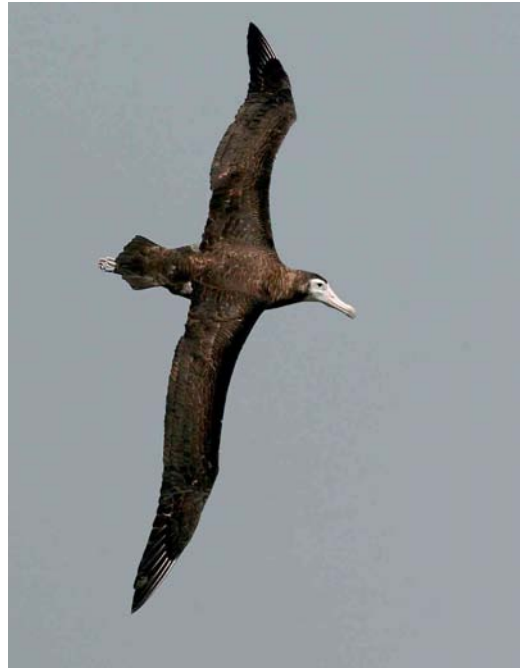
140-142 Amsterdam Albatross / Amsterdameilandalbatros Diomedea (exulans) amsterdamensis , Amsterdam Plateau, Amsterdam Island, March 2004 ( Hadoram Shirihai )