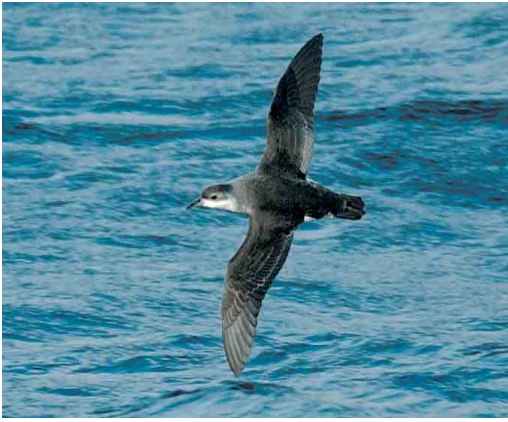
113 Little Shearwater / Kleine Pijlstormvogel Puffinus assimilis elegans , Crozet Island, March 2004 (Hadoram Shirihai)