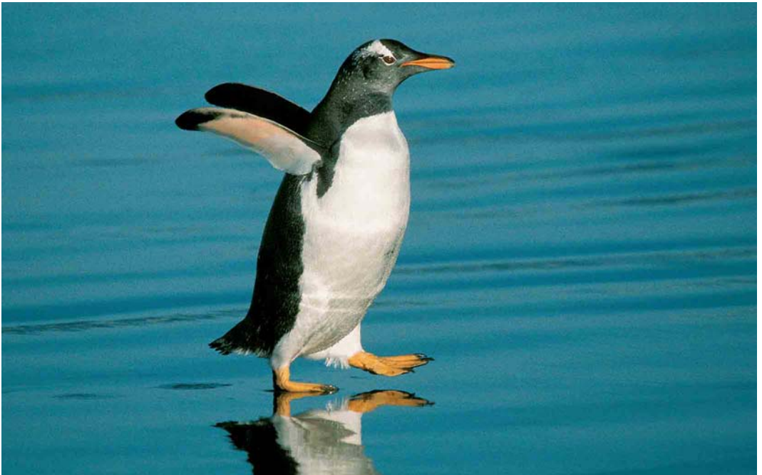
118 Gentoo Penguin / Ezelspinguin Pygoscelis papua , Ratmanoff Beach, Grande Terre, Kerguelen Islands, March 2004