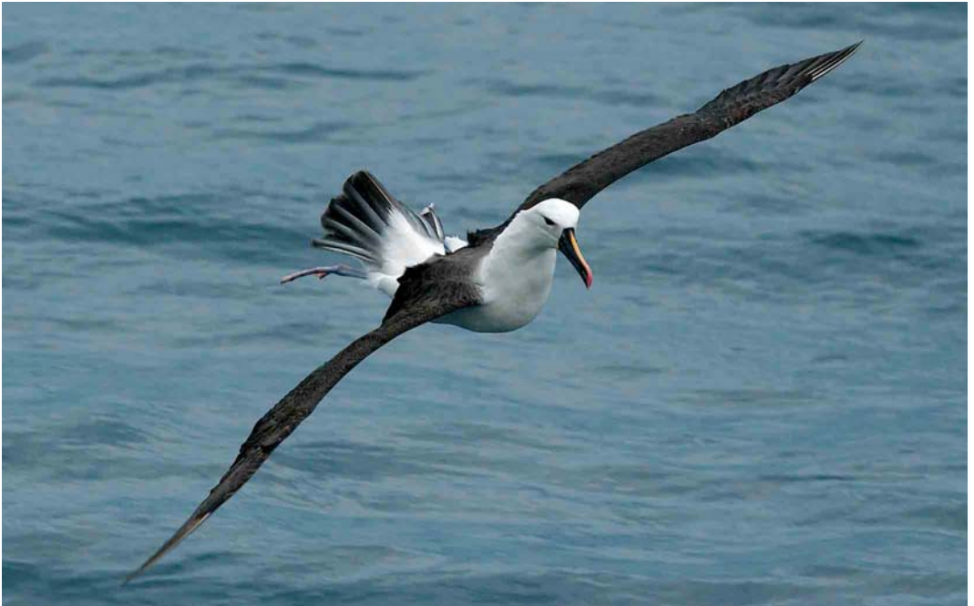
146 Indian Yellow-nosed Albatross / Indische Geelneusalbatros Thalassarche chlororhynchos carteri , off Amsterdam Island, March 2004