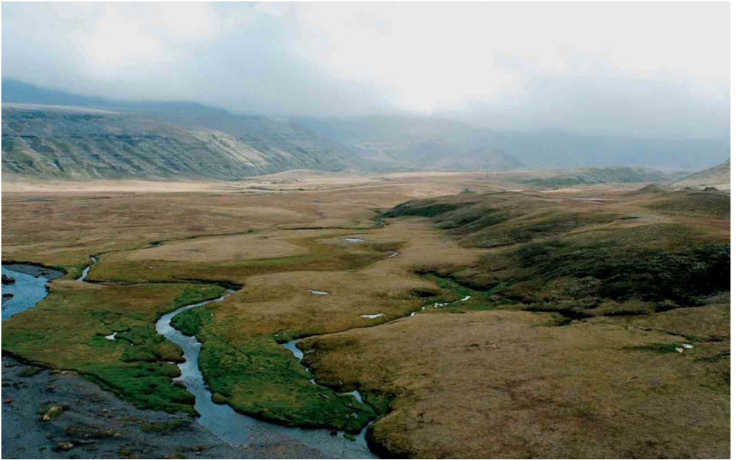
103 Vallée des Branloires, Île de la Possession, Crozet Islands, March 2004 ( Hadoram Shirihai )