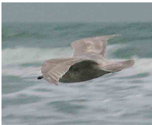
193-195 Kumliens Meeuw / Kumlien's Gull Larus glaucoides kumlieni , tweede-winter, paal 8, Terschelling, Friesland, 29 januari 2005 (Martijn Bunskoek)

van te worden. Desondanks konden we 's avonds tevreden zijn over het resultaat met onder andere Wilde Zwanen Cygnus cygnus , Witbuikrotganzen Branta hrota , een IJseend Clangula hyemalis en het langverblijvende fotomodel, de Zwarte Zeekoet Cephus grylle in de jachthaven van West. De volgende ochtend, 29 januari, stond ik vroeg op om te gaan zee-trektellen maar keerde spoedig verregend terug. Rond 11:00 leek het weer beter te worden en dus liep ik terug naar zee, ter hoogte van paal 8. Het zicht was nu een stuk beter en al snel waren vele Roodkeelduikers Gavia stellata , Roodhalsfuut Podiceps grisegena , Dwergmeeuw Larus minutus , Zeekoet Uria aalge en Alk Alca torda 'in the pocket'. Rond 12:00 werd het