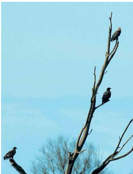
179 Zeereyden / White-tailed Eagles Haliaeetus albicilla , Oostvaardersplassen, Flevoland, 25 januari 2005

ding van een Dikbekfuut Podilymbus podiceps op 17 en 18 februari in het centrum van Den Haag. Winterwaarnemingen van Grauwe Pijlstormvogels Puffinus griseus werden verricht langs Scheveningen, Zuid-Holland, op 9 en 14 januari. Een Vaal Stormvogeltje Oceanodroma leucorhoa werd op 20 januari eveneens bij Scheveningen gezien. Maximaal vijf Kuifaalscholvers Phalacrocorax aristotelis verbleven tot 22 januari bij Neeltje Jans. Verspreid langs de kust werden er nog eens 15 gemeld van 10 locaties. Twee Koereigers Bubulcus ibis vlogen op 15 januari langs Goes, Zeeland, en op 21 februari verbleef er één bij Hem, Noord-Holland. Het hoogste aantal Kleine Zilverreigers Egretta garzetta betrof 34 op 22 januari bij Ouwerkerk, Zeeland. Wintertellingen van Grote Zilverreigers Casmerodius albus in december en januari leverden in totaal 26 slaappleaatsen op met maar liefst 445 exemplaren, waaronder zes locaties met meer dan 30 en als absoluut maximum 58 in Botshol, Utrecht; overigens is dit beeld niet volledig. De Zwarte Ibis Plegadis falcinellus van Huisduinen, Noord-Holland, bleef tot 5 februari. In januari werden vijf Rode Wouwen Milvus milvus gemeld en nog eens vijf in februari. In totaal werden 16 Zeereyden Haliaeetus albicilla doorgegeven, waaronder geregeld drie in de Oostvaardersplassen, Flevoland. Toendraslechtsvalken Falco peregrinus calidus werden op 16 januari gemeld bij Hellevoetsluis, Zuid-Holland, en op 24 januari bij