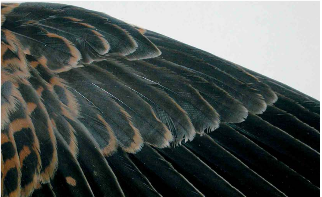
152 Kleine Torenvalk / Lesser Kestrel Falco naumanni , detail van vleugel van eerstejaars vrouwtje (opgeraapt bij Bergen, Noord-Holland, op 5 november 2000), Zoölogisch Museum Amsterdam (ZMA), Noord-Holland, 1 maart 2005 ( Ruud Altenburg ). Let op de ongeklekte zwarte handdekveren / note unmarked black primary coverts. 153 Kleine Torenvalk / Lesser Kestrel Falco naumanni , tenen en nagels van eerstejaars vrouwtje (opgeraapt bij Bergen, Noord-Holland, op 5 november 2000), Zoölogisch Museum Amsterdam (ZMA), Noord-Holland, 28 februari 2005 ( Ruud Altenburg ). Let op de overwegend lichte nagels (bij balgen kunnen de nagels iets donkerder worden dan bij levende vogels) / note largely pale claws (claws may become slightly darker in specimens than in live birds).