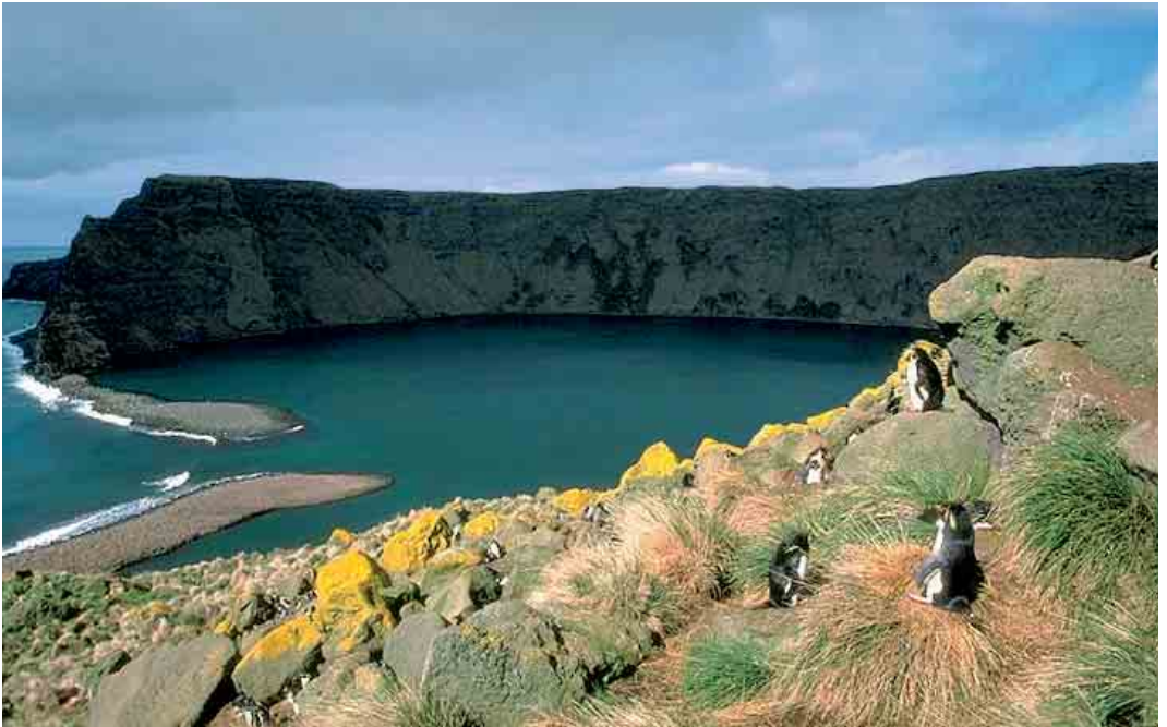
144 St Paul Island, 1995 ( Dominique Filippi ). A rookery of Northern Rockhopper Penguins / Noordelijke Rotspinguïns Eudyptes chrysocome moseleyi dominates the crater of this island.