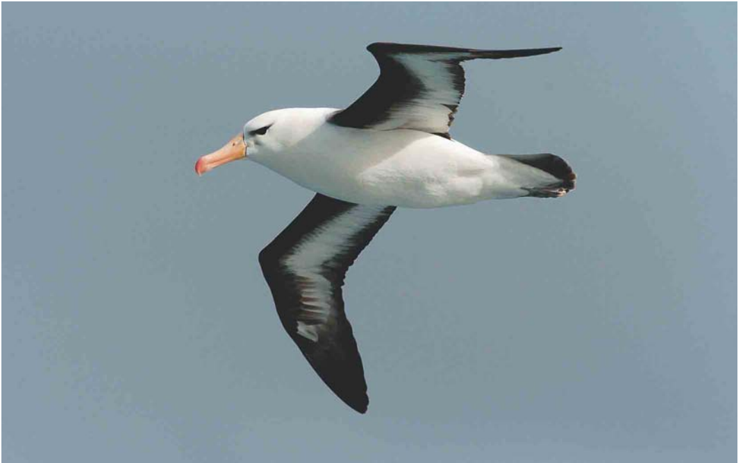
119 Black-browed Albatross / Wenkbrauwalbatros Thalassarche melanophrys , off Kerguelen Islands, March 2004