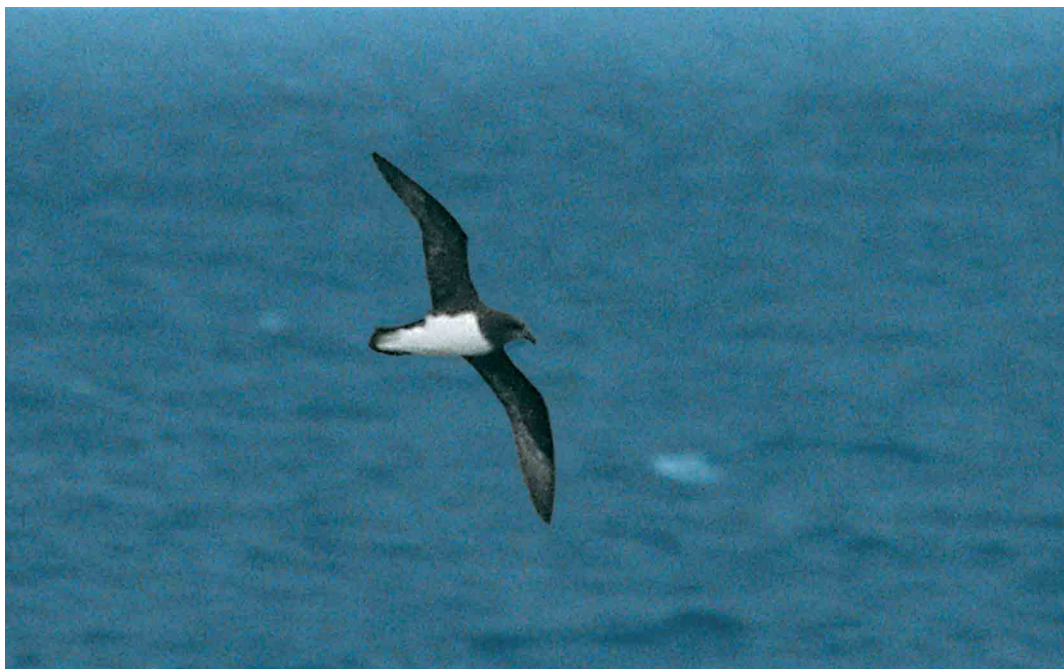
156-158 Magenta Petrel / Magentastormvogel Pterodroma magentae , Southern Pacific Ocean at 45:08.2 S 177:12.9 W, between Bounty Islands and Chatham Islands, 24 December 2004