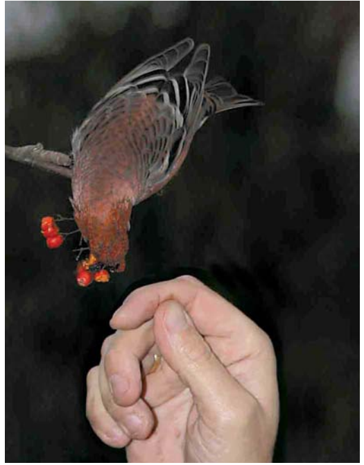
396 Haakbek / Pine Grosbeak Pinicola enucleator , adult mannetje, Beijum, Groningen, Groningen, 17 november 2004 397 Haakbek / Pine Grosbeak Pinicola enucleator , adult mannetje, Beijum, Groningen, Groningen, 18 november 2004 398 Haakbek / Pine Grosbeak Pinicola enucleator , adult mannetje, Beijum, Groningen, Groningen, 19 november 2004