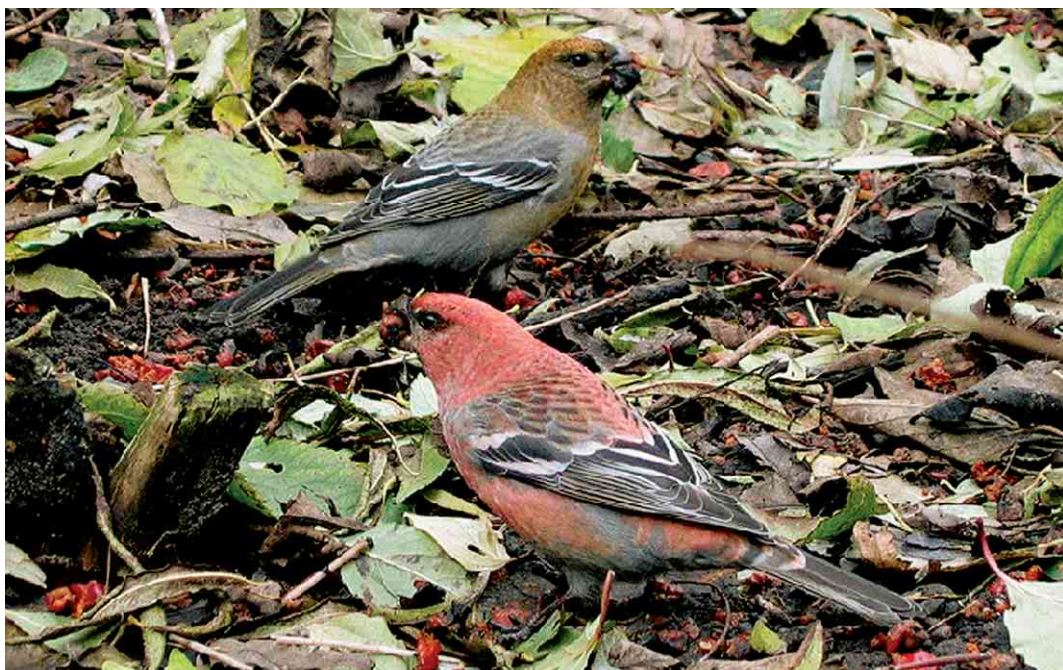
393 Haakbekken / Pine Grosbeaks Pinicola enucleator , adult mannetje en vermoedelijk adult vrouwtje, Beijum, Groningen, Groningen, 18 november 2004