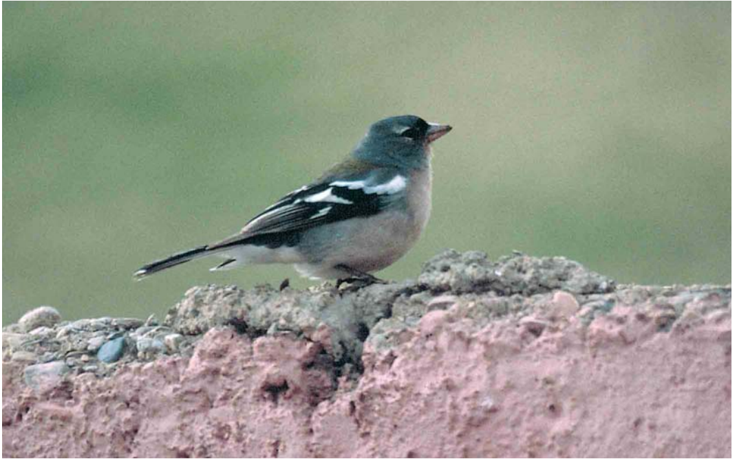
366 Atlas Chaffinch / Atlasvink Fringilla coelebs africana , male, Agadir-Taroudannt, Morocco, 24 January 1987. This bird shows a suggestion of the upper eye-crescent bleeding off into a very faint sort of supercilium which may be more typical of spodiogenys . 367 Atlas Chaffinch / Atlasvink Fringilla coelebs africana , male, Jendouba, Tunisia, 3 May 2005