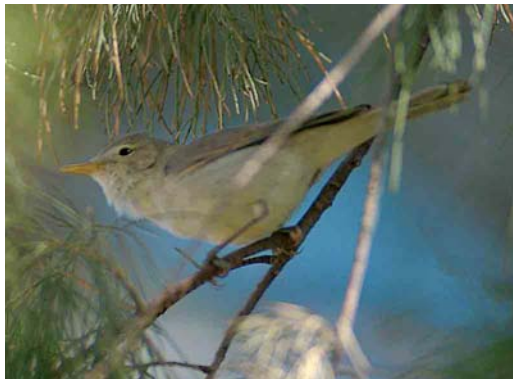
374-375 Saharan Olivaceous Warbler / Saharaanse Vale Spotvogel Acrocephalus pallidus reiseri , Arram, Gabès, Tunisia, 1 May 2005 (René Pop)

Olivaceous, while Western Olivaceous keeps its tail still (Parkin et al 2004, Jiguet 2005, Ottoson et al 2005). Both Western Olivaceous and Saharan Olivaceous use similar tac calls but they differ in song. The latter's more monotonous and somewhat coarse sounding song has a structure characteristic of Eastern Olivaceous as parts of a few seconds in length are repeated ('cycling') while the more pleasing song of Western Olivaceous is not characterized by repetitions of such long sections (Ottoson et al 2005, Magnus Robb in litt).