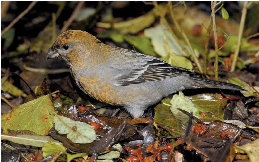
392 Haakbek / Pine Grosbeak Pinicola enucleator , vermoedelijk adult vrouwtje, Beijum, Groningen, Groningen, 17 november 2004