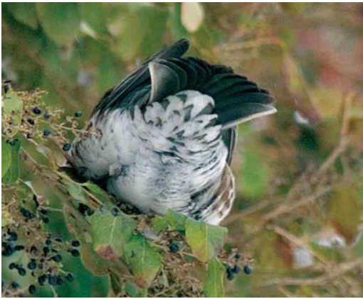
mystery photograph IX (September)