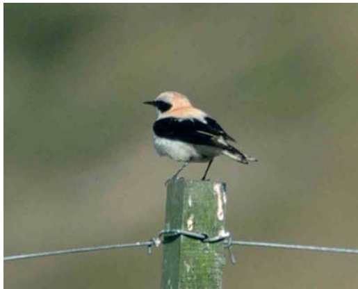
379-380 Westelijke Blonde Tapuit / Western Black-eared Wheatear Oenanthe hispanica , eerste-zomer mannetje, Lies, Terschelling, 11 mei 2001

Tapuit. Lengte van zichtbare handpennen ongeveer tweederde van lengte van tertiaals. Vleugeltop niet voorbij helft van staart komend.