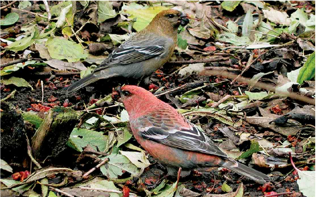
393 Haakbekken / Pine Grosbeaks Pinicola enucleator , adult mannetje en vermoedelijk adult vrouwtje, Beijum, Groningen, Groningen, 18 november 2004