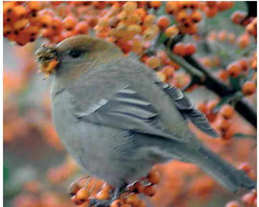
389 Haakbek / Pine Grosbeak Pinicola enucleator , vrouwtje of eerste-winter mannetje, Zandkreek, Alkmaar, Noord-Holland, 20 november 2004 ( John Hoedjes )

Op 16 november 2004 liep Jacob Bosma in de regen te zoeken naar Pestvogels Bombycilla garrulus in Beijum, een groene buitenwijk aan de noordoostkant van de stad Groningen. Om ongeveer 16:00 zag hij tot zijn verbazing op enkele meters afstand op een grasveldje nabij de Bekemaheerd en de Kremersheerd een vrouw-tijstype Haakbek zitten. Zich bewust van het belang van deze ontdekking belde hij direct met Dušan Brinkhuizen om het nieuws te verspreiden. Ondertussen bleek het eerst ontdekte exemplaar vergezeld door een adult mannetje dat in eerste instantie door een passerende wandelaar