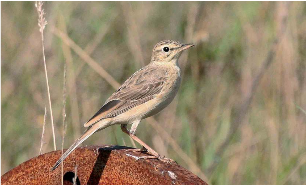
440 Duinpieper / Tawny Pipit Anthus campestris , Hessenpoort, Zwolle, Overijssel, 30 augustus 2005

op 31 augustus op de Strabrechtse Heide, waarvan vier overvliegend. Na een melding van een Roodpootvalk Falco vespertinus op 10 juli bij Hardinxveld-Giessendam, Zuid-Holland, volgden er na half augustus nog eens zes.