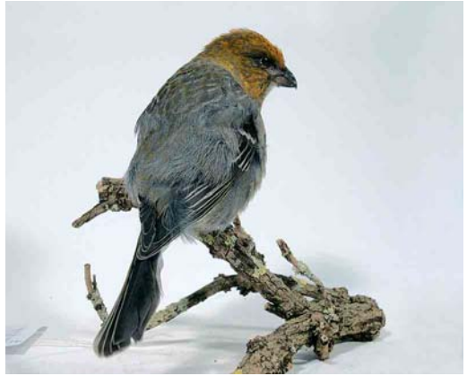
387 Haakbek / Pine Grosbeak Pinicola enucleator , eerste-winter mannetje (gevonden in Leeuwarden, Friesland, op 15 november 2004), Natuurmuseum Fryslân, Leeuwarden, 18 februari 2005

werd hij dood aangetroffen. De vogel is inmiddels opgezet en bevindt zich nu in het Natuurmuseum Fryslân in Leeuwarden. AH meldde per telefoon dat het niet zeker is dat de vogel tegen het raam is gevlogen. Dat was alleen haar veronderstelling toen ze hem versuft aantrof. Bij inspectie in het museum bleek hij de rechterhelft van zijn staart te missen. Het kan dus ook zijn dat er een kat in het spel is geweest (Peter Koomen in litt). Bij inspectie werd verder geconstateerd dat de vogel vermagerd was en geen vet-reserves had. Op 18 februari 2005 heeft Bert de Bruin de inmiddels opgezette vogel bestudeerd en gefotografeerd.