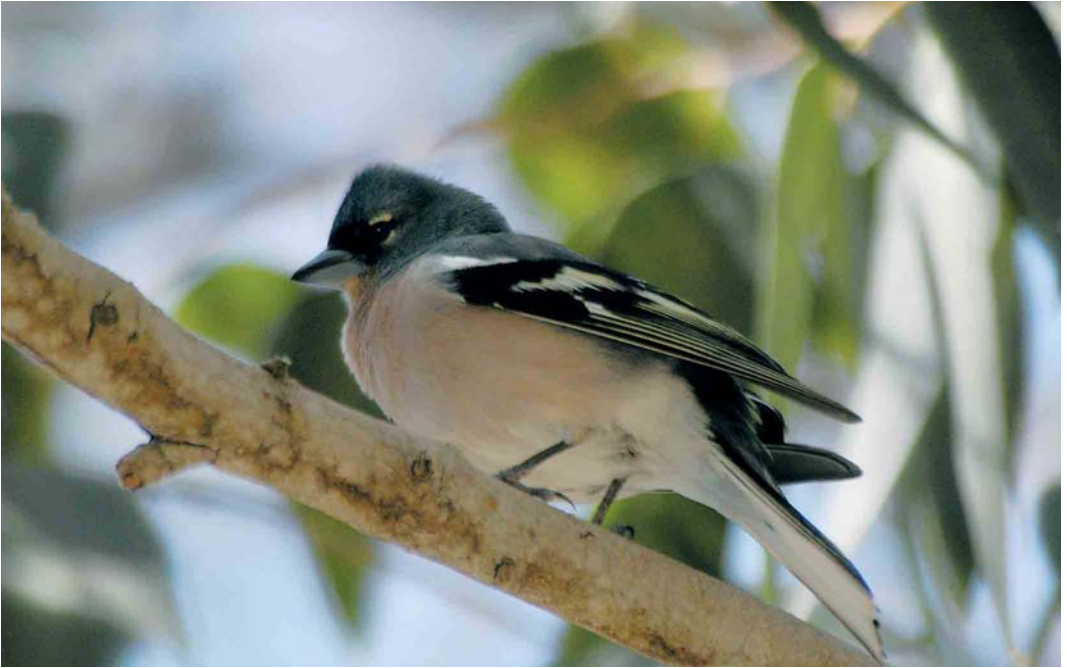
364-365 Atlas Chaffinch / Atlasvink Fringilla coelebs africana , male, Oued Massa, Souss, Morocco, 15 April 2005