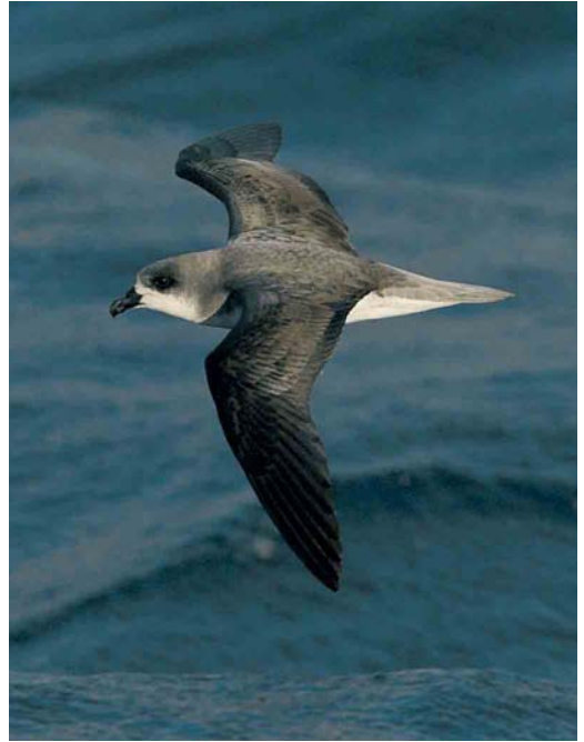
418 Lesser Crested Tern / Bengaalse Stern Sterna bengalensis , Happisburgh, Norfolk, England, 17 July 2005 ( Paul Hackett ) 419 Fea's Petrel / Gon-gon Pterodroma feae , Bugio, Madeira, August 2005 ( Hugh Harrop ) 420 Yellow-billed Loon / Geelsnavelduiker Gavia adamsii , Holm Sound, Orkney, Scotland, 30 July 2005 ( Paul Hackett )