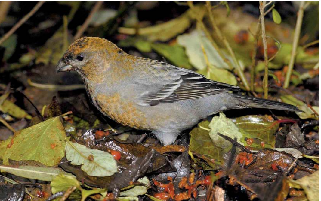
392 Haakbek / Pine Grosbeak Pinicola enucleator , vermoedelijk adult vrouwtje, Beijum, Groningen, Groningen, 17 november 2004