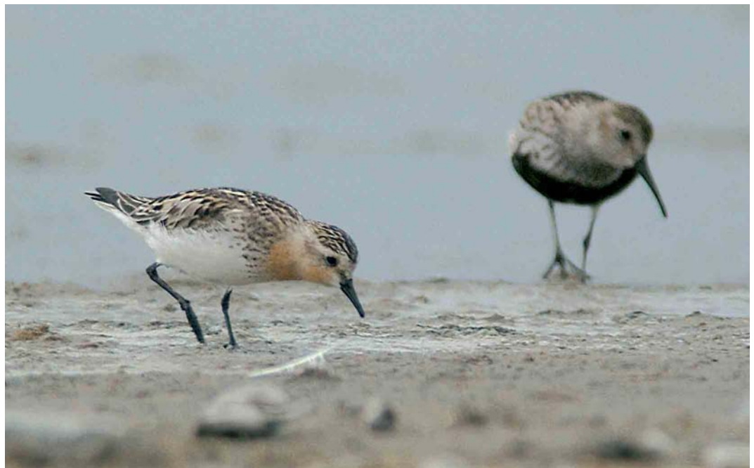
446 Roodkeelstrandloper / Red-necked Stint Calidris ruficollis , adult, met Bonte Strandloper / Dunlin C alpina , adult, Wagejot, Texel, Noord-Holland, 24 juli 2005