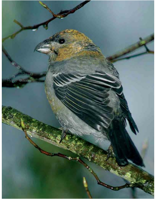
399 Haakbek / Pine Grosbeak Pinicola enucleator , adult mannetje, Beijum, Groningen, Groningen, 18 november 2004 (Roland Jansen) 400 Haakbek / Pine Grosbeak Pinicola enucleator , vermoedelijk adult vrouwtje, Beijum, Groningen, Groningen, 17 november 2004 (Arnoud B van den Berg) 401 Haakbek / Pine Grosbeak Pinicola enucleator , adult mannetje, Beijum, Groningen, Groningen, 20 november 2004 (Bas van den Boogaard)